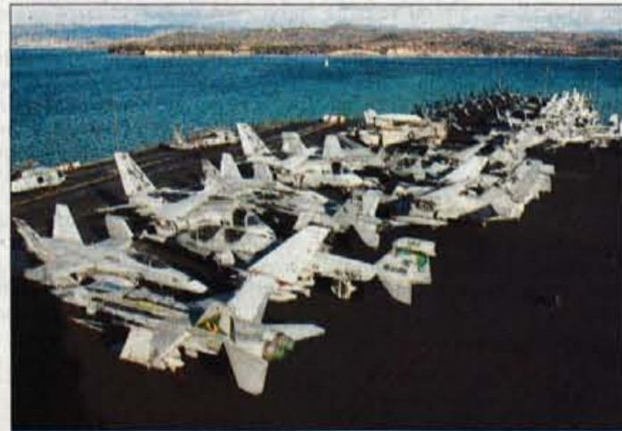
Na krovu je prek 80 letal.

ro hčerko. Za oba skrbi mož, na katerega se popolnoma zanese, kljub temu pa je bila izredno presenečena ob našem podatku o enoletnem porodniškem dopustu v Sloveniji, medtem ko se v Združenih državah Amerike mamicе vrnejo v službo že šest tednov po rojstvu otroka. Malonova je zav-