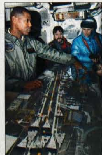
Nadzor letal ob vzletni stezi s posebnimi "modelčki".