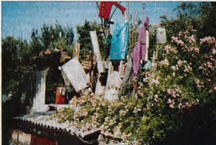
Poleti cvetje vsaj delno zakrije vso navlako.

Na vprašanje, ali je sploh kaj možnosti, da vendarle odstrani vso šaro, ki jo je navlačil ob dovožno pot, je Debeljak odgovoril: "Saj mu osebno sploh nič no-