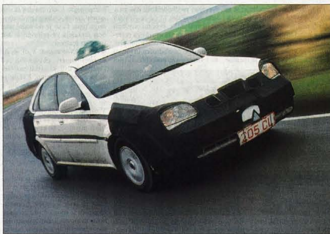
Nova nubira, ki je bila uradno sicer že pokazana na avtomobilskem salonu v Seulu, se po evropskih cestah poskusno vozi še skrbno zamaskirana.