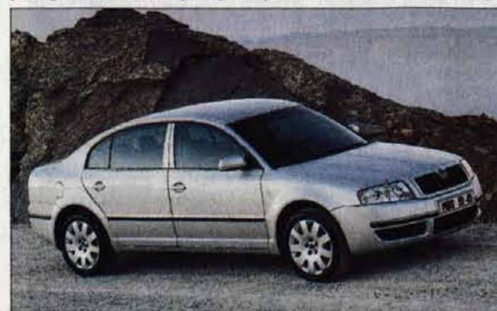
Tudi na slovenskem trgu superb ni pridobil toliko kupcev, kot so želeli pri zastopniku Avtoimpexu, vendar so z lansko prodajo 35 avtomobilov zadovoljni.

Jaguar postavlja na cesto sedmo generacijo zastavonoše XJ