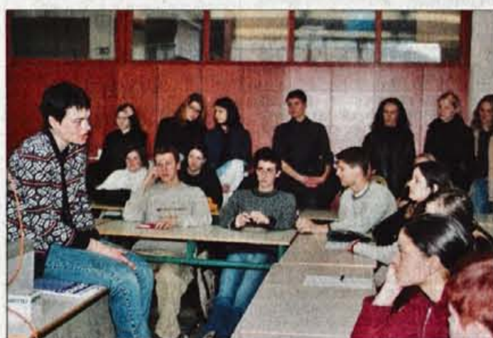
Dijaki so z zanimanjem poslušali izkušnje študentov in se nad svojo prihodnostjo občasno tudi zamislili.

slovanje, ki so mladim ponudili informacije o štipendiranju, možnostih zaposlovanja in izobrazbenih profilih, ki jih potrebujejo. Žal se povabilu niso odzvala tudi ostala pomembna podjetja v Kranju, ki so organizatorji sicer povabili k sodelovanju. Ob predstavitev fakultet in podjetij so mladi dobili informacije tudi v posebni zloženki Napotnik.