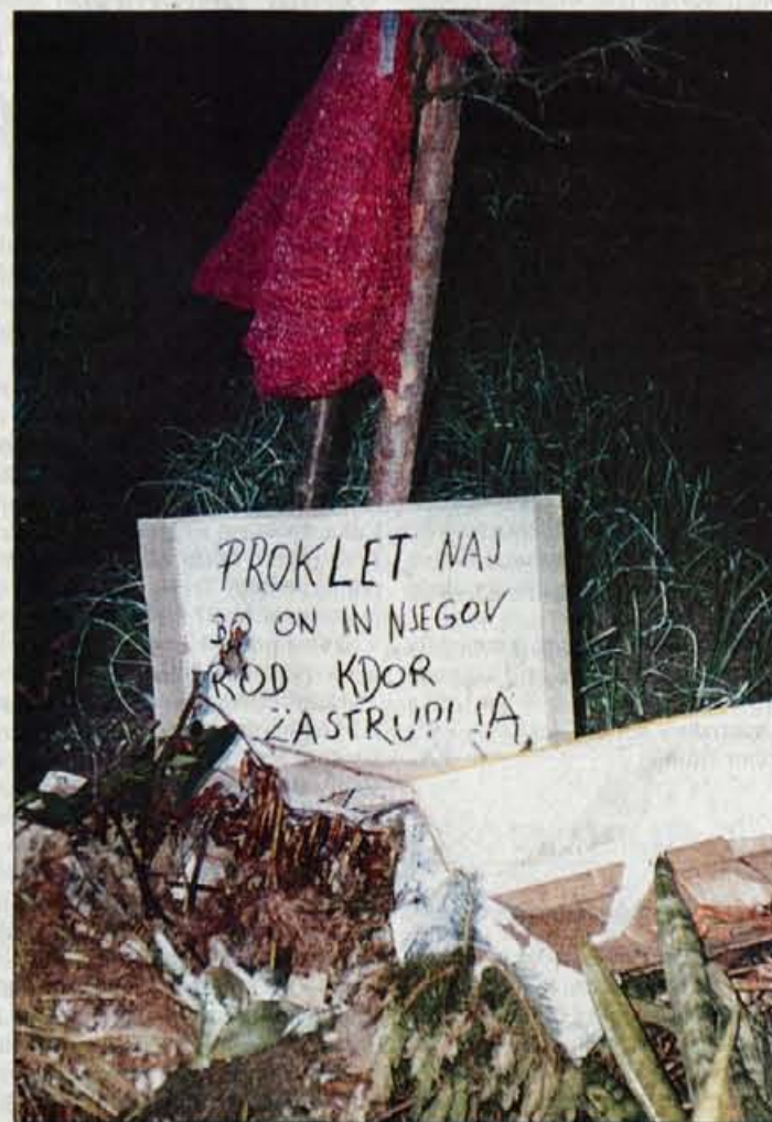
Nekdo je postavil tudi zgornji napis.