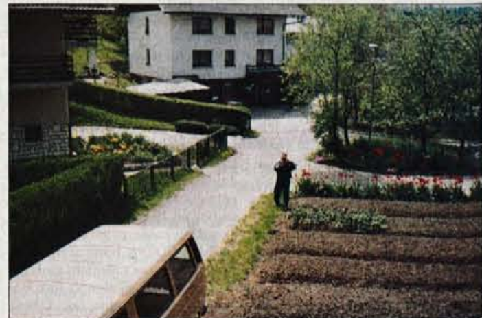
Posnetek iz časov, ko je bila bankina še navadna zelenica.

Debeljak zatrjuje, da mu sosed z nečim poliva vrt, tako da ima že