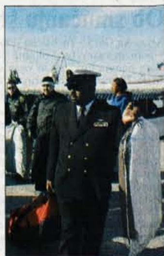
Dve tretjini posadke je imelo možnost oglada Slovenije.

Sicer ne preveč zgovorni mornarji so nam povedali, da so se v mornarico vključili prav zato, da bi videli čim več sveta - zato so se obiska naše dežele zelo razveselili. Vsi niso odšli le v Koper (nekateri so ostali kar v improvizira-