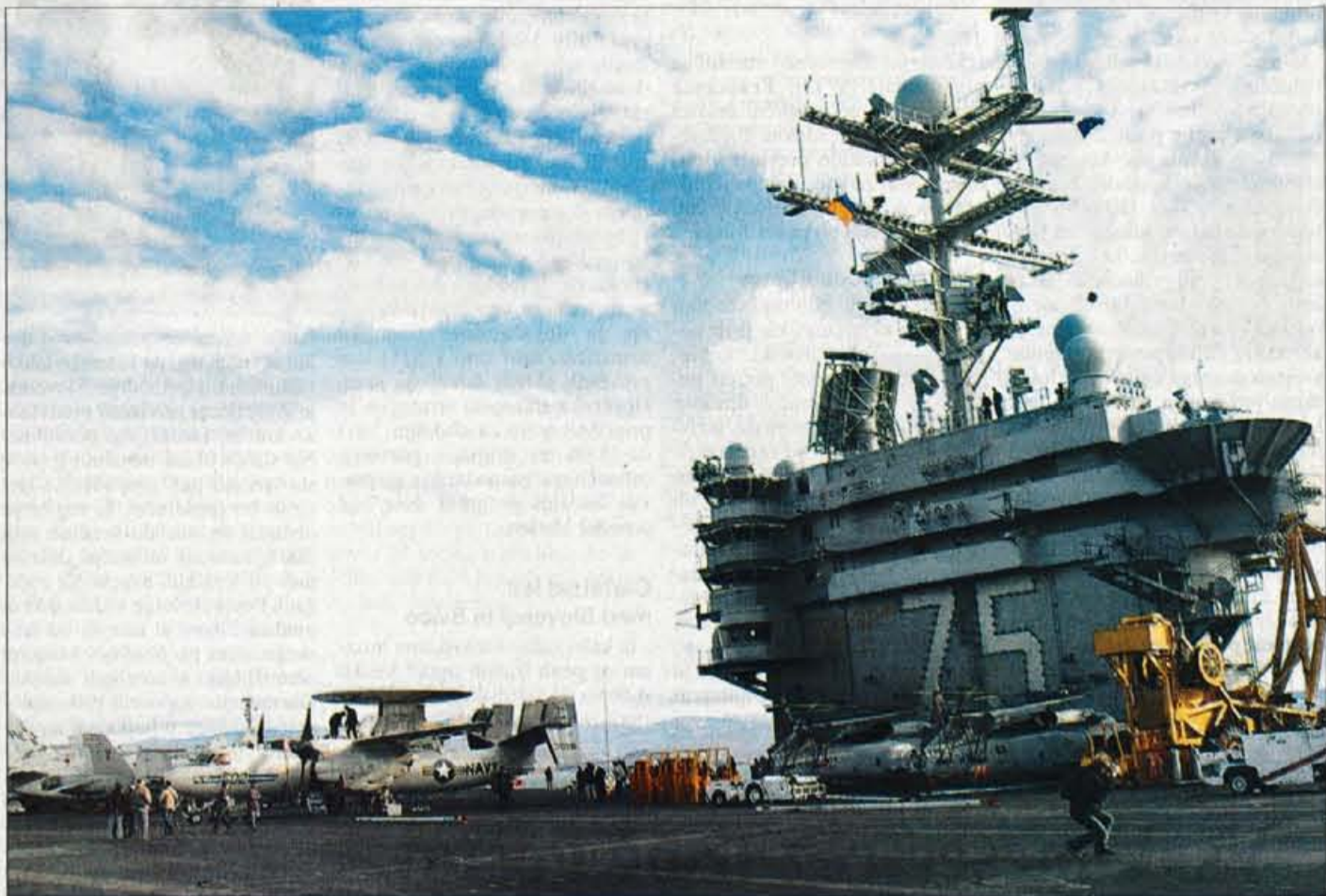
Letalonosilko Harry S. Truman poganjata dva jedrska reaktorja, ki ju napolnijo le dvakrat v vsej življenjski dobi. Ta znaša 50 let.

Številno posadko predstavlja tudi 600 žensk, za katere tradicionalno pravimo, da so bolj občutljive. Vse to je predstavnica za stike z javnostmi demantirala z odgovorom na vprašanje, ali se po-