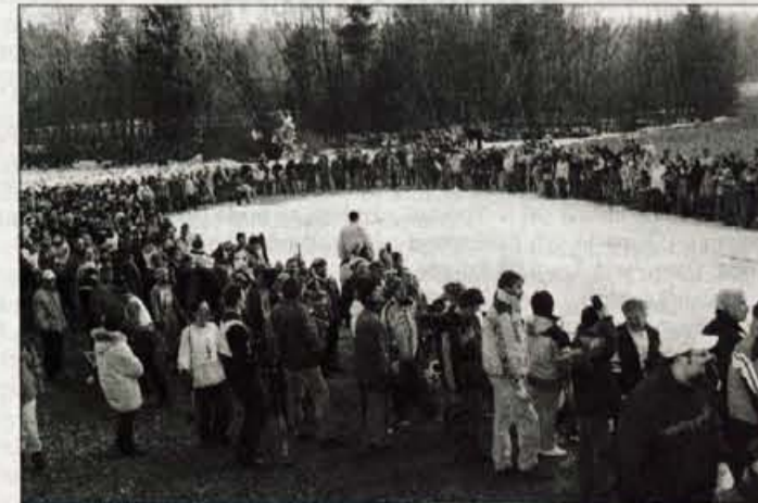
Med popoldansko tekmo se je zvrstilo okrog tisoč obiskovalcev.

Prireditve pa je postala nekako prestižna ne le zaradi decimetrov,