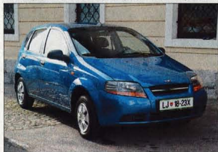
Največje breme prodaje na slovenskem trgu bo nosil lani novi Daewoojev malček kalos.

KALOS IN EVANDA TAKOJ, NUBIRA POLETI - V začetku prodaje sta na slovenskem trgu na voljo tudi dve sicer že nekaj časa pričakovani Daewoojevi novosti. Petratni kalos z 1,4-litrskim motorjem in osnovno opremo (varnostna vreča za voznika, osrednja ključavnica, volan s servoojačevalnikom in električno pomična stekla spredaj) stane 1.749.000 tolarjev, štirivratna limuzina je za 50 tisočakov dražja, spomladi pa bo na voljo tudi različica z 1,2-litrskim motorjem in ceno 1.699.000 tolarjev. V prodajnem programu je že tudi limuzina evanda, medtem ko bo nova nubira v podobi štirivratne limuzine na slovenske ceste zapeljala poleti, petratna različica pa nekoliko kasneje.