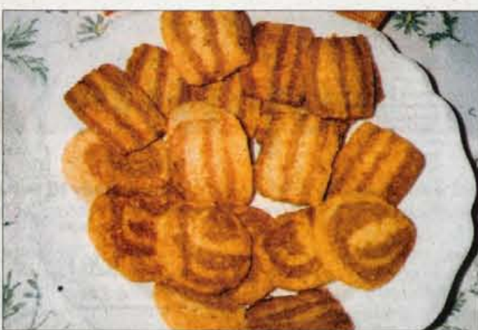
Tile pisani krhki orehovi piškotki bodo prijazna popestritev pod smrečico.