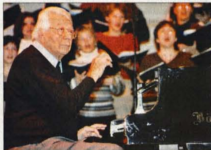
Skladatelj v družbi slovenskega zbora, umirjen, zadovoljen...