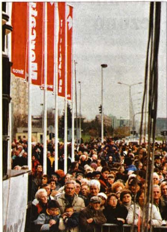
Mercator ima osemnajst nakupovalnih centrov. Od tega trinajst v Sloveniji, tri na Hrvaškem, enega v Bosni in Hercegovini in sedaj tudi enega v ZR Jugoslaviji. Pri vseh odprtih je vedno prisotno veliko število ljudi, vendar tokrat je to preseglo vsa pričakovanja.

Vendar dogajanje pred Mercatorjem po zaključku slovenskega odprtja ni zamrlo. Svečana otvoritev se je nadaljevala znotraj stavbe z navalom množice, ki je želela videti prav vse, zunaj pa se je do večernih ur odvijal koncert, kjer je nastopilo veliko znanih imen iz srbske, hrvaške in slovenske glasbene scene.