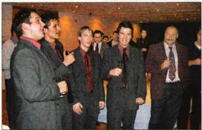
Modrijani so po nastopu proslavljali zmago.