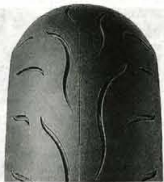
rabili nove tehnološke dosežke, ki so izhajajo iz dirkaškega sveta.

Proizvajalec gum Dunlop je pred kratkim predstavil svojo novo pnevmatiko za motocikle razreda supersport. Aktualni Dunlopova guma za ta razred je priznani sportmax D207, ki se je sicer zelo dobro izkazal. A motocikli so v zadnjih nekaj letih močno napredovali, zato so gumarji veliko vlagali tudi v razvoj športnih motociklističnih gum. D208 je na videz skorajda povsem enaka predhodnemu D207, a se odlikuje s še boljimi lastnostmi. V primerjavi z D207 se odlikuje je novinka predvsem bolj vodljiva, ima boljši oprijem in vozniku ponuja boljše čutenje ceste. V sami gumarski zmesi so inženirji upo-