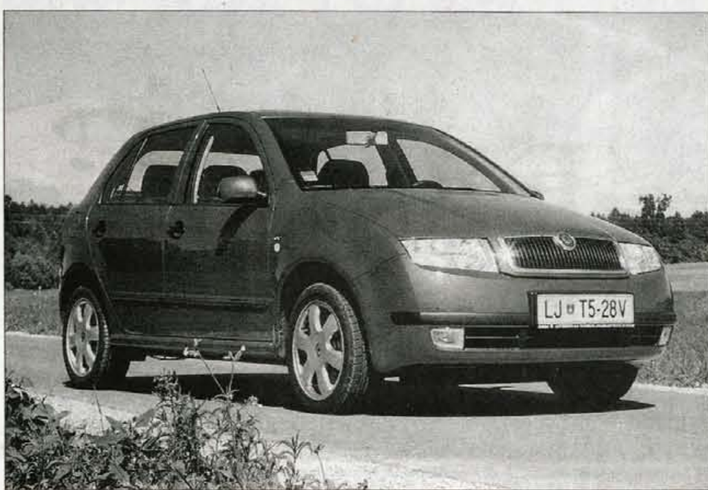
Fabia je oblikovana v skladu z modnimi zapovedmi, zato jo nekaj časa verjetno še ne bo potrebno zapeljati k lepotnemu kirurgu.

■ preglednost nazaj, manjše desno bočno ogledalo, premalo energičen motor, neuravnotežena cena