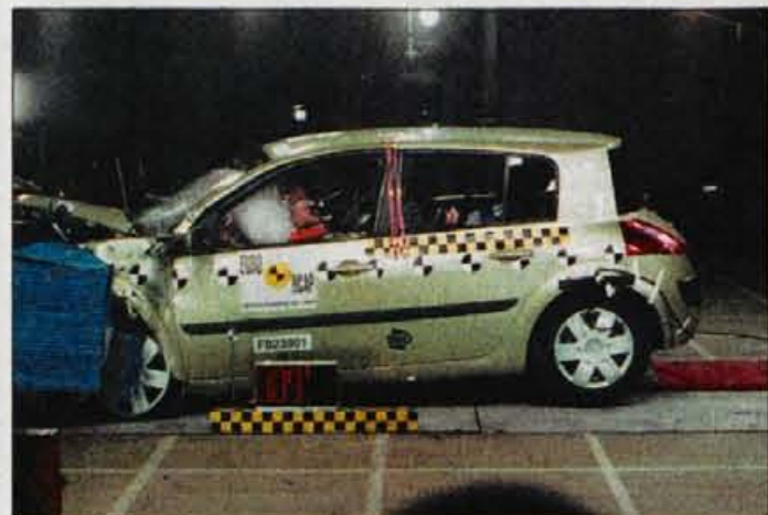
Renault megane je prvi in za zdaj edini predstavnik spodnjega srednjega razreda, ki je bil ocenjen s petimi zvezdicami.

V skladu s pričakovanimi in najavljenimi novostmi bodo se bo program naslednjih varnostnih preizkusov EuroNCAP osredotočil pre-