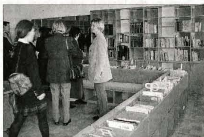
Šola je končno dobila tudi knjižnico.

Ves ta čas je bila šola premajhna, zato so imeli učenci ves povojni čas pouk na različnih mestih v kar treh vaseh: v Breznici, Zaberznici in na Selu. Pouk so imeli v dveh izmenah. Žirovniški otroci so se veselili jeseni leta 1958, ko so se vselili v takrat svetlo, novo in lepo sedanjo šolo z razredno stopnjo v Zabreznici. Pouk je za 373 učencev potekal dopoldan in popoldan, nekaj oddelkov pa je še ostalo na stari šoli v Breznici. Šola ni imela telovadnice, ne knjižnice, ne jedilnice, le "fizikalnico" in risalnico. Število učencev je še kar naraščalo in v šolskem letu