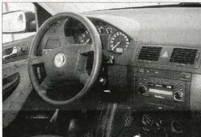
Notranjost: racionalnost in uporabnost na prvem, oblikovanje na drugem mestu.

Fabia ima poleg prikupne zunanosti, ki sicer res ne ugaja vsem okusom, še en pomemben adut, ki se razodeva takoj po vstopu v potniško kabino. Prostornost je kljub zunanjim meram, ki so tipične za majhne avtomobile, skoraj na ravni za številko večjega razreda, kar