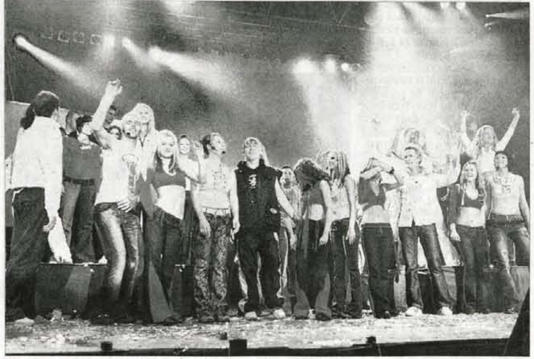
Na koncu so se vsi glasbeni izvajalci pojavili na odru.