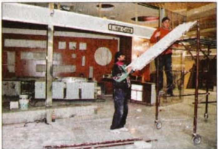
Dan pred odprtjem ...

ritvi s svojo "trobentaško" pesmijo, slavnostna govorca pa sta bila zunanji minister ZR Jugoslavije Goran Svilanović in slovenski zunanji minister Dimitrij Rupel, ki se ni mogel odločiti v katerem jeziku bi prisotne nagovoril - v slovenščini ali srbsčini. Bil pa je zelo zadovoljen, da se stvari odvijajo tako kot se in da spet prihaja do plodnih sodelovanj med Slove-