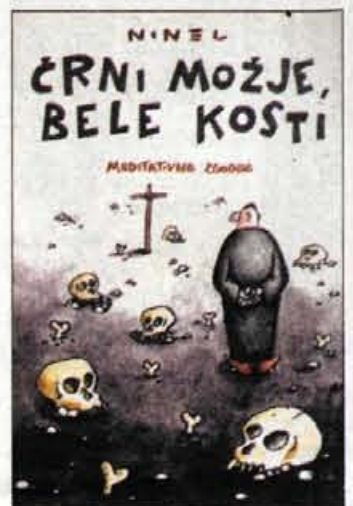
ki jih je v dveh tisočletjih v naših krajih pustilo krščanstvo.