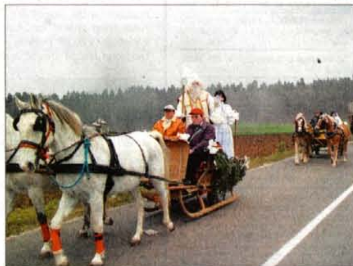
Na glavni trg se je Miklavž s spremstvom pripeljal na saneh.