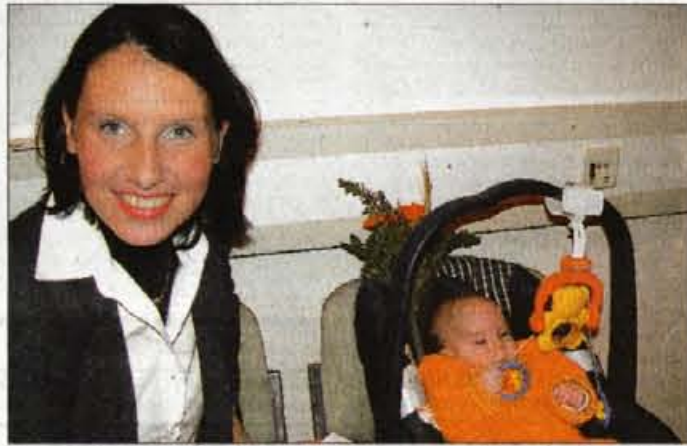
Veri, pevko ansambla Jevšek, je na reviji spremljal tudi najmlajši član mlade družine.

kosala s skladbo Modrijanov Spomin na pevca še živi za Naj vižo leta. Nazadnje pa so se pred nastopom Modrijanov iz Dobrne predstavili še člani ansambla Koronine pod vodstvom Vilija Horvata prav tako z valčkom Vse bi dala. Revija na Bledu je z nastopajočimi in predstavljenimi najlepšimi valčki in polkami tako v prazničnem razpoloženju iztekaajočega se leta še enkrat potrdila priljubljenost radijskih oddaj in predstavitev med letom. Letošnja posebnost pa niso bili le valčki, ki so prevladovali med najlepšimi skladbami. Prirčna posebnost so bili tudi najmlajši obiskovalci na