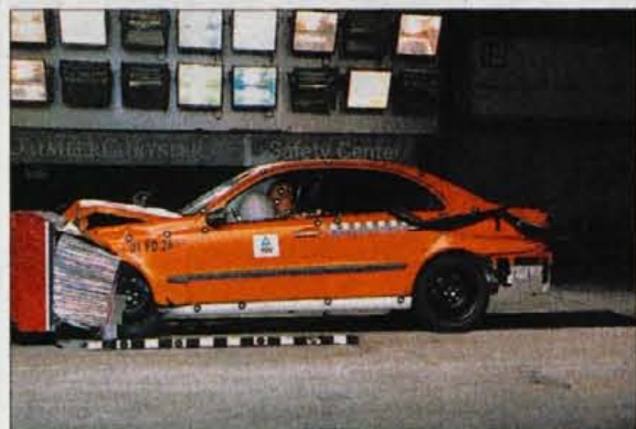
Mercedes-benz razreda E je bil že v razvojnem ciklusu podvržen zahtevnim tovarniškimi preizkušnjem.

dvsem na terence in dvosedelne varnosti pešcev, ki je zaenkrat pri športne avtomobile, precej več pozornosti pa bo posvečene raziskavi večini avtomobilov še vedno precej šibka točka. Matjaž Gregorič