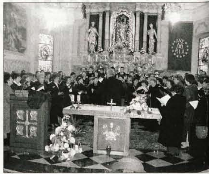
Združeni cerkveni pevski zbori radovljiške dekanije med vajo za skupni nastop na zaključku nedeljske revije v Lescah.

mešani pevski zbor župnije sv. Nikolaja iz Bohinjske Bistrice, mešani pevski zbor župnije Marijinega vnebovzeta Lesce, mešani pevski zbor Skala iz župnije sv. Petra v Radovljici, mešani pevski zbor župnije sv. Martina Srednja