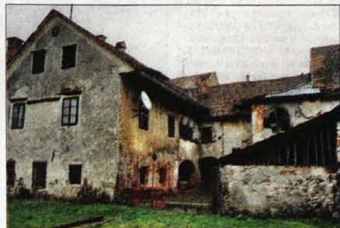
Pogled z vrta na hišo v Tomiščevi.

turnimi inštitucijami. Tu so namreč že Gorenjski muzej, lutkovno gledališče, zavod za varstvo naravne in zavod za varstvo kulturne dediščine, na nazadnje tudi Prešernovo gledališče. Prostor med Khislsteinom in še nedokončanim Škrlovcem oziroma Layerjevo hišo bi bil po njunem mnenju idealen za novo mestno knjižnico, saj je občina že lastnica večine hiš na tem delu Tomiščeve ulice. Preden bo mestni svet odločil o novi lokaciji osrednje knjižnice,