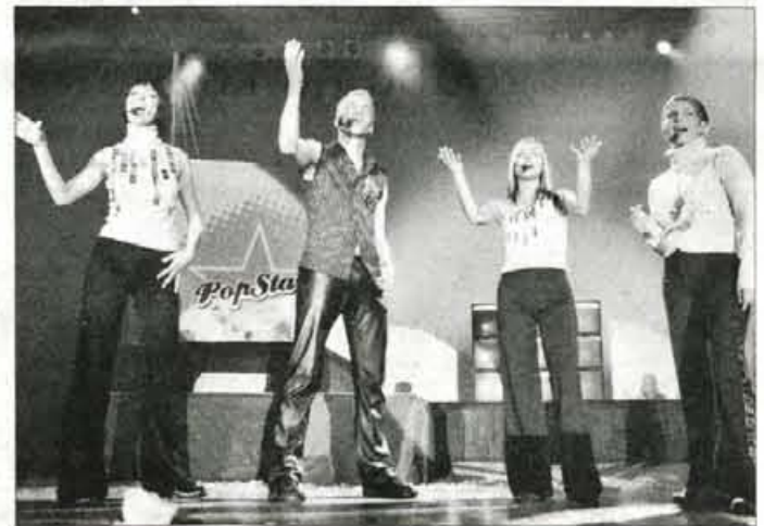
Najbolj pričakovana glasbena skupina večera - Be Pop.

Game Over. Be Popovci pa so nastopili zadnji ter poželi bučen aplavz, ogromno skandiranja njihovega imena, oboževalke so potočile celo nekaj solz. Predvsem pa so s pesmijo Ti si moje sonce spravili vse sedeče najstniško občinstvo na noge in ko so odšli zadnji pesem, so jih ti s težavo spustili z odra. Med Be Popovci