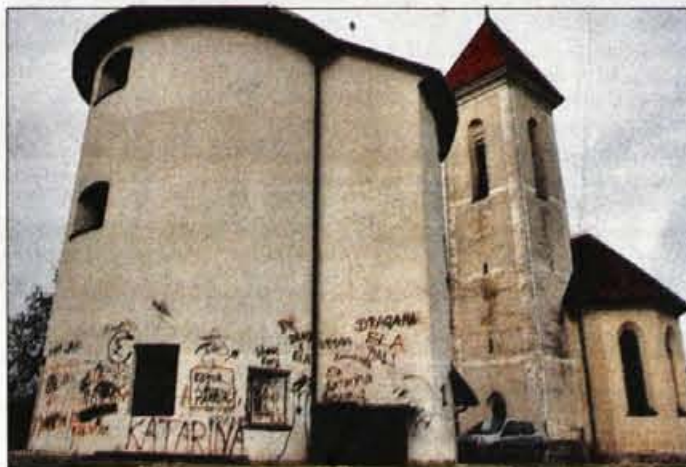
Grafiti na Pungratu.