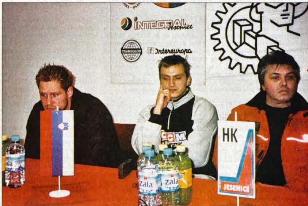
Jeseničani so bili po sobotnem porazu na tiskovni konferenci bolj mrkih obrazov.

Sicer pa so konec tedna zadnji krog I. dela letošnjega državnega hokejskega prvenstva odigrale tudi ostale ekipe. Za največje