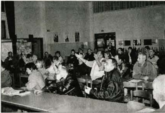
Krajanje Frankovega naselja so razburjeni predvsem zaradi neprimerne lokacije. Proti zbirnemu centru na primernem mestu pa nimajo nič.

Krajanje so odgovarjali, da gre tu za stanovanjsko območje ter sekundarni mestni center. Zato menijo, da bi bila tudi potrebna vsaj 14-dnevna javna razgrnitev. Tudi v strokovni oceni naj bi bile napake, pritoževali so se tudi nad vodenjem postopka in obveščanju javnosti. Jorg Hodalič iz E-neta je povedal, da je bil postopek izpeljan korektno in zavrača navedbe o napakah. "V javno razgrnitev bi morali, če bi tu zbirali 50 ton odpadkov in ne 2 tona, ter 5000 kilogramov nevarnih odpadkov in ne naših 600 kilogramov. Po izkušnjah v tujini je bila naša strokovna ocena, da je bila lokacijska dokumentacija upoštevana in postopek pravilno izpeljan. Vse skupaj nima veze z volitvami, saj zadeve peljemo že od lani, vse postopke glede dokumentov pa vodi uprav-