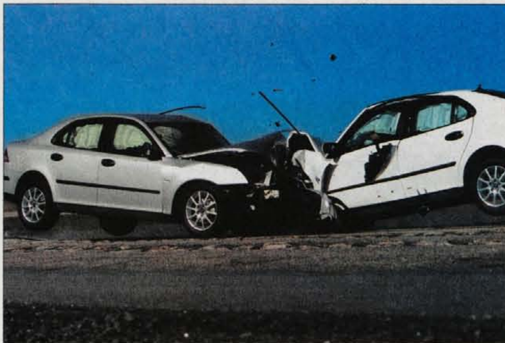
Pri Saabu varnost preizkušajo tudi z medsebojnimi preizkusnimi trčenji enakih avtomobilov.

Od skupaj 18 avtomobilov, ki so jih zapeljali na preizkusno trčenje Euro NCA, jih je bilo enajst ocenjenih s štirimi zvezdicami (nissan primera, subaru legacy out-