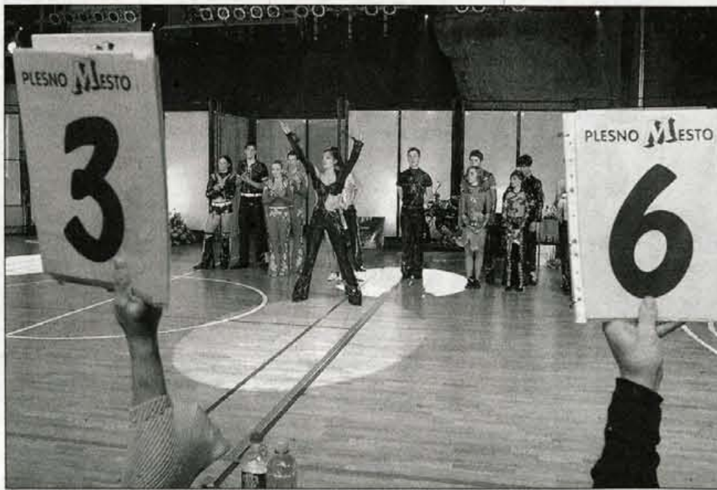
Tekmovalci vedno nestrpnost pričakujejo ocene sodnikov, ki so včasih tudi zelo različne.