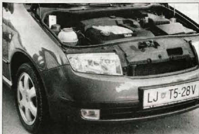
Najmočnejši motor s 115 konjskimi moči bi lahko izžareval nekaj več energije.

2,0-litrski bencinski štirivaljni, ki na papirju razvije 115 konjskih moči naj bi bil namenjen zahtevnejšim voznikom, ki pričakujejo predvsem poskočnost in imajo možnosti, da zmogljivosti izkoristijo tudi za višje končne hitrosti.