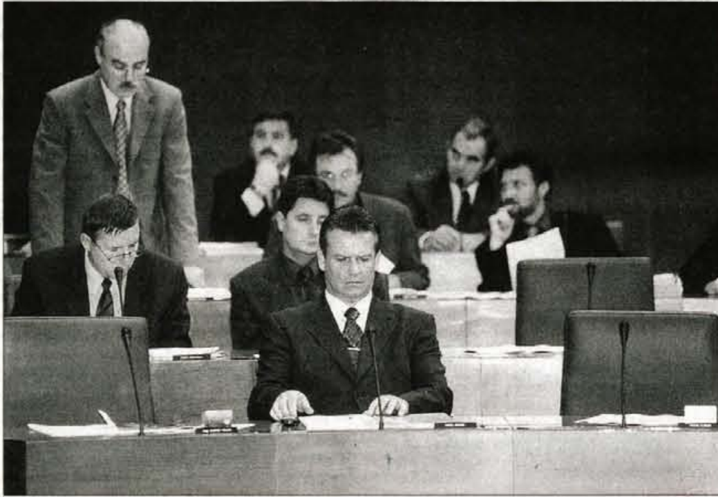
Poslanci Socialdemokratske stranke (na sliki) in Nove Slovenije nasprotujejo izvolitvi mag. Antona Ropa za predsednika vlade.

Ker mora državni zbor čim prej imenovati novo vlado in preprečiti morebitne zastoje, ki bi negativno vplivali na delovanje države,