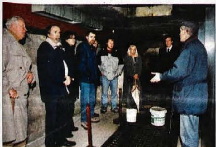
V kostnico teče voda.