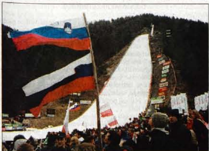
V Planici opozarjajo, da brez uspešnih tekem svetovnega pokala razvoj ni mogoč.