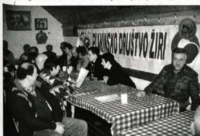
Izrednega občnega zbora Planinskega društva Žiri se je udeležilo le okoli 45 članov, ki so odločali o novem zavetišču.