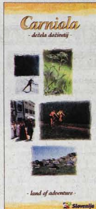
Prva stran mape Carniola z osmimi zgibankami.