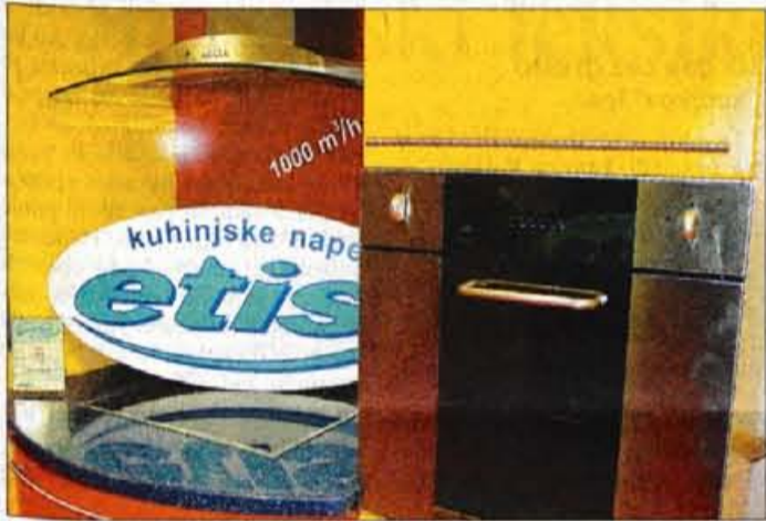
Gospodinjski aparati tudi pod lastno blagovno znamko ETIS.

servisno dejavnost in jo dopolnilo s prodajo gospodinjskih aparatov in rezervnih delov zanje ter s prodajo rezervnih delov za hladilno in klimatsko tehniko.