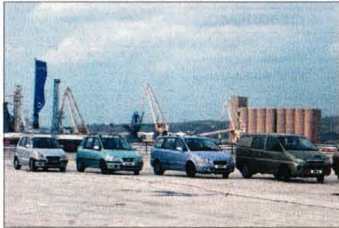
Južnokorejski Hyundai je bil med prvimi, ki je Luko Koper določil za enega svojih glavnih logističnih distribucijskih centrov v Evropi, od prihodnjega leta bodo začela prihajati tudi vozila iz njihove turške tovarne.

metrov, globina morja je 12 metrov, na voljo je 5 privezov ter 4 rampe za iztovarjanje. V zadnjih letih je v avtomobilskem terminalu zrasla tudi garažna hiša, ki sprejme 3300 avtomobilov. Dejavnost Luke Koper pa še zdaleč