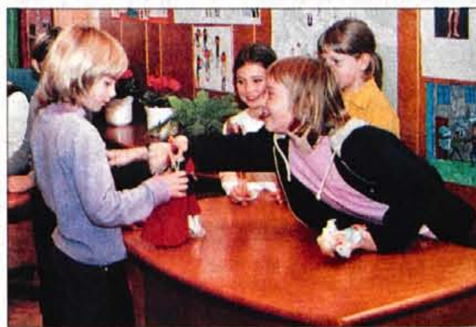
Učenke drugega razreda Osnovne šole Škofja Loka - Mesto so prikazale nasilja med vrstniki z izključitvijo iz igre.