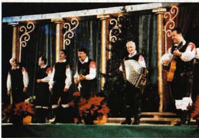
Ansambel Bratov Poljanšek

V Festivalni dvorani na Bledu bo v soboto, 7. decembra, ob 20. uri revija Najlepša viža 2002 - Naj viža 2002 je: Spomin na pevca še živi.