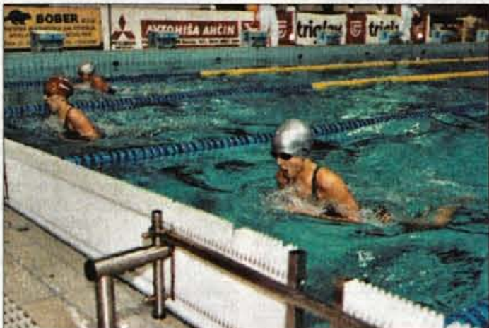
Mladi plavalci so se pomerili v Špelin spomin

Tokrat se je povabilu Kranjčanov na tekmovanje odzvalo kar 472 mladih plavalcev (225 moških in 247 žensk), ki so prišli iz kar devetih držav (BIH, Italija, Madžarska, Češka, Hrvaška, Jugoslavija, Avstrija, Nemčija, vsi slovenski klubi). Tekmovalci so bili razvrščeni v štiri starostne skupine (M1 letnik 1984 in 1985, M2 letnik 1986 in 1987, M3 letnik 1988 in 1989 in M4 letnik 1990 in mlajši, ter v ženski kon-