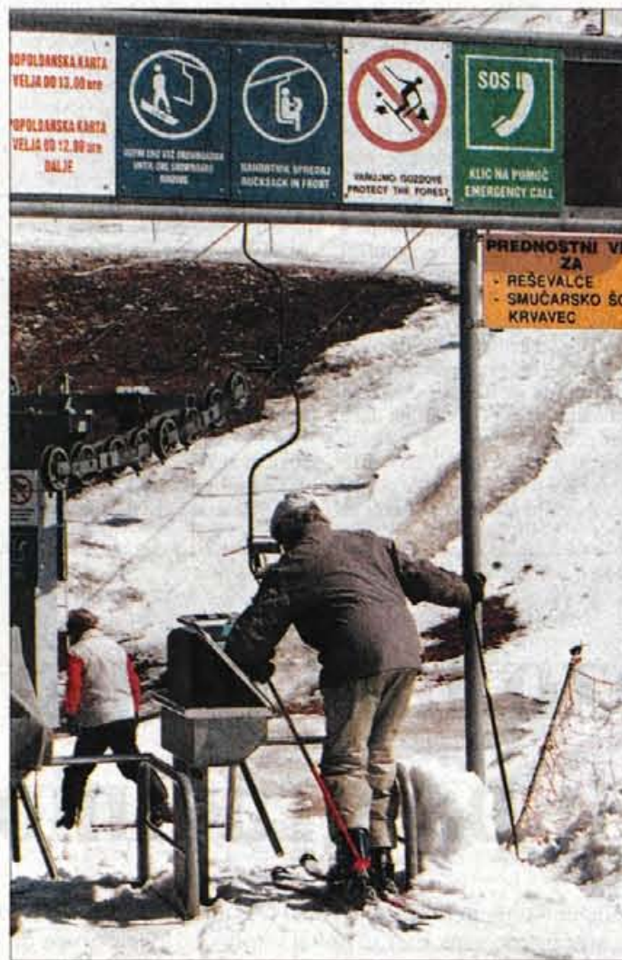
Opozorilni in obvestilni znaki niso postavljeni zaradi lepšega.

Vožnja z motornimi sanmi je lahko dovoljena, lahko prepovedana. Če potekajo smučarske tekaške poti po gozdu, kjer je vožnja z motornimi sanmi prepovedana, je taka vožnja prekršek, saj je zunaj gozdnih cest dovoljena le za reševanje ljudi ali premoženja, kot navaja Zakon o gozdovih.