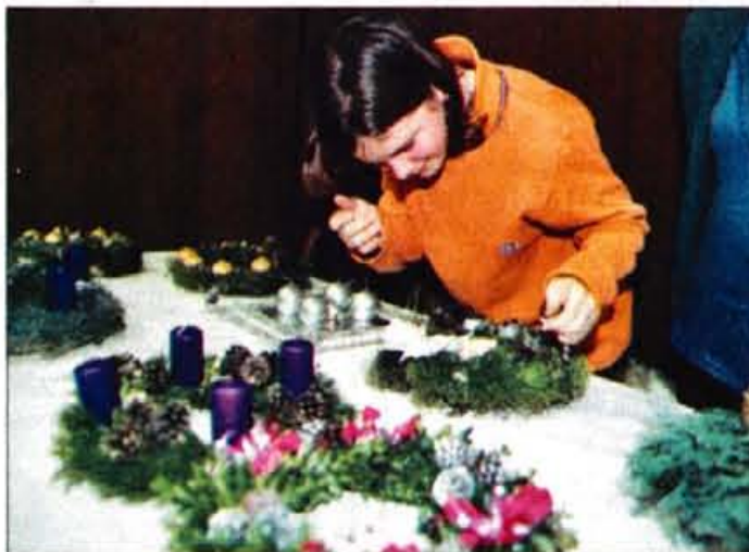
Še zadnji popravki pred koncertom.

radio Gama mm 106.5 fm najboljša športska frekvenca