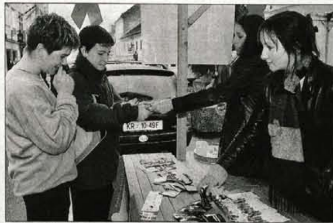
Med mladimi je še vedno malo zadrege...

sporočili, če bi bil okužen, je pa res, da traja dolgo, preden analiza krvi pokaže okuženost, tri do šest mesecev. Čez dva meseca se bom krvodajalske akcije zopet udeležil - navadno se trikrat letno - in mislim, da je to dober pokazatelj. Po mojem mnenju se mladi v Sloveniji premalo zavedajo nevarnosti okužbe s HIV, treba pa je paziti, da ne pride do narkomanov, saj je potem nevarnost, da bi se začel hitro širiti, čeprav dobivamo brezplačne igle. Pa med prostitutke. Zaenkrat ga v tem krogu ni veliko zaznati, tako da je v Sloveniji tako majhna številka. Najboljša zaščita se mi zdi seveda