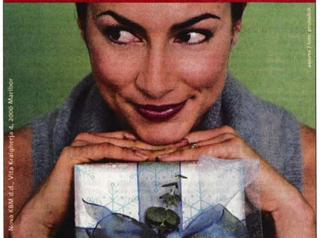
Nova KBM d.d., Vito Kraigherja 4, 2000 Maribor