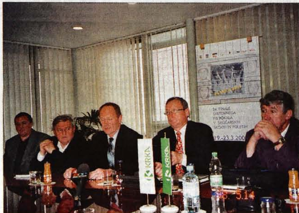
Planiški organizatorji poudarjajo, da Planica še zdaleč ni na tleh, da pa bo treba dosti dela, da ne izgubi slovesa odličnih organizatorjev tekmovanj najvišjega ranga.