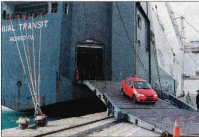
V Koper avtomobili prihajajo z velikaškimi posebej prirejenimi ladjami. Luško osebeje od 4000 do 6000 avtomobilov raztovori v nekaj urah. Mešano podjetje Avto servis skrbi za predservis, dekonzervacijo in montažo dodatne opreme.

O avtomobilski dejavnosti so v Luki Koper razmišljali že v osemdesetih letih prejšnjega stoletja, takrat je v pristanišče prispelo 40