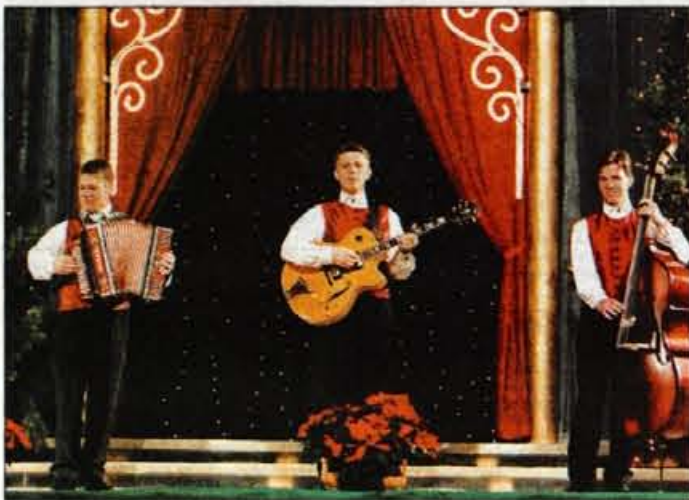
Ansambel Mladi Dolenjci