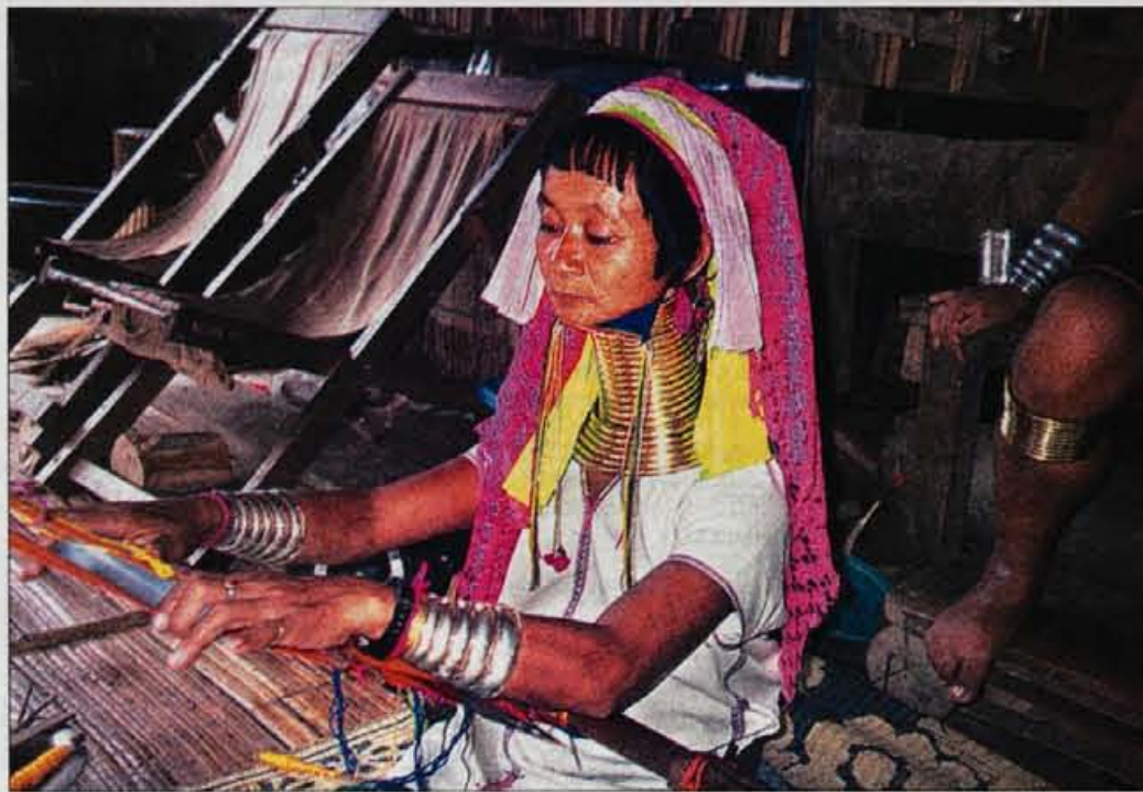
Odrasle ženske nosijo obroče tudi po dva decimetra visoko, ki tehtajo okrog šest kilogramov.

vo podskupina plemena Karen, ki jo imenujejo "long neck" oziroma 'pleme dolgih vratov', ki sami sebi pravi Lae Kur. Gre za eno najbolj nenavadnih tradicij, ko ženske na vratovih nosijo kovinske obroče, nekatere tudi po več kot dva decimetra visoko! Eno takšnih plemen sem imela priložnost videti v gorski vasi na severu Tajske, v bližini Mae Hong Sona. Po razdrapani makadamski cesti, ki jo je na mestih presekala hudournik, smo se z džipom pre-