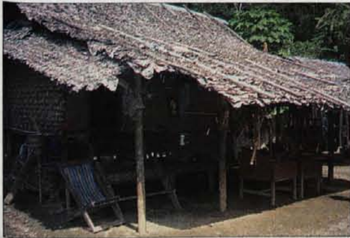
Vas na meji z Burmo, v kateri živi plemo 'long neck'.