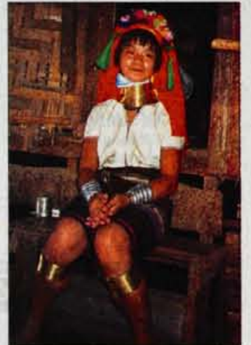
Deklica, ki se je od turistov za silo naučila angleško in povedala nekaj o življenju plemena, še nadaljuje tradicijo nošenja obročev.