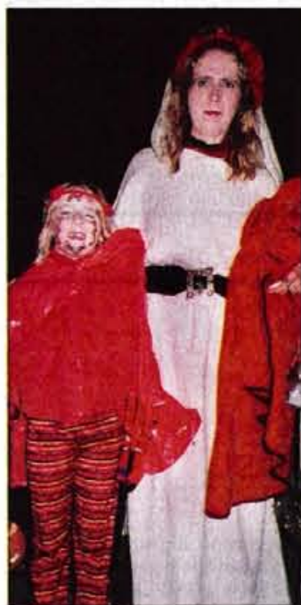
Vila in mala vračička

Otroci in odrasli so bili preoblečeni v čarovnice, rdeče hudičke, smrti, volkodlake, krvose, grozne spake, vile, demone... Med mladimi so še posebej priljubljena svetleča rdeča hudičeva ušesca, ki se enostavno nataknejo na glavo, in rdeče hudičkove vile, pa tudi kakšna lepa vila z belim obročkom na glavi se najde. Zanimivo je bilo tudi v Glastonburyju, osrednjem duhovnem mestu Anglije, ki ima za seboj bogato mitološko tradicijo. Ob številnih krogih prižganih sveč so se ob mističnem vodnjaku legendarnega kralja Arturja zvečer zbrali čarovnice in čarovniki, ter si pripove-