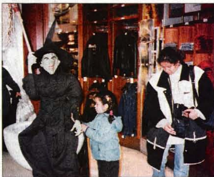
Gajstna čarovnica v trgovini Hard Rock Cafe v Londonu.

Navada je, da otroci hodijo od hiše do hiše in sprašujejo, če imajo ljudje kaj za duhove. Ponavadi jim odrasli dajo bonbone, da se ti posladkajo in pomirijo ter potem dajo živim mir. Praznovanje Noči čarovnic ali Vseh svetih - Hallo-we'en (kar je skrajšano iz All Hallow Even - večer vseh svetih) je že star običaj in izvira iz časa Keltoev, ki se jim je novo leto začelo z novembrom. November, december in januar so bili meseci temnega in hladnega zimskega obdobja, ki so bili za stara poljedelska ljudstva najtrši, zato so jim rekli tudi vetrovni, krvavi, trdi mesec ali celo mesec volkov. Po njihovem verovanju so se na zadnji dan leta zvečer na zemljo vračali demoni in podzemski bogovi, zato so se morali pripraviti na njihov prihod. Zato so Kelti na začetku novembra praznovali velik praznik mrličev, ki ga je krščanstvo kasneje ovilo in preimenovalo v Vse svete, socializem pri nas pa v Dan mrtvih. Vendar pa je