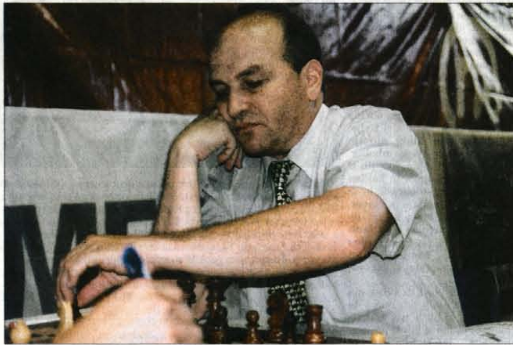
Reprezentance iz 142 držav so že zbrane na Bledu, na prvi šahovnici pa bo za slovensko moško reprezentanco nastopil velemejster Aleksander Beljavski.