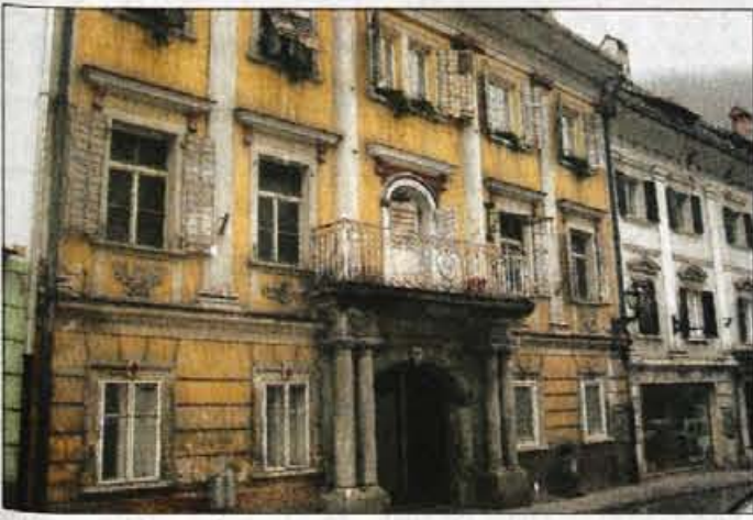
Z javnim razpisom bodo skušali najti kupca tudi za nekdanji hotel Pošta v Trziču, ki že dolgo ne služi več temu namenu.

bodo izbrali med ponudniki na javnem razpisu. Enak bo postopek za prodajo kompleksa bivše Osnovne šole Zali rovt v Trziču. Za 2675 kvadratnih metrov igrišč, 5541 kvadratnih metrov dvorišča in 3408 kvadratnih metrov zemljišča s komunalno opremo ter poslovno stavbo so določili izhodiščno ceno nekaj več kot 215,7 milijona SIT. Občinski svetniki so se predvsem zanimali, za kaj bo namenjena nekdanja šola, pa tudi, ali so že našli interesente za njen nakup. Kot so predlagali, bi morali s prodajo zagotoviti kraju nova delovna mesta. Take možnosti obstajajo, so izvedeli od občinskega vodstva. Država podpira