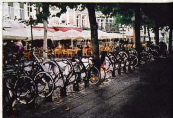
Belgija je tako kot Nizozemska znana po dobro urejenih kolesarskih stezah.

primorskih in štajerskih plesov ter petjem popejalo po njihovi rodni deželi ali deželi njihovih staršev. Z venčkom domačih je nastopil tudi oktet Ceh (v Belgiji je bilo le pet članov), vse prisotne pa je v imenu občine Škofja Loka pozdravil podžupan Borut Bajželj.