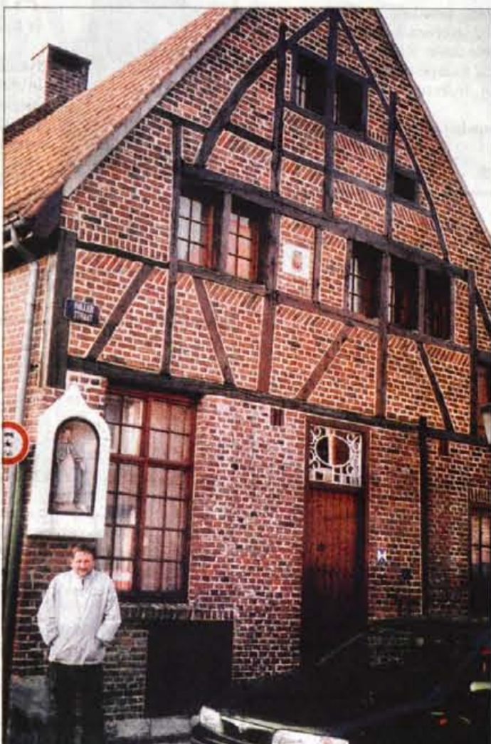
Včasih so bili na hišah še vidni leseni tramovi, danes je to že redkost.

Kulturnikom so se pridružili tudi mladi športniki Škofjeloškega orientacijskega kluba (ŠOK). Ti so uspešno zastopali slovenske barve na Evropskem pokalu v orientacijskem teku v belgijskem Maaseiku. Pokal je potekal od 11. do 13. oktobra in je bil razdeljen na tri panoge: sprint, štafeto in klasično razdaljo, kjer so morala dekleta na zelo težavnem terenu preteči 7 kilometrov, fantje pa 8. Udeležilo se ga je 145 tekmovalcev iz 12 držav. Kot je povedal