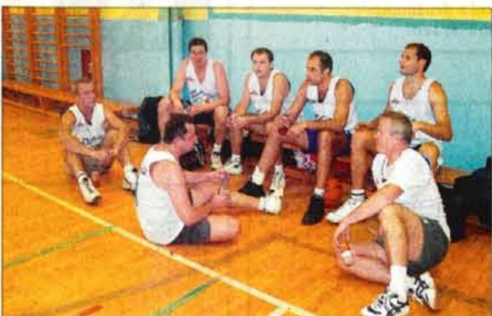
Košarkarska ekipa SEŠŠ je po pričakovanih zmagala.

Velenjčan je vrženo rokavico sprejel in se hitro odločil, da se poda v ta izziv. Tako se je 278 učiteljev in ravnateljev leta 1995 prvič zbralo za dva dni v Kranjski Gori, da so sodelovali na strokovnih posvetih in športnih igrah, ki so srce elektriade. Šolski center Velenje je kasneje organiziralo še naslednji dve elektriadi, nato pa