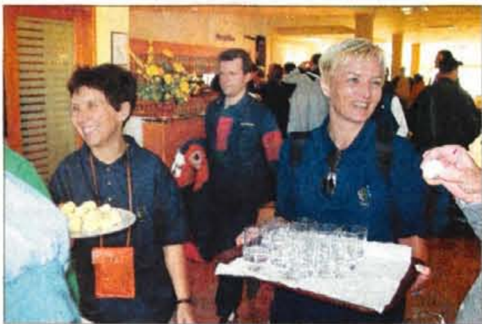
Dobrodošlica ob prihodu ekip v hotel: žganje in pecivo.