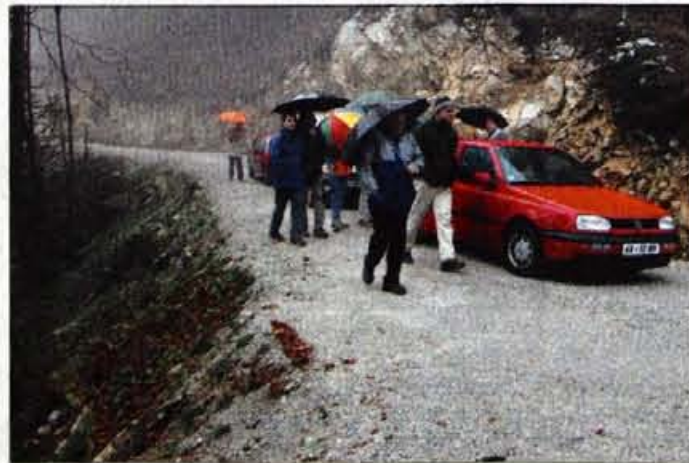
Ob ogledu nove gozdne ceste pod Golico.

Jesenice - Spremembe v gozdarstvu v začetku devetdesetih letih so prinesle veliko dobrega, a tudi kaj slabega. Dobro je, da so javno gozdarsko službo ločili od izvajalskih podjetij, dali lastnikom gozdov več pravic in hkrati tudi več obveznosti, obvezni posek odkazanega drevja zamenjali s prostovoljnimi, sprostili trgovino z lesom - in še bi lahko naštevali. In kaj se danes kaže kot slaba izkušnja? Medtem ko so nekdanji lastniki gozdov od vsakega kubičnega metra prodanega lesa prispevali del za gradnjo gozdnih cest, je z uveljavitvijo gozdarskih sprememb "sistemski" finančni vir usahnil, s tem pa so se začeli tudi križi in težave, ki se kažejo v velikem zastoju pri nadaljnjem odpiranju nedostopnih ali težko dostopnih gozdov. Lani so v vsej Sloveniji zgradili vsega enajst kilometrov novih cest, od tega manj kot tri kilometre v zasebnih gozdovih in osem kilometrov v državnih. Ko so na blejskem gozdnogospodarskem območju v tork predali v uporabo 2,1 kilometra dolgo novozgrajeno gozdno cesto Pusti rovt - Suha (pod Golico) je