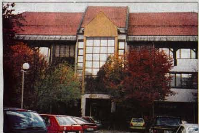
Podjetje Elo prodaja tudi radovljiški ITS Izobraževalni center.