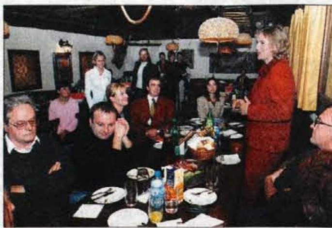
Izbrani ponudniki, ki sodelujejo v projektu na predstavitvi v gostišču Smuk v Retnjah pri Tržiču.