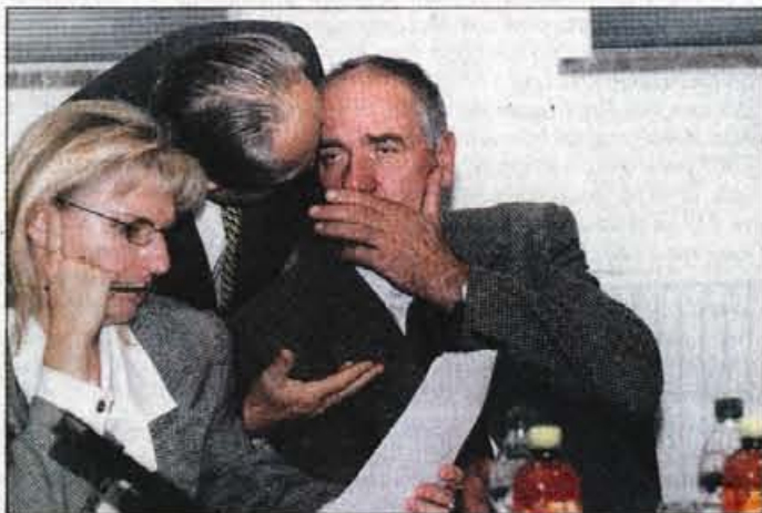
Posvetovanje pred podpisom.

V ponedeljek so župani nekaterih gorenjskih občin vendarle podpisali pogodbo o zagotavljanju finančnih sredstev za ureditev varne hiše v eni od gorenjskih občin. Gorenjska je zadnja egija, ki še nima varne hiše.