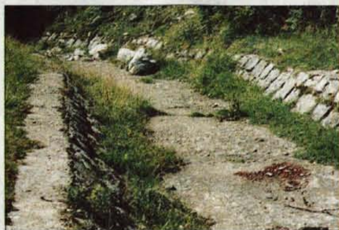
Betonski kanal, ki je rešil graditelje bohinjske železnice.

Pri spustu le nekaj metrov pod sedlom namesto proti planini Za Liscem zavijete desno, na skali kmalu opazite smerokaz za planino Za Črno goro, ter jo čez dobre pol ure tudi dosežete. Planina v še eni krnici zaradi zapuščenosti prav vabi, da se ustavite dalj časa in med pastirskimi kočami najdete kakšno malino. "Kobile", lesene stebre, na katerih stoji pastirski stan, so tu zamenjali s kamnitimi. Uporaba kamena in zidani nadstropni stanovi z ločenimi hlevi v prtiličju je dokaz, da se je na planinah v Spodnjih bohinjskih