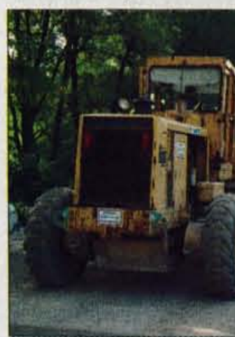
Cesta med naseljem Zvirče in Kovor bo kmalu sodobnejša.

Povrhu vsega so občino tudi leto doletele nekatere naravne katastrofe in druge nesreče, ki so prizadejale veliko gnotno škodo. Kako rešujete odpravo posledic julijskega neurja in problem dvora na cesti v Dolino?