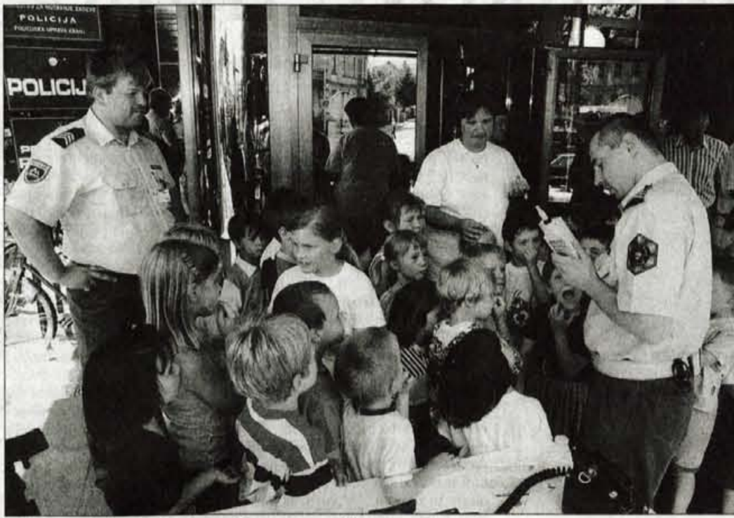
Policisti bodo naslednji teden malčke znova poučili o varnem ravnanju v prometu.

Gorenjski policisti so že pregledali prometno signalizacijo in na pomanjkljivosti opozorili upravljavce. Septembra lani se je v prometnih nesrečah lažje poškodovalo pet otrok.