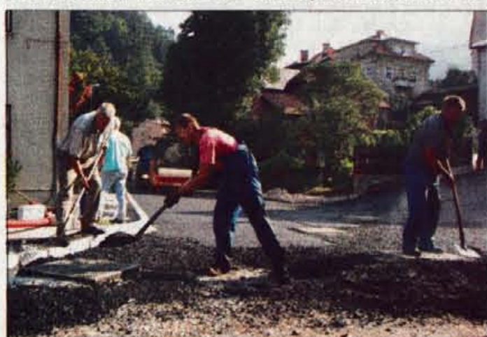
Ta teden so položili asfalt na obnovljeni Cankarjevi cesti v Trziču.

prevoznikom dogovorili za prevoze s kombiji. Cesta je še vedno zaprta za ves tovorni promet - enako tudi cesta v Lomu, žal pa prevozniki lesa tega ne upoštevajo. S policijo imamo dogovor o nadzoru, da ne bi prišlo še do kakšne škode oziroma nesreče, a tudi to ne pomaga dosti. Kolikor vem, so tudi prebivalci Loma zahtevali od prevoznikov lesa odškodnino za poškodbe, sicer bodo promet s tovornjaki tam preprečili. Osebnost mi je všeč, da tudi občani zagovarjajo stališče občine, da mora škodo povrniti tisti, ki jo povzroča."