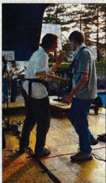
Skupina Hepa je na majski fešti na kranjskem bazenu zmagala v tekmovanju za zlato deko. Pogled od zadaj se bo v ponedeljek razširil tudi na prvo stran.

Med mlade ustvarjalce se tokrat uvršča kopica glasbenih skupin iz Kranja in okolice. Organizator je na festival povabil skupine in posameznike različnih glasbenih usmeritev, večino kranjskih glasbenih skupin in posameznikov, ki bodo nastopili s svojim programom. Med drugim bodo muzicirali: Hippo, Dr. Fig, Orage, Subhash, Backlash, The Strings, Travellin' blues, The Mi, Hepa, Supernova..., pa še kdo. Kot so povedali v KUD Kranj, je namen prireditve opozoriti širšo javnost na potrebe in pravice mladih ljubiteljskih glasbenih ustvarjalcev v širši okolici Kranja. Mladi glasbe-