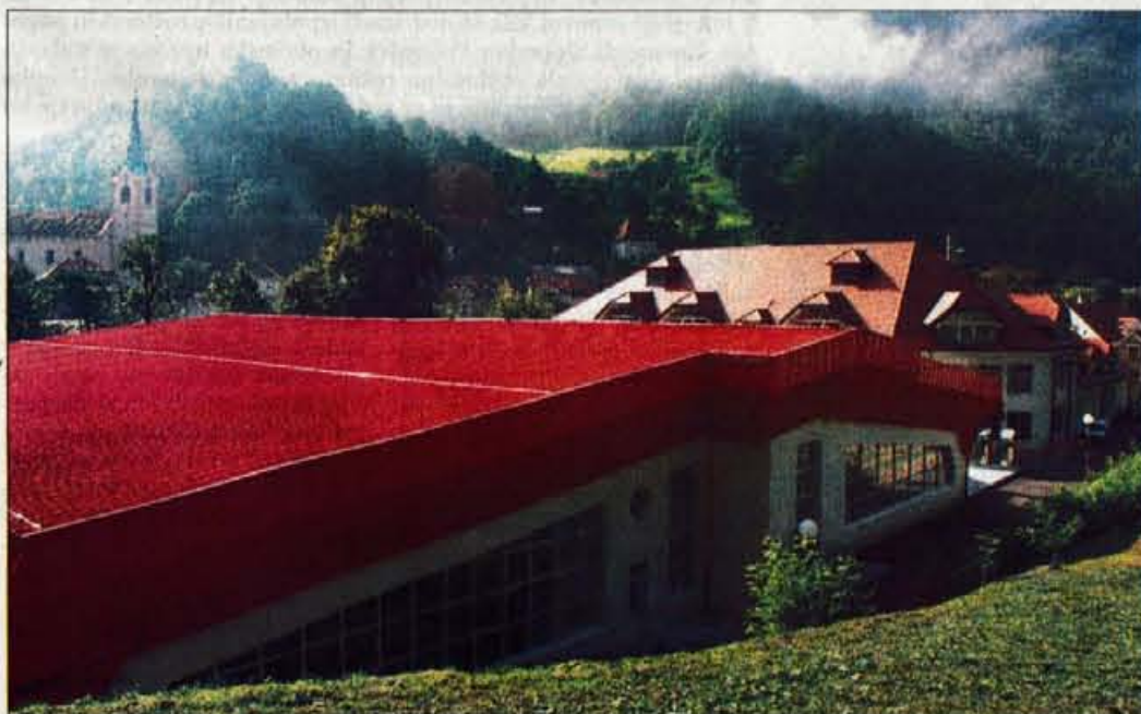
Ob šoli je zrasla tudi večnamenska dvorana, ki jo bodo odprli oktobra letos.

Vzgojno varstveni zavod in šola so dobili novo kuhinjo, ki ustreza vsem zahtevam. Poleg šole in dvorane smo pridobili še nov most in 110 parkirišč ob obeh stavbah, urejamo Šolsko ulico z 22 parkirišči, kot nadaljevanje tega smo obnovili Cankarjevo cesto, sedaj pa poteka še obnova stavbe nekdanjega kina. Domačinom, Gorenjem in vsem Slovencem želimo predstaviti, kako sistemsko urediti neki del starega mestnega jedra."