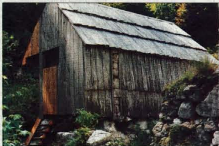
Pastirski stan na planini Za Črno goro.

Na prvi poti po dobri uri pridete v prečno dolino, nekdanjo ledeniško krnico, kjer se je pred tisočletji nabiral led, preden je spolzel v dolino. Na žalost tukajšnja planina Za Liscem svojo prijetno tišino dolguje zapuščenosti. Edina