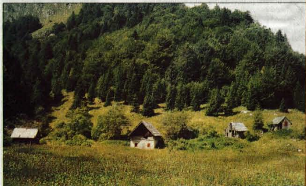
Planina Za Črno goro.