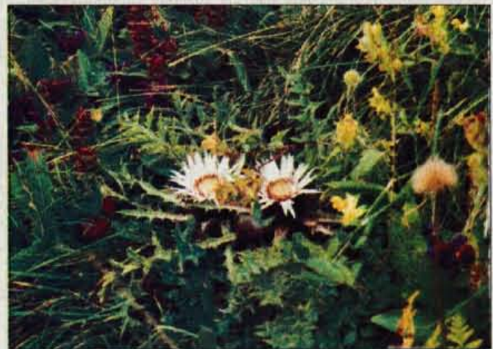
Le majhen delček bogastva rož na Črni prsti.

tako vse do doline. Da ne gre kar za običajno urejanje struge hudournikov, vam potrdi pogovor s katerim od starejših prebivalcev Bohinjske Bistrice ali Ravnan. Na stem rovov, jarkov in žlebov s namreč zgradili v letih 1904-1906, med prebijanjem železniškega predora med Bohinjsko Bistrico in Podbrdom v Baški grapi. Takrat so vdori podzemna voda govorilo se je celo, da je pod gozdom pravo podzemno jezero - povzi-