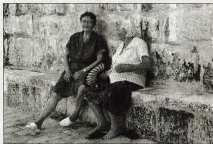
Osteoporoza prizadene vsako tretjo žensko v menopavzi.

Osteoporoza zmanjšuje kostno gostoto kar pomeni, da kost izgublja trdnost in je čedalje bolj krhka, zato se hitreje zlomi, pogostejši so zapleteni zlomi, pojavijo se bolečine v križu, zanjo pa je značilno tudi sesedanje hrbtenice in postopno zmanjševanje telesne višine, manjša gostota kosti pa se lahko kaže tudi po ukrivljenosti hrbtenice in neravni drži.