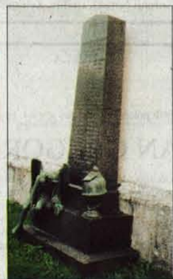
Spomenik ponesrečenim med gradnjo bohinjskega predora.

Tuji trgovec z obutvijo TurboSchuh ima pri nas kar enajst nakupovalnih središč. V Sloveniji ali na Slovaškem, tega še vedno ne ve. V poštne nabiralnike sem dobil reklamo s kuponom za 350 slovaških kron. To bo šele 'frka', ko ga bom poskusil vnovčiti?!