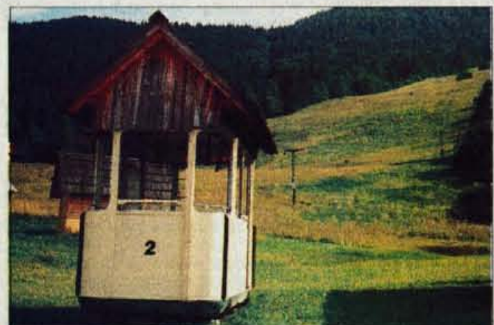
"Planšarska" gondola na smučišču Kobla.