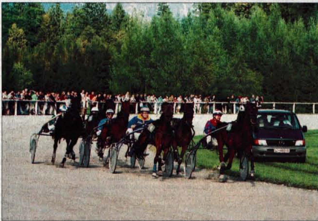
Kasaške dirke na Brdu so že 22 let vedno zanimive in dobro obiskane.