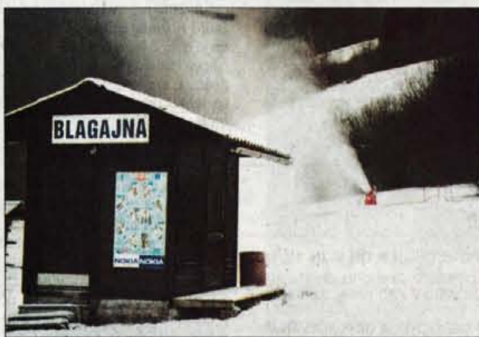
Bo letos blagajna na Koblji ostala zaprta in snežni topovi pospravljani?

In kje naj bi ticali vzroki za tolikšno nasprotovanje dela družbenikov (med družbeniki so sicer lastniki zemljišč in zaposleni) dosedanemu direktorju, ki je podjetje vodil zadnjih šest let? Govorili smo z enim od družbenikov, ki pa je želel ostati neimenovan, ki je povedal, da je vzrokov več, začelo pa se je z načrti za gradnjo nove dvosedežnice na mestu sedanje vlečnice, kar bi sodilo v sklop priprav na olimpiado mladih. Večina lastnikov se je z načrtom strinjala, dva družbenika pa naj bi postavljala nemogoče pogoje. Temperatura se je še dvigala, saj