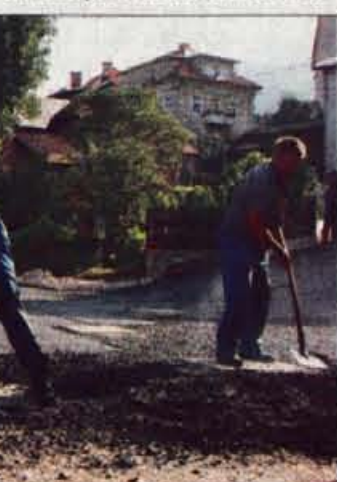
Ta teden so položili asfalt na obnovljeni Cankarjevi cesti v Trziču.

gometno igrišče na ravnini na eni ali drugi strani Trziške Bistrice. Seveda bo še vrsta drugih pomembnih investicij, med drugim prizidek k domu starostnikov v Ročevnici. Prizadevamo si za pridobivanje zazidljivih con, kjer bodo lahko individualne gradnje; blokovna gradnja je predvidena med mestom in Mlako. Načrtov torej ni malo. Najprej bo treba počistiti z računi, ki se prerašajo iz tega leta. Finančno stanje občine želimo namreč približati ničli oziroma bolj pozitivnemu kot pa negativnemu rezultatu."