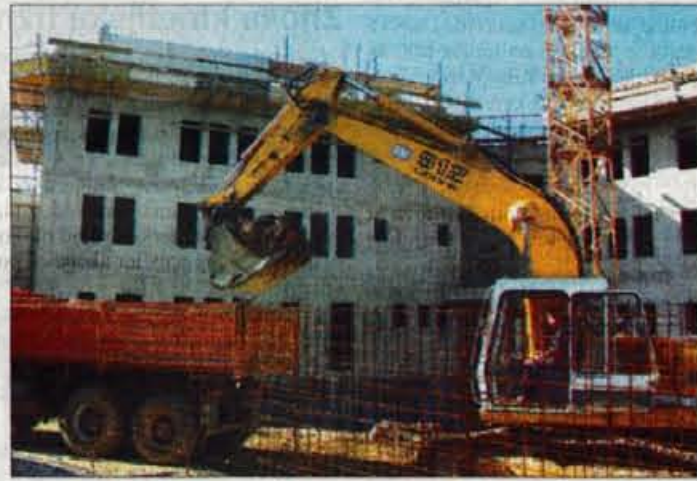
V garažni hiši bo 50 parkirišč in enako število zunanjih še ob stavbi.

Medvode - Lani so v Donit Tesnitu Medvode dokončno ukiniteli azbestno proizvodnjo. Kar 40 odstotkov proizvodnje so nadomestili z brezazbestnimi in dopolnilnimi programi. Ker pa so azbest nadomeščali s kevlerjem, grafitom, celulozo oziroma s steklenimi vlakninami, te surovine pa so se v začetku minulega leta podražile za dvajset odstotkov, so kupci njihovih izdelkov še pred proizvodnjo brezazbestnih izdelkov povečali naročila. Tako je bila proizvodnja v prvem polletju povečana, v drugem polletju lani pa zaradi zasičenosti trga prevelika. Vendar pa se zaradi tega Donit Tesnitu niso odločili za odpustitve delavcev, saj so letos spet pričakovali povečanje proizvodnje. In res so poslovni kazalci za prvo polletje spodbudni, saj se je prodaja količinsko in vrednostno povečala za nekaj odstotkov. A.Ž.