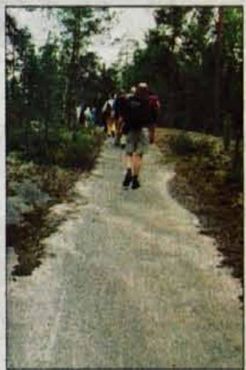
To ni asfalt, to je naravna steza na granitu.

jalna in glede na finske astronomske cene alkoholnih pijač, zlasti žganih in vina, se obisk v njej vesakakor splača. Že v Talinu sem gledal finske potnike, kako so na trajektu tovorili cele pakete estonskega in finskega piva v pločevinakah, v ladijskem "djutfirju" pa tega začuda niso prodajali. A glej ga šmenta. Deset minut pred izkrcanjem so odprli vrata nekega stranskega prostora v velikem potniškem salonu in za njimi se je prikazala cela gora pivskih kartonov. Ljudje so se postavili v vrsto, v rokah so imeli potrdila, da so pivsko radost na blagajni že plačali ter prevzemali po dva paketa na osebo, večina je zraven kupila še poceni zlojljivi voziček. In potem se je zgodilo, da je vrsta izstopajočih iz velike ladje spominjala na pivsko karavano. Skoraj ga ni bilo, ki ne bi vlekel ali nosil svoje zaloge piva. Priznam, da sem bil med nosilci tega težkega, a sladkega tovara tudi podpisani.