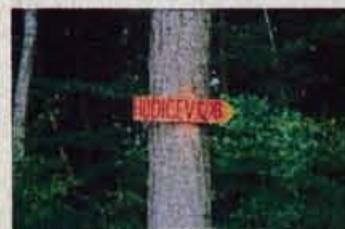
... in hudičevo.

skega, 1303 metrov visoko Zakojco. Najboljše kar iz Jesenice, čeprav vas čakata dve uri precej strmega, pa dobro označenega vzpona. Občasno se odpre razgled, in kar se same pojavijo besede: graparji..., bajtarji..., rovtve..., samotarji..., odmaknjenost... in spet samota in samota. Na žalost ljudi vse bolj izriva gozd, in izgineva raznolikost pokrajine, za katero so se trudile generacije.