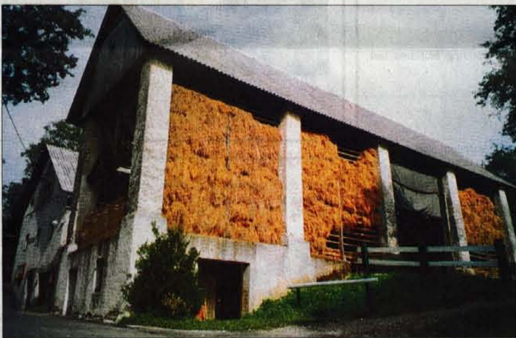
Tradicionalen cerkljanski senik.

Mimogrede, če po dobrih dveh urah slučajno "zamudite" odep proti Zakojci, boste prišli do Bu-