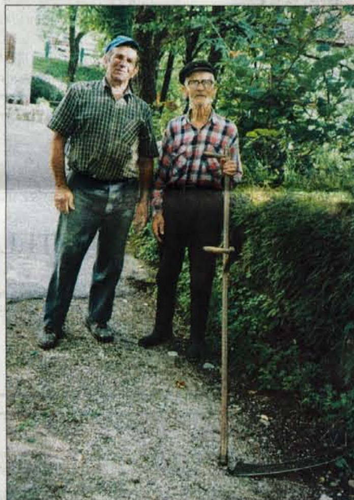
Vrta "fanta" iz Zakojce.