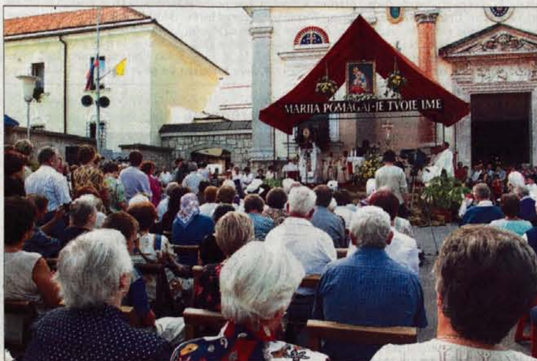
Včeraj se je zbralo na Brezjah nekaj tisoč vernikov.

Slovenski škofje so za praznik Marijinega vnebovzvetja maševali na Brezjah, v Olimju, na Ptujski gori, v Gradu, na Sveti Gori in v Strunjanu.