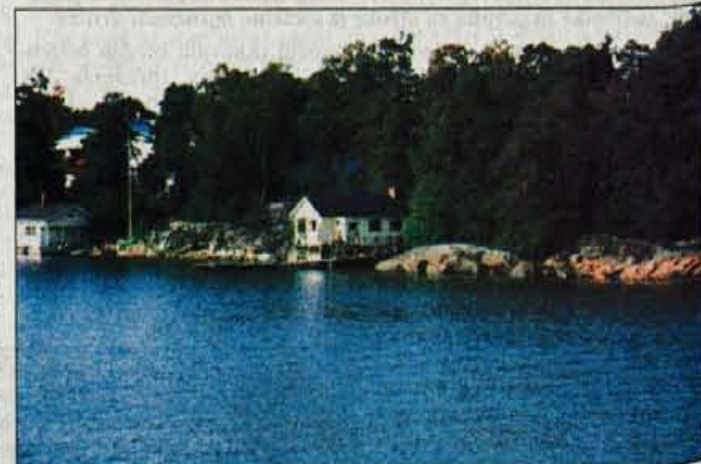
Finska idla - hišica ob jezercu.