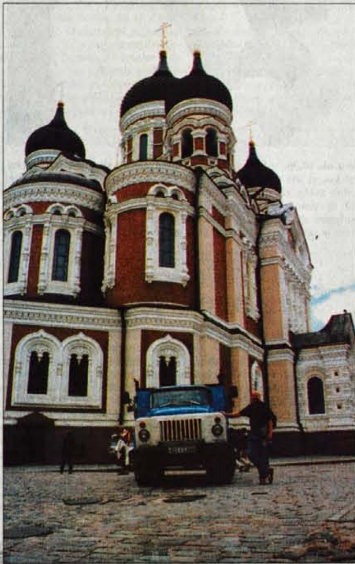
Ruska cerkev in kamion v estonskem Talinu.