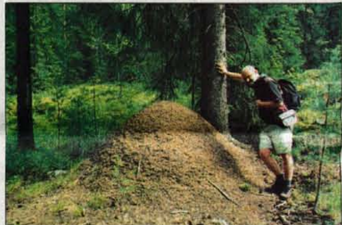
Tako velikega mravljišča pri nas še nisem videl.

Enajsti dan je bil predzadnji in zato nadvse garaški. V uradu, kje kreirajo helsinški turizem, so se namenili turistu zaposliti na poseben način. V prospektu ti narišejo in opišejo šest različnih pohodniških ogledov, dolgih od 3 do 7 kilometrov. Smer je označena na zemljevidu, ob njej so vrisane številke postankov in v besedilu kratke razlage znamenitosti, ki jih označujejo. Najina šestkilometerska in skoraj šesturna pot se je začela pri znameniti, v živem granitu zgrajeni cerkvi Tempeliaukio (1969), vodila mimo mestnih po-