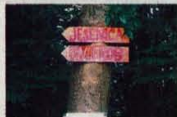
Na Kojci je vse divje...