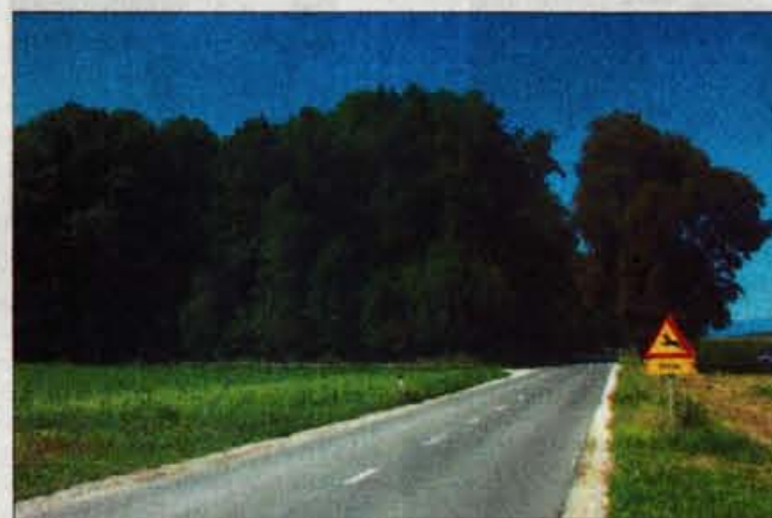
Med Žejami, v občini Komenda, in Vodiciami, kjer je manj kakovostni gozd, naj bi nastala ena od treh osrednjih poslovno obrtnih con v Sloveniji.

Komenda - Julija meseca pred dvema letoma so v občini Komenda v okviru dolgoročnega prostorskega plana prvič obravnavali za občino nadvse pomemben dokument. Komenda je že sicer poznana po podjetništvu in obrtništvu, od nekdanjega po tradicionalnem lončarstvu, v novi mladi občini pa so interesi za različne dejavnosti vsak dan večji. Zato so v občinskem svetu, ko so pred dvema letoma v tako imenovanem prvem branju obravnavali opredelitev poslovno obrtne cone v bližini Žej ob cesti proti Vodiciam, za zanimanjem in zadovoljstvom pozdravili zamisel, da bi na tem delu bila v prihodnje ena od treh osrednjih poslovno obrtnih con v Sloveniji. Na občino Komenda bi v njej odpadlo okrog 18 tisoč kvadratnih metrov.