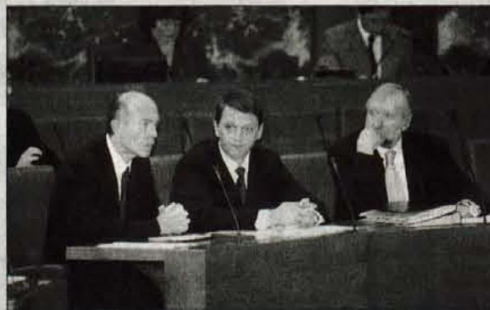
Dr. Janez Drnovšek, mag. Anton Rop in dr. Dimitrij Rupel se bodo morali odločiti, ali podpisati sporazum z ZDA ali čakati, kaj bo storila Evropa.