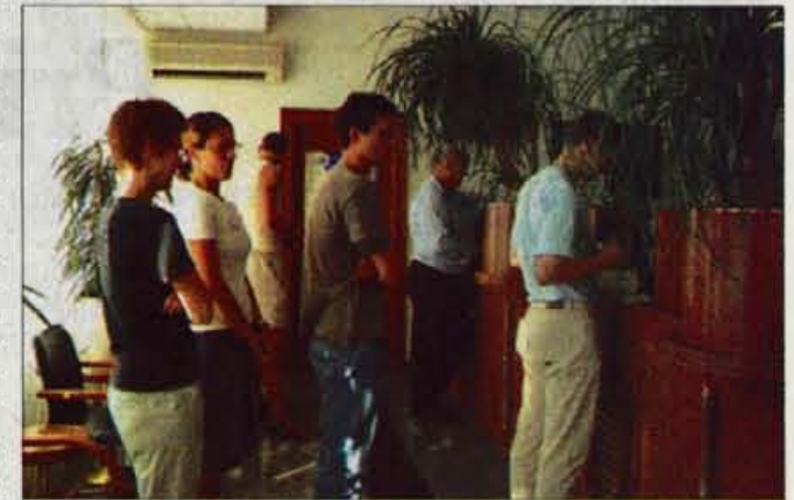
Bodo v prihodnosti študenti prišli do kredita s kreditnimi točkami.

Večina članic imajo programe sicer že ovrednotene po ECTS sistemu, ki pa se razen v redkih primerih v praksi ne uporablja niti ne zagotavlja izbirnosti in interdisciplinarnosti. Korak naprej so naredile Medicinska fakulteta, Fakulteta za strojništvo, Fakulteta za arhitekturo, Ekonomska fakulteta in Fakulteta za računalništvo in matematiko. Na pravni fakulteti za ta sistem ni pravega zanimanja, po-