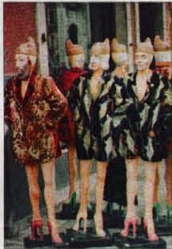
Trgovina s travestitskimi oblačili.

Nestrpnost v slovenski družbi je trdno usidrana oblika o drugih in drugačnih. O tem se vedno znova lahko prepričamo. Ob tem naj omenimo zadnji odmeven primer zavračanja drugačnosti v primeru izbora za nastop na Evrovizijski popevki, skupino Sestre, nad katerim smo slišali kritiko in opozorilo tudi s strani Evropske unije. Druga velika skupina, ki na svoji koži že dalj časa čuti brezbriznost in nestrpnost s strani države so begunci iz bivših jugoslovanskih republik. Nedavno so na shodu nase opozarjali tudi homoseksualci, odklanjanje pa čutijo tudi narkomani, bolniki z aidsom, pribežniki, azilanti in še bi lahko naštevali. V udarnih zloženkah, s katerimi so na srednjih šolah in univerzi opozarjali na pereč problem so zapisali primer človeškega vedenja in razmišljanja: "Vsi mi gredo na jetra: čefurji, pedri, snobi, džankiji, panksi, metalci, kriplji, žabarji, šminkerji, lezbe, rejverji, skejterji, debeluh, blondinci, klošarji, vo-