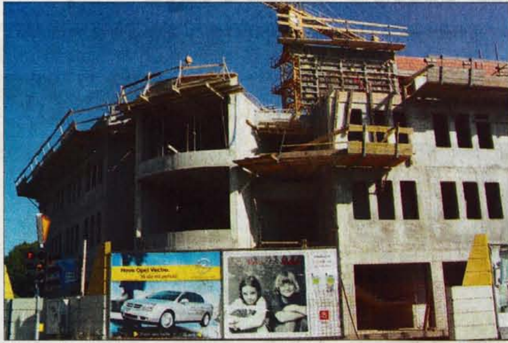
Poslovna stavba bo pod streho v začetku septembra, končana pa bo februarja 2003.

V novi stavbi, opremljena bo z dvigalom, bo tudi večnamenska dvorana s stotimi sedeži, za njeno avdio in računalniško opremo pa bo poskrbelo podjetje Gradbinec GIP, ki je podpisalo donatorsko pogodbo za 5,2 milijona tolarjev. V poslovni stavbi, z garažami bo merila 3900 kvadratnih metrov, bo tudi garažna hiša za 50 vozil, prav toliko zunanjih parkirišč pa bodo uredili ob stavbi. Projektna dokumentacija je stala 15 milijon tolarjev, komunalna oprema zemljišča 18 milijon tolarjev, sprememba fasade pa bo gradnja, ki naj bi stala 850 milijon tolarjev, nekoliko podražila. "Gradnja poteka po načrtih, objekt bo v za-