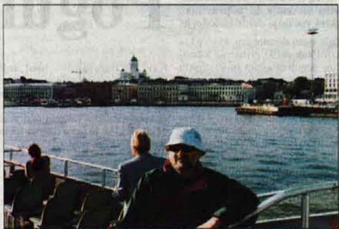
V helsinškem pristanišču, nad njim katedrala sv. Nikolaja.