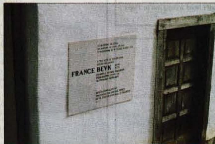
Od tu je izšel velik primorski "sin".

kovega, odkoder je treba štiri kilometre nazaj po asfaltni cesti. Brez skrbi, pot ne bo zaman; pogled si boste na široko odstrli v še en lep, a zamirajoč konec Slovenije, Baško grapo. Saj se še spomnite, kako je Bert Sotlar v filmu Na naši zemlji ob pogledu nanjo zadovoljno pripomnil: „Lej jo, našo grapo, Baško grapo.“