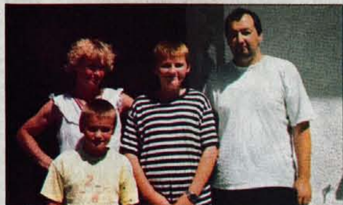
Družina Buh, po domače Pri Slajkarju, se veseli zanesljive oskrbe s pitno vodo.

Stara Oselica - Čeprav so bila sredstva s strani programa SAPARD potrjena že pred meseci, pa z deli ni bilo moč začeti pred pozitivnim mnenjem Ministrstva za finance, ki delno tudi sofinancira tovrstne projekte. Pred dobrim tednom se je vendarle začela precej zahtevna izgradnja vodovoda v Stari Oselici, na katerega bo priključenih 15 uporabnikov, ki so do sedaj uporabljali le kapnico.