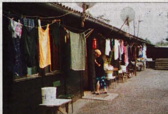
Begunci na robu Ljubljane.