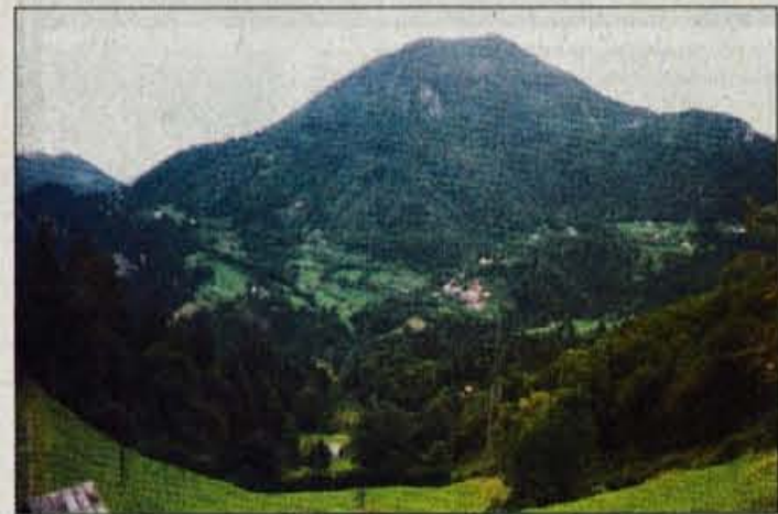
Jesenica z Kojco.