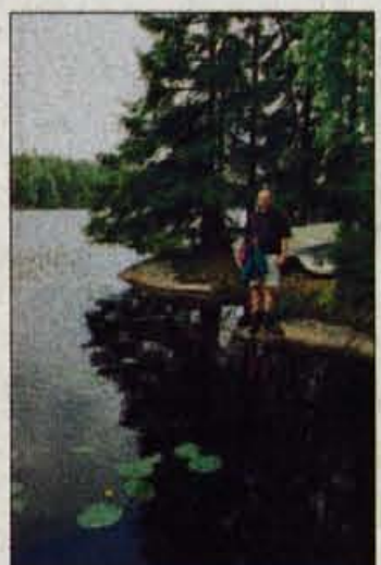
Ob jezercu v nacionalnem parku Nuukio.

vojno zgrajene helsinške železniške postaje. Njegov sin Eero (1910-61) si je pridobil svetovno slavo z deli, ki so jih po njegovih načrtih postavili v Ameriki. "Tretji" (po našem vrstnem redu, sicer pa verjetno prvi nad vsemi) naj bo Aalvar Alto (1898-1976), eden svetovnih prvakov v arhitekturi 20. stoletja. Ko sem se vsak dan vozil mimo palače Finlandia Hall, me je vedno znova spominjala na ljubljanski Cankarjev dom. A da bi Aalto "kopiral" Ravnikarja, je malo verjetno, saj je bila Finlandia zgrajena v letih 1967-71, torej pred CD.