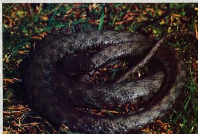
Kobranka živi ob rekah, potokih in ribnikih po vsej Sloveniji.

Cesto med Tržičem in Dolino ter Jelendolom je cestarjem uspelo zasilno usposobiti za promet. Nevaren plaz, ki je sredi klanca odnesel precejšen del ceste, se je ustavil. Nevaren prepad so zavarovali z zaščitno ograjo. Poškodovana cesta ovira normalen promet na sicer zelo prometni cesti do Jelendola in planin pod Velikim vrhom in Kladvom. J.K.