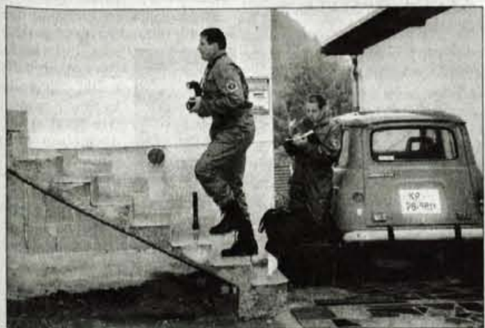
Kriminalistična komisija domneva, da se je Domen kasneje prebudil, a ni bil več sposoben pogasiti požara.

Na Cesti talcev v Škofji Loki pa so minuli petek imeli povsem drugačne težave. Prostovoljni gasilci iz Stare Loke so namreč morali v večernih urah odstraniti sršenje gnezdo, veliko 50 x 50 cm. S. Š.