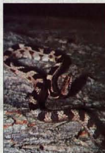
Mačjeoka je polstrupena kača, ki pa človeku ni nevarna.

razmeroma kratko in čokato telo od 50 do 70 cm, nikoli niso večje od 1 metra, zelo kratek rep, značilen cikcakast vzorec na hrbtu, pri modrasu rožiček na vrhu gobca in rdeč spodnji del repa. Tako strupene kot nestrupene kače so lahko popolnoma črne,