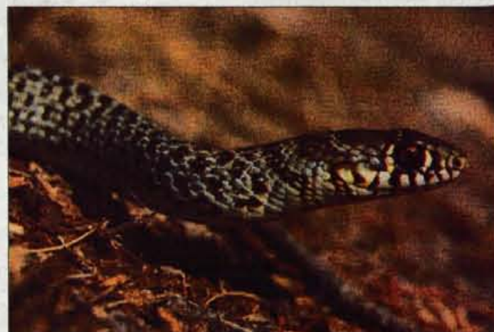
Belica je v Sloveniji zelo redka.

nekatero nestrupeno kačo pa imajo temen vzorec, ki ga ljudje pogosto zamenjajo za značilni "cikcak" strupenjač. Barva in hrbtni vzorec sta lahko pri naših strupenjačah zelo raznolika.