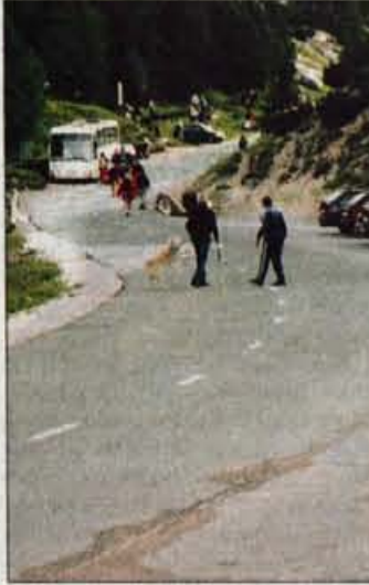
Do konca avgusta bodo obnavljali tudi cesto na Vršič.

Kranj - Direkcija Republike Slovenije za ceste, ki skrbi za 6000 kilometrov državnih cest, bo v drugi polovici avgusta in septembra nadaljevala z gradbenimi in vzdrževalnimi deli. Na državnih cestah bo okrog 50 gradbišč, ki bodo bolj ali manj ovirala promet. Večje gradbišče bo v Medvodah , kjer bodo septembra začeli graditi križišče Na klancu. Gradnja bo potekala eno leto, zato bo ovirana prometna povezava med Kranjem in Ljubljano po stari cesti. Promet bo potekal dvosmerno ob gradbišču, v konicah pa bodo voznike usmerjali na avtoceste. Zaradi gradnje novega podpornega zidu bo za ves promet zaprta regionalna cesta Bitnje - Jereka skozi Korita . Promet bo predvidoma zaprt do 20. oktobra. Obvoz bo urejen. Grad-