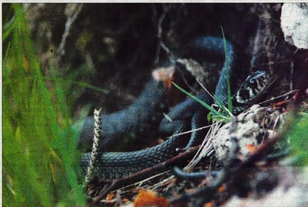
Gož izpod Jošta

Nekaterim ljube, drugim vzbujajoče strah, stud in odpor. V Sloveniji živi enajst vrst kač in le tri so resnično strupene: navadni gad, laški gad in modras, polstrupena je mačjeoka, ostale pa niso nevarne, a se jih vseeno bojimo. A na svetu je vselej dovolj prostora za vse. Ognimo se jim in pojdimo svojo pot.