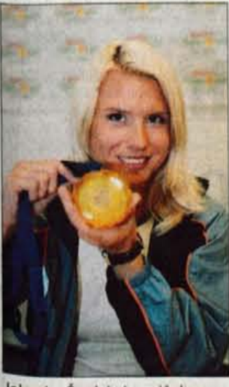
Jolanda Čeplak je pričakovano osvojila zlato kolajno.

Kranj - Minulo nedeljo se je v Münchnu končalo evropsko prvenstvo v atletiki. Zadnji tekmovalni dan na prizorišču ni nastopil noben slovenski atlet, saj je tudi naše zadnje upanje za visoko uvrstitev, moška štafeta v teku 4 x