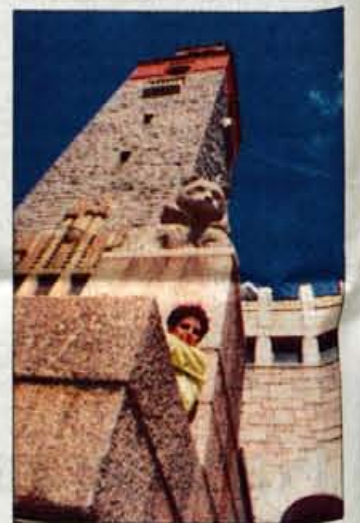
Narodni muzej, ki po arhitekturi spominja na grad in cerkev.

ga umetnika in njegove velike družine (z ženo Aino sta imela več hčera in zaposlovala strežno osebje). V Helsinkih so mu 1967 postavili imenitni spomenik, kovinsko skulpturo, ki spominja na orgle. Še večji spomenik si je postavil s svojo glasbo in postal eden od finskih simbolov. Par kilometrov stran smo si ogledali leseno hišo na granitni skali, ki jo je po lastni zamisli zgradil slikar Pekka Halonen. Tudi on je imel veliko družino, ženo in osem otrok. Kadar so pri njih zakurili v savni, so prižgali močno luč v ateljeju, ki se je skozi veliko okno videla daleč naokoli. Tako so dali prijateljem, med njimi Sibeliusu, vedeti, da gredo v savno in da jih vabijo, naj se jim pridružijo. V savno smo šli tisti večer tudi mi, jaz prvič v življenju. To je res posebna reč. Finci svojo simboliko, torej tisto, kar je po njihovem najbolj finsko, strnejo pod šifro 3S: