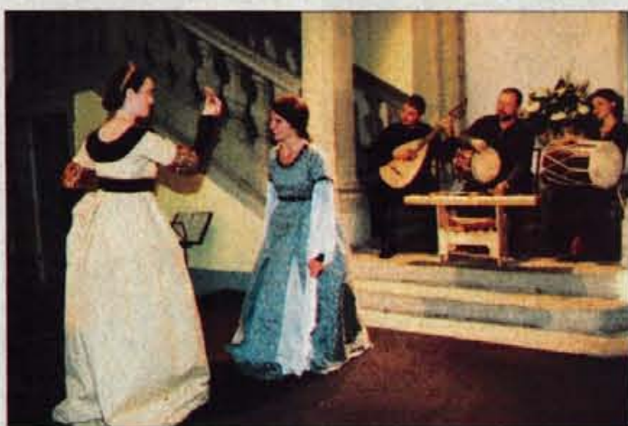
Zelo zanimiva srednjeveška glasba in plesi: glasbena skupina Camerata Antiqua in plesna skupina Umetniške gimnazije Ljubljana.

"Mislim, da je bil nocojšnji koncert res prijetno doživeti za vse, ki ste prišli in koncertni