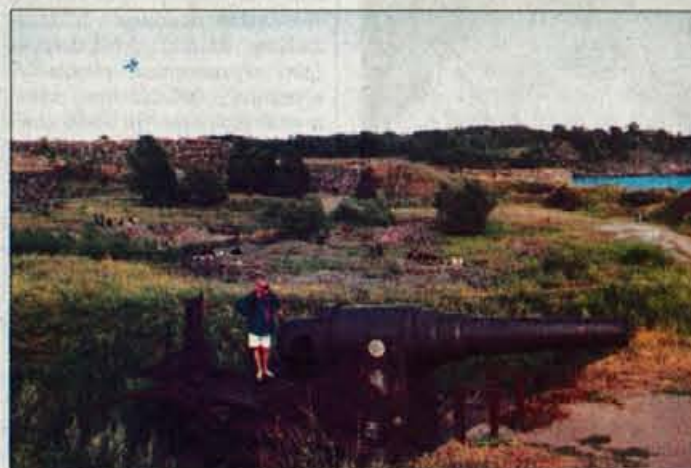
Ruski kanon na otoku-utrdbi Suomenlinna.

angleščino in francoščino. Kadar smo bili ob najinem obisku za omizjem vsi, smo govorili angleško, če gospodinja ni bilo, smo hitro preklpili na slovenščino.