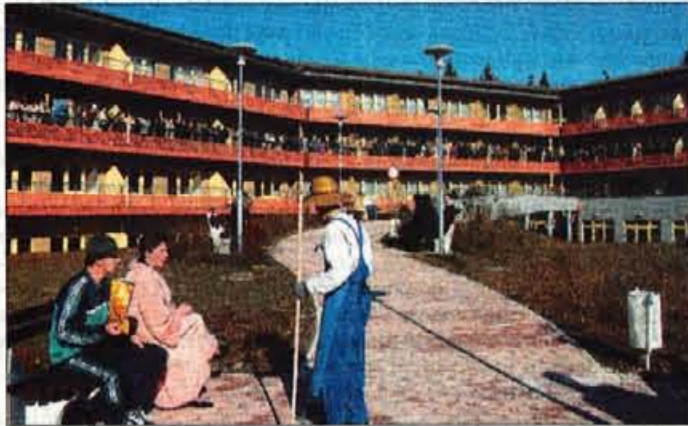
Ena največjih pridobitev je bil Dom starejših občanov.

kako ocenjuje dogajanje zadnje leto, med lanskim in letošnjim praznovanjem, je povedal. "Najprej naj poudarim, da bomo naslednje leto tudi v naši občini podeljevali priznanja najbolj zaslužnim občanom. Komisijo imamo in prepričan sem, da bomo poslej tudi s priznanji obeleževali dosežke v občini. Sicer pa smo na področju predšolske vzgoje lani odprli vrtec na Svetju in omogočili vpis novih otrok. V Smledniku smo pred vrtcem zgradili parkirišče in s tem poskrbeli za večjo varnost najmlajših. Obnovljena so bila tudi otroška igrišča v Smledniku in Medvodah. Kar zadeva šolstvo, sicer nismo gradili novih prizidkov, smo pa naročili projekte za devetletko in projekte za novo telovadnico pri šoli na Svetju. V Sori smo zgradili tudi prvi večstanovanjski objekt, v katerem bo občina lastnik petih socialnih stanovanj. Eden najpomembnejših dosežkov in uspehov hkrati pa je bilo nedvomno odprtje doma