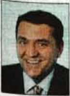
Stanislav Žagar, župan