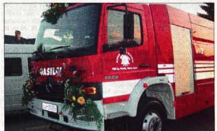
Gasilci Spodnjih Pirnič imajo sodoben gasilski avto, s katerim bodo lahko ob suši pomagali s preskrbo vode.

ta velika pridobitev ob domu starejših občanov naselje Zbiljski gaj in zastavljena gradnja stanovanjskega naselja in golf igrišča Brezovec. Tudi oporni zid na smledniške pokopališču je dokončno zgrajen, kar ni nepomembno."