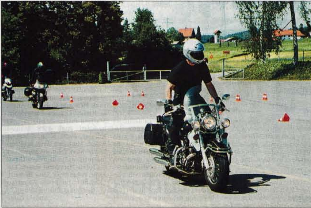
Med treningom varne vožnje na poligonu v Tacnu.

Treningi so razdeljeni v tri stopnje, vsaka je nadgradnja druge. Na prvem treningu udeležence in-