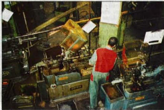
V BVG letno izdelajo 40 milijonov kosov izdelkov.