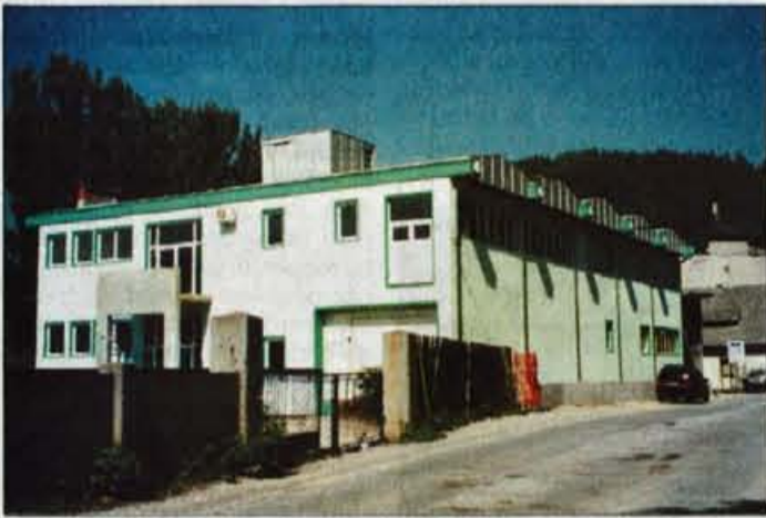
Podjetje BVG se bo do konca prihodnjega meseca preselilo v nove prostore ob Savski cesti.

Kranj - Konec osemdesetih let so svoje prihranke združili štirje študentje. Kupili so orodje in v garaži uredili delavnico. Začetnice imen so jim služile za ime podjetja, ki je čez dobro desetletje preraslo v uspešno mednarodno podjetje. Zasebno podjetje BVG je dobro znano v tujini, saj večino proizvodov izvozijo. Zadnje leto jih zaposluje tudi gradnja novega poslovno-proizvodnega objekta, v katerega se bodo preselili prihodnji mesec.