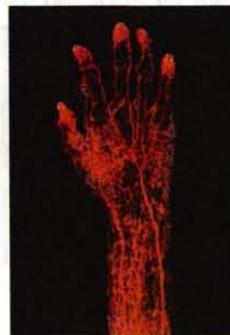
Čudežno drevo? Ne, konfiguracija žilnega sistema v roki.

Razstava omogoča unikaten vpogled v notranjost zdravega in bolnega človeškega telesa. Precej