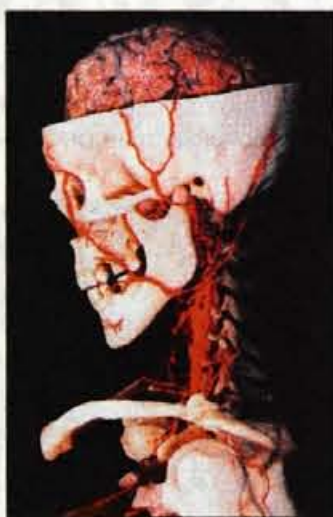
Glavna veja arterijskega sistema, ki vodi v glavo in vrat.

da so razstavo postavili v dokaj neugledno okolje. Galerija Atlantis je preurejeno poslopje nekdanje pivovarne (še vedno tudi nosi ime Old Truman Brewery) v vzhodnem delu Londona, ki velja za revnejši predel tega sedemmilijonskega mesta, v teh četrteh živijo pretežno azijski priseljenci. Vendar smo pozneje slišali, da tudi v drugih evropskih mestih razstav ne gostuje v najuglednej-