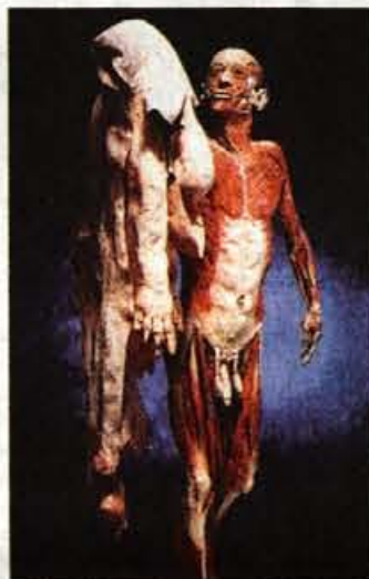
Mož, ki je slekel kožo.

no imenujejo anatomsko gledališče. Tako vidimo človeški skelet, s koščeno roko na rami "mišičnjaka" in iz priložene razlage razberemo, da gre za truplo istega človeka, da so posebej pripravili okostje in posebej mišičje, nato pa, sestavili dvoje ločenih skulptur in ju postavili tako, da okostnjak treplja mišičnjaka po rami. Med primerki najdemo tudi "ortopedsko telo", ki so ga že v procesu plastinacije podvrgli različnim operacijam in mu vstavili proteze in kovinske opore kostem, ne manjka niti srčni spodbujevalec. Šokira tudi človek, ki je slekel svojo kožo in jo kot plašč nosi na rokah, pa ženski in moški torzo, žensko telo v več fazah nosečnosti, strukture, ki delujejo kot tanko razvejana drevesa, gre pa za konfiguracijo krvnih žil posameznih delov telesa in organov ali pa kar vsega telesa. Mešane občutke