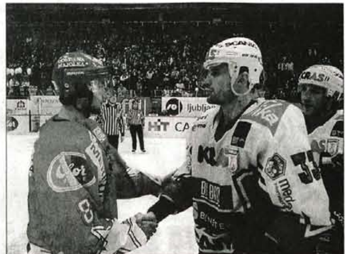
Hokejisti v rdečih jeseniških dresih so tudi letos morali seči v roke državnim prvakom v zelenih dresih, hokejistom Olimpije.

Triglavane, ki so osvojili končno drugo mesto, pa je ob porazu v finalu najbolj skrbela usoda domačega kluba, ki še ne ve, kakšna