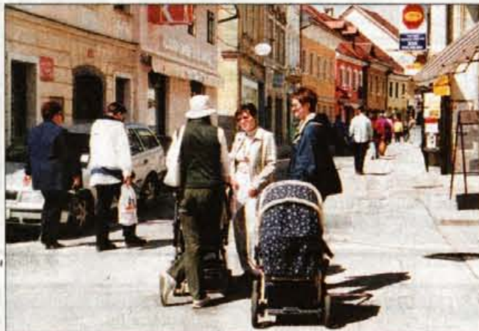
Lep dan privabi v stari del Kranja več sprehajalcev kot kupcev.

Prebivalec glavnega gorenjskega mesta tišina in mir zelo ustrezata. Industrije ni, trgovine se praznijo, gostinski lokali životarijo. Center mesta je zaprt za promet, razen za kolesarje in nadležne motoriste. Ljudje še nekako pripočajo do veleblagovnice Globus, pa včasih morda tja do pošte. Studentje in dijaki zaidejo celo v študijsko knjižnico na koncu mesta, učenci v Glasbeno šolo, vendar so to stavbe, ki se pač morajo obiskati.