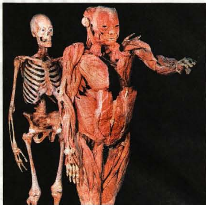
Mišičnjak in njegov okostnjak, dve postavi istega trupla.

sistematično nas vodi od enega sklopa do drugega, začeni s lokomotornim sistemom. Okostje z več kot 200 kostmi in sklepi omogoča telesu stabilnost, podporo in mobilnost, na razstavi pa ga vidimo ne le kot celoto, temveč razstavljenega tudi na posamezne dele, da o mnogih frontalnih, horizontalnih in vertikalnih razrezih niti ne govorimo. Prikazan je živčni sistem, to telesno električno omrežje, ki se razteza od glave do pete, s kontrolnim sistemom v možganih, ki nadzira in regulira telesne funkcije. Tudi možgane nam razstava prikaže do najmanjših podrobnosti. Ta mala gmota človeškega telesa porabi presenetljivo veliko energije, kar tretjino vse, potrebne za človeško telo. Miselni procesi, ki nas ločijo od drugih živih bitij, pa potekajo le v možganski skorji. In že se preselimo k dihalom. Pljuča, ta osrednji dihalni organ, sestavljen iz mehurčkov, bi v raztegnjeni obliki pokril kar sto kvadratnih metrov veliko površino. Pljuča vidimo v številnih oblikah, od povsem zdravih, do takih, ki jih načenja