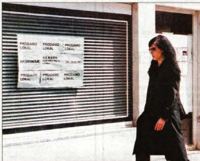
Takih napisov je v Kranju zadnje čase veliko.

Ljudje bežijo nakupovat iz centra na obrobje Kranja, v velike markete. Kranj je postal precej bolj prazen, sredi dopoldneva celo najdeš parkirišče za avto, v starem delu se vse več pojavlja praznih poslovnih prostorov z napisom: oddamo ali prodamo.