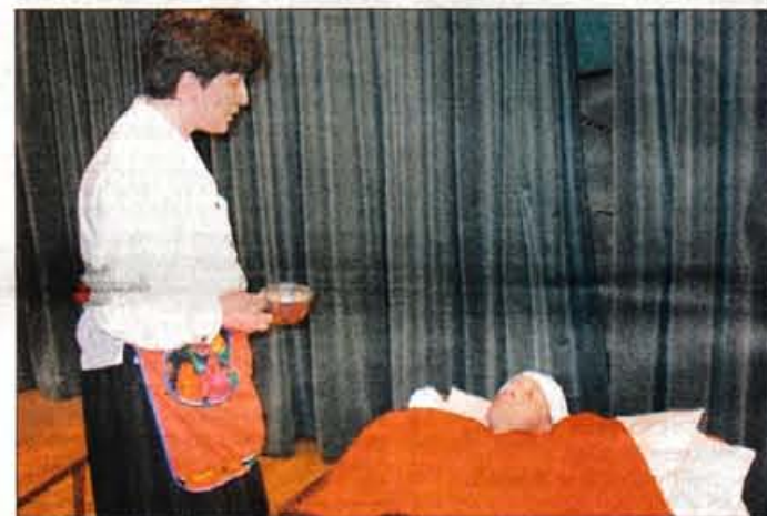
Grabljice in kosci so se predstavili s skečem.