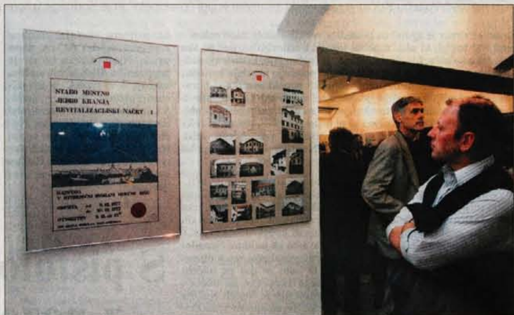
Gostje na odprtju so si z zanimanjem ogledovali razstavo o delu Zavoda v 40-letih.