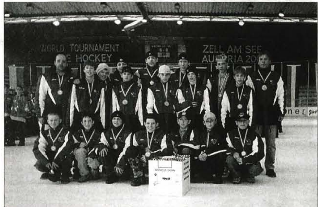
Dečki Bleda so osvojili naslov državnih prvakov, nato pa so se veselili še tretjega mesta na mednarodnem turnirju v Zell am Seeju v Avstriji.