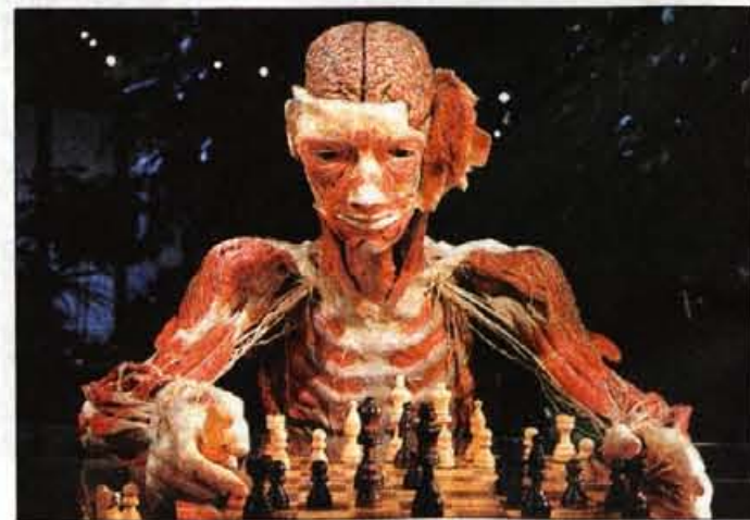
Plastinat s prikazom živčnega sistema - šahist ali mislec.

Pred razstavo mnogi obiskovalci razmišljajo, ali ne bomo ob plastinatih čutili odpora, saj gre za resnična telesa. Vendar gre za drugačna trupla, kot jih nemara