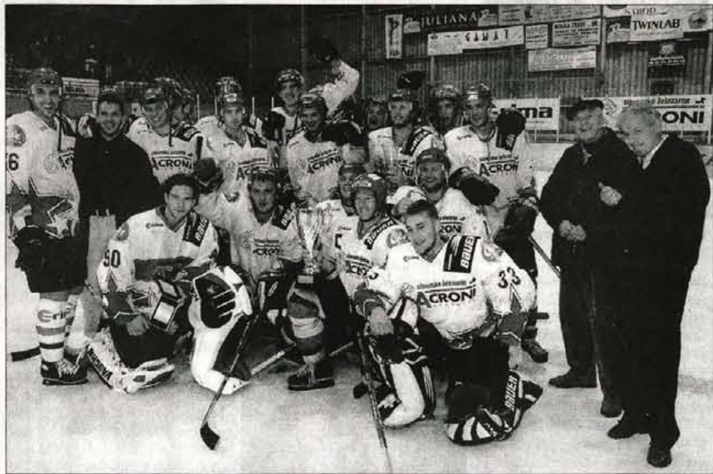
Ekipa Acroni Jesenic se je ob začetku sezone veselila pokala Pivovarne Union.

"Kljub nekaj težavam na začetku sezone smo si s prvim moštvom Acroni Jesenic poleti zastavili visoke cilje. Glavni je bil seveda osvojiti naslov državnih prvakov, vmesni pa so bili naslov zmagovalcev Pokal Union (nekdanjega karavanškega pokala), uvrstitev v drugi krog Kontinentalnega pokala in uvrstitev v polfinale Mednarodne hokejske lige. Res smo slavili v pokalu Union, se uvrstili v drugi krog Kontinentalnega pokala, kjer so nam Čehi onemogočili napredovanje in na koncu osvojili tretje mesto v Mednarodni hokejski ligi. Tudi v državnem prvenstvu smo igrali po pričakovanjih, saj smo se brez težav uvrstili v veliki finale. Žal se je tekmovalje zaključilo z zmagoslavjem Olimpije, razočaranje pa je bilo veliko, saj je bilo, kljub dobri igri našega moštva, usodnih le nekaj trenutkov na posameznih tekmah. Izgubljeno zvezdico bo težko preboleli, vendar pa nam upanje daje nova sezona in uspeh naših mladih selekcij, ki so poskrbele, da na Jesenicah vendarle