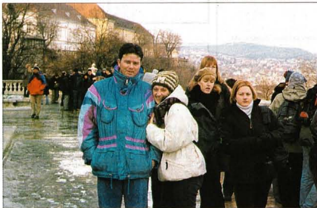
Eden redkih, nasmejanih trenutkov.