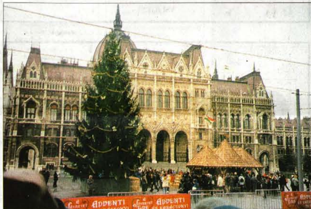
Parlament v Budimpešti.

Silvestrovanje v Budimpešti se je sprevrglo v žalostno iskanje lokacij, zmrzovanje na ulicah pri čakanju na vstopnino, silvestrski večer, ki je trajal komaj kako uro. Budimpešta sama po sebi res ni kriva, da se ZMT-jevci ne znajo organizirati. Vedo sicer, kaj je teorija, o praksi se bodo pa še veliko učili.