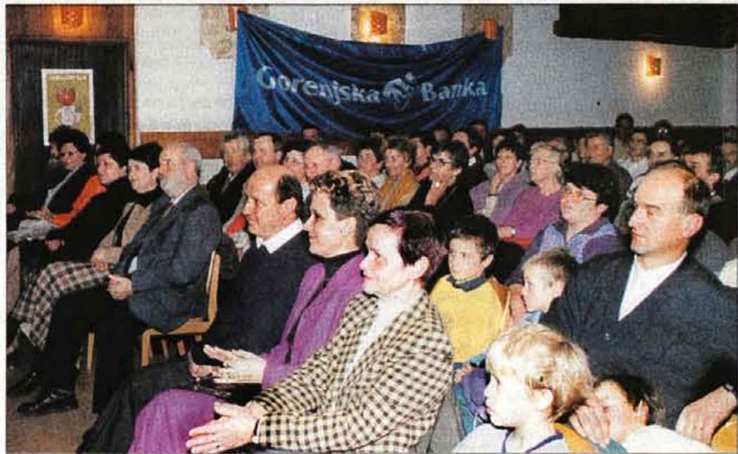
Povsod so domačini napolnili dvorane, najbolj pa v Besnici.