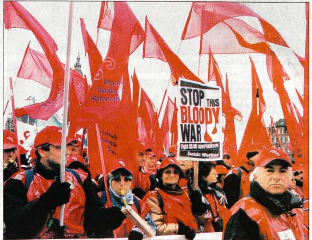
Med svobodnimi so demonstrirali tudi gorenjski sindikalisti.

stacije za socialno Evropo. Kako pozitiven je bil odmev sindikalnih demonstracij v politiki, dokazuje izjava predsedujočega Evropske unije Guya Verhofstadta, ki je večerno tiskovno konferenco začel z besedami: "Belgijsko predsedstvo je razumelo zelo jasno sporočilo 100.000 sindikalnih demonstrantov. To sporočilo moramo v jutrišnjih razpravah na vrhu zelo resno upoštevati." Po besedah bruseljskega župana pa mesto še nikoli v zgodovini ni doživelo tako dobro organiziranih demonstracij. Zahvalil se je za odlično organizacijo, saj pri taki množici