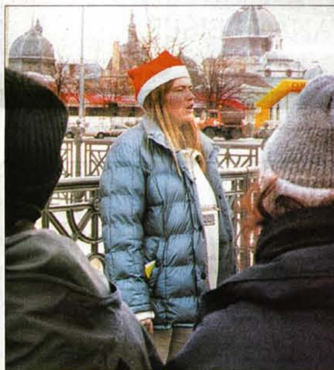
"Moji dragi, upam, da se bom čim manjkrat izgubila," je pozabila povedati naša vodička.

Verjetno nihče od nas, ki smo se z ZMT-jevci odpravili v Budimpešto, ni mislil, da se bodo pa ravno tega držali dobesedno... • Alenka Brun