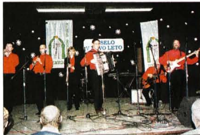
Ansambel Obzorje na Primskovem in v Besnici.