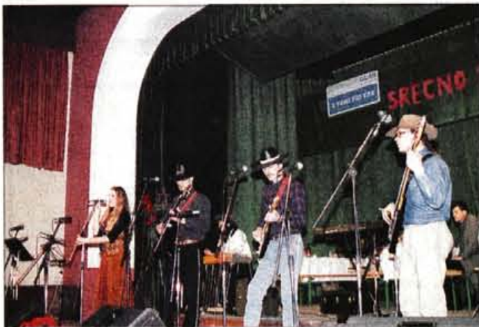
Skupina Country Holics z Bleda.

Sicer pa sta se na Primskovem predstavila dva ansambla. Srečanje in veselo pričakovanje novega leta je začel ansambel Obzorje, končal pa prireditev in jo potem podaljšal pozno v noč še ansambel Jevšek. To je bil tudi že drugi nastop ansambla Jevšek v letu