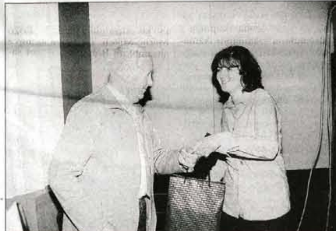
Za pravilne odgovore povsod tudi nagrade Gorenjske banke.

• Andrej Žalar, slike in pogovori: Jože Košnjek in A. Ž.