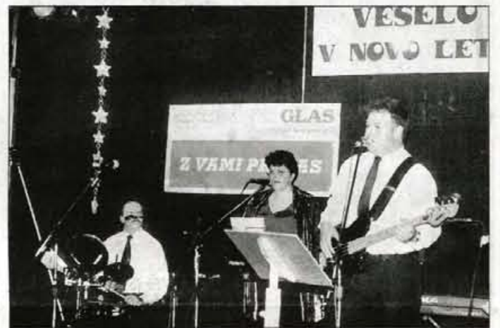
Ansambel Svežina iz Trziča