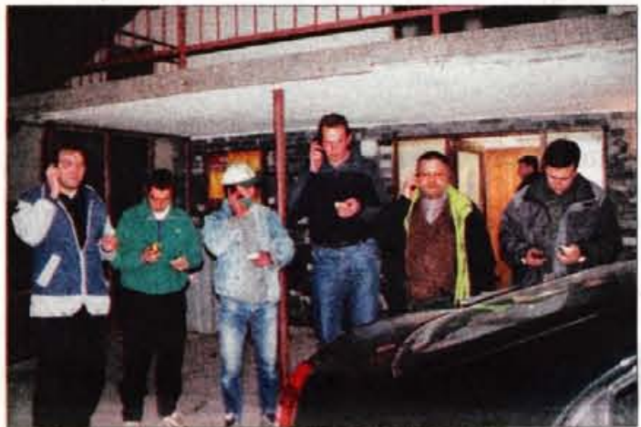
Šest rokovnačev je istočasno naročilo 18 pic, vsak po tri.

Besnica - V Rekreativnem društvu Rokovnači iz Besnice še občni zbor ni samo to, za kar se piše. Rokovnaška je namreč taka, da je zraven vedno treba še kakšno ušpičit. Je potem bolj živo. Namesto klobase po uradnem delu občnega zbora so tokrat v Gasilski dom v Sp. Besnico naročili 18 pic pri 6 kranjskih picerijah, ki svoje izdelke razvažajo tudi naokrog. Kdo bo prvi, čigava pica bo največja, po kakšni ceni. Rokovnači za jesen pripravljajo tudi prave rokovnaške kovance.