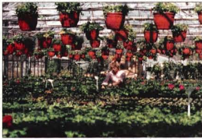
V rastlinjaku - začeli so na 15 kvadratnih metrih, danes jih imajo 1500.

Zato ne preseneča, da je Ruth, čeprav je letos na smučeh tekla le trikrat na Pokljuki, 90 kilometrov na Vasa zmogla brez večjih težav. Pravzaprav so težave bile, in to hude, kajti zadnjih trideset kilo-