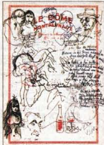
Prvič razstavljena risba Vena Pilon: Le Dome Montparnasse.

Razstava nam tako odkriva doslej neznane risbe iz zapuščine obeh slikarjev, ki so nastajale predvsem v prijateljskem vzdušju njihovega pariškega druženja, pri Pilonu doma, po pariških kavarnah... Risala sta na različne predmete, ki so jima "prišli pod roke", od beležk, projektov, do risbic na škrncilje, listke za račun, na prtičke, majhne papirčke... Risbe nam odkrivajo takratno kavarniško življenje Pariza z njegovimi znanimi in neznanimi umetniki, boemi, primadonami, med slednjimi srečamo tudi najbolj znano med njimi po imenu Kiki... To je bil čas, ko je Pilon po dolgem času spet začel risati, Mihelič pa je pariško svetovljanstvo navdajalo z novo ustvarjalno širino, iz katere je črpal, ko so kasneje nastajala njegova največja dela z njemu značilno fantastiko. Glavno razstavo v Kašči dopolnjuje dokumentarna razstava v Okroglem stolpu Loškega gradu, na kateri bodo med drugim na ogled tudi Miheličeva pisma Pilonu, kasneji ženi Miri, razstavljenih je nekaj grafik, tri Pilonova olja, prvič pa tudi tri skicirke, ki sta jih uporabljala oba umetnika. Preneka-