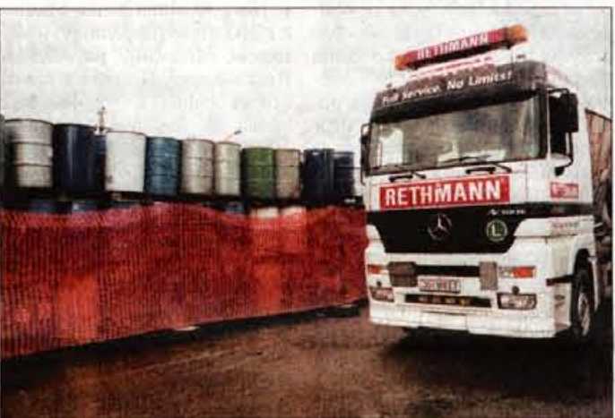
Odvoz odpadkov v sežigalnico v Nemčiji.

"Prodaja je bila ob upoštevanju inflacije realno celo manjša kot leto prej, na kar je vplivala predvsem prekinitev prodaje praškastih premazov za avtomobilsko industrijo na ruskem trgu. V takš-