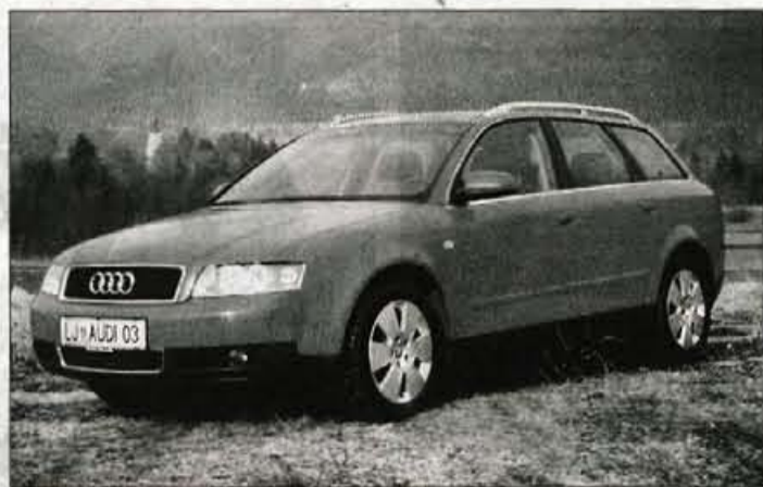
Audi A4 avant je na pogled vsaj toliko všečen kot limuzinska različica in z vsakim delom karoserije dokazuje, da so oblikovalci temeljito opravili svoje delo.

Tako postavnemu avtomobilu se res ne kaže upirati in izbira med limuzino in avantom bi bila vsekakor na strani slednjega. Vsekakor pa se je treba posvetiti odločitvi o barvi; črn bi bil eleganten, a vedno umazan, srebrn preveč anemičen, rdeč... Všeč ji je notranja urejenost, čeprav bi strogosti dodala kanček duhovitosti in za volanom se počuti kot prava dama.