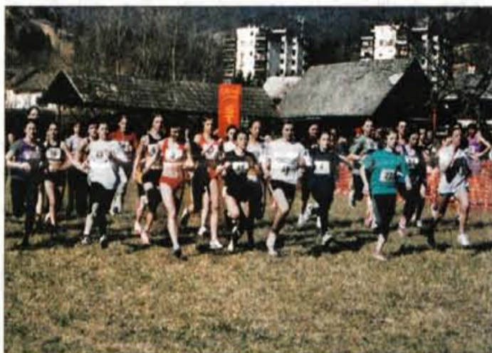
Proga v Primčevem logu v Železnikih je bila tokrat suha in za tekmo dobro pripravljena, največ tekmovalk pa se je pomerilo v najmlajši kategoriji pionirk.

Prve so se na pot podale najmlajše tekmovalke v kategoriji pionirk letnika 1987 in mlajše. Po dveh kilometrih sta zmagali klubski sotekmovalki svetovne rekorderke Jolande Čeplak . Špela Jandrok je bila v cilju za dve sekundi hitrejša od Kaje Rudnik (obe Velenje), na tretje mesto pa