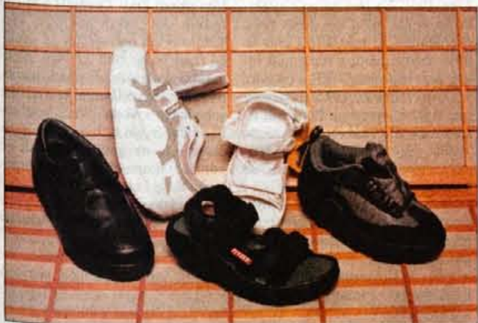
Čevlji MBT zdržijo pet milijonov korakov.