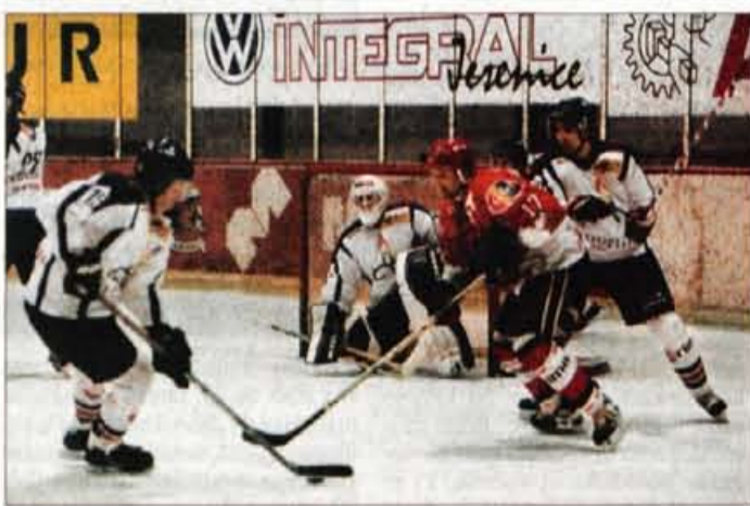
Do zadnjih minut zanimiv derbi so dobili favoriti, ekipa Acroni Jesenic.

Na drugi tekmi za razvrstitev od 1. do 4. mesta je ekipa Olimpije 0:6 (0:2, 0:2, 0:2) premagala Slavijo M Optimo. Na lestvici vodijo