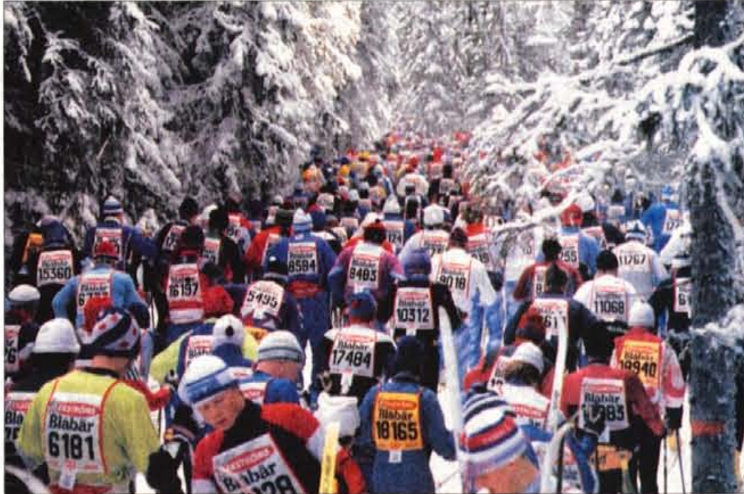
Sloviti Vasa tek: letos se ga je udeležilo več kot 30 tisoč tekačev. Izračunali so, da vsi tekači skupaj, ki tečejo v tednu Vasa tekov, izgubijo toliko telesne teže (vsak v povprečju tri kilograme), da 'izgine' 1300 ljudi.

plesne vaje (Rajko je menda mojster za rumbo!), uživata pa tudi v prehranjevanju na počasen način 'slow food'. Oba nadvse rada tudi kuhata, zlasti za prijatelje, Rajko pa je menda celo bolj izviren kuhar od Ruth. Dokaz je nedavno presenečenje za Ruth (takšna presenečenja so pri Podgornik - Reševih nekaj običajnega): posebej napisan jedilni list in seveda večerja na mizi. Razlog? "Ker se imava rada že 23 let..." Na njem pa: nojev karpač in pasta. Krompirjeve tortice s šitake prigrizkom. Nojev medaljon z brusnicami, riževimi rezanci in ocvrto zeleno. Nojev steak z jurčki, rdečim zeljem in bučnim pirejem. Zimske sanje. In nazadnje: "Urša Peternel, foto: Gorazd Kavčič"