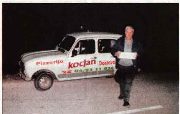
Prvi - V Pizzeriji Kocjan so potrebovali le 20 minut.

Rokovnači so najbrž eno redkih društev, kjer se ne kregajo zaradi denarja. Kolikor ga je v blagajni, toliko ga porabijo, sicer ga prinesejo sami, pri prireditvah pa jim