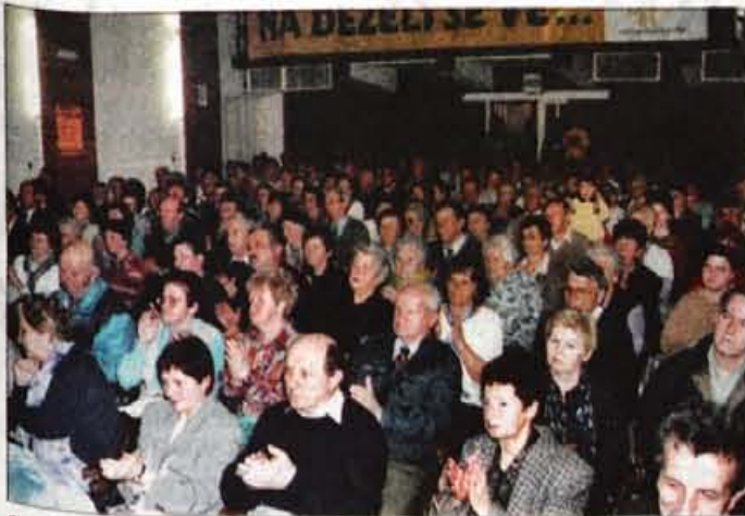
Stražiščani so napolnili dvorano.

Malo je krajev v Sloveniji, ki se ponašajo z rojstnim datumom pred tisoč leti. V Stražišču ga bodo praznovali na osrednji prireditvi novembra letos, praznovanje pa so začeli v soboto s prireditvijo Veselo v pomlad.