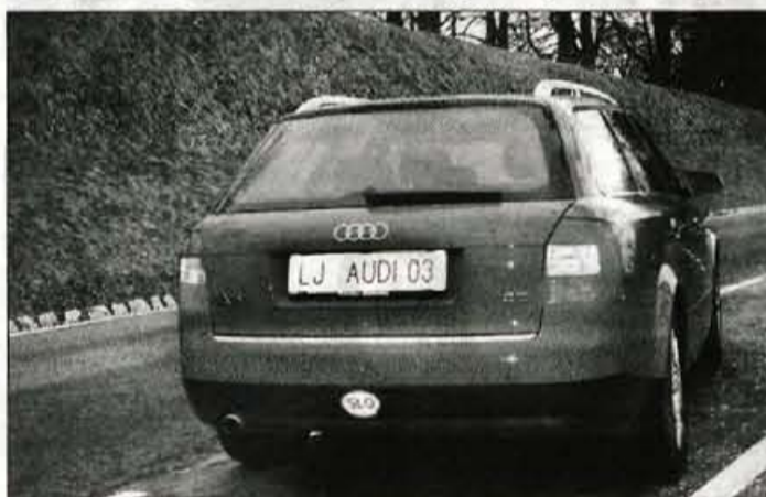
Zadek je mešanica eleganca, športnosti in Audijevih hišnih značilnosti.

stila kot kaj drugega. Armaturna plošča je urejena s smislom za preglednost in uporabnost, merilniki, stikala, reže za zrak in vse