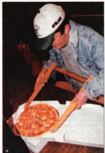
Piši 31,2 centimetra.

pomagajo tudi pokrovitelji. Zato jih bo, nekatere so že bile, tudi letos precej, od poletov, do pohodov