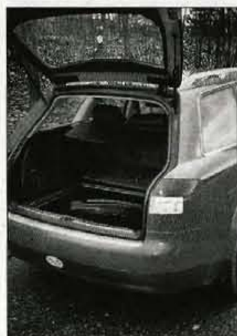
Prtljažnik je le povprečno velik, vendar nadpovprečno prilagodljiv in temeljito obdelan.

V pestri ponudbi becinskih in turbodizelskih motorjev je 2,0-litrski bencinski štirivaljni dober le za povprečneže; za tiste, ki nimajo dovolj denarja, da bi si kupili pogonski stroj, ki bi bil bolj v sozvočju s prestižem tega avtomobila, ali za one, ki mislijo, da ta motor ponuja dovolj. Kakšnih posebno razburljivih občutkov 131 konjskih moči in razpoložljivi navor ne zagotavljata. Motor hoče priganjanje in zdi se, da se pri pretikanju navzgor nekoliko preveč