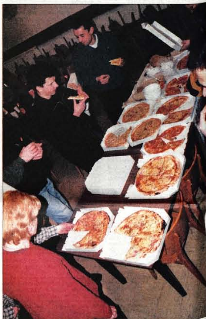
Rokovnači so pospravili prav vse pice.

in piknikov... Letos je pri štirih akcijah povprečno sodelovalo po 40 - 50 rokovnačev, skupaj pa so opravili že 1800 delovnih ur. Pridni, ni kaj. Medtem je pičlih 20 minut po