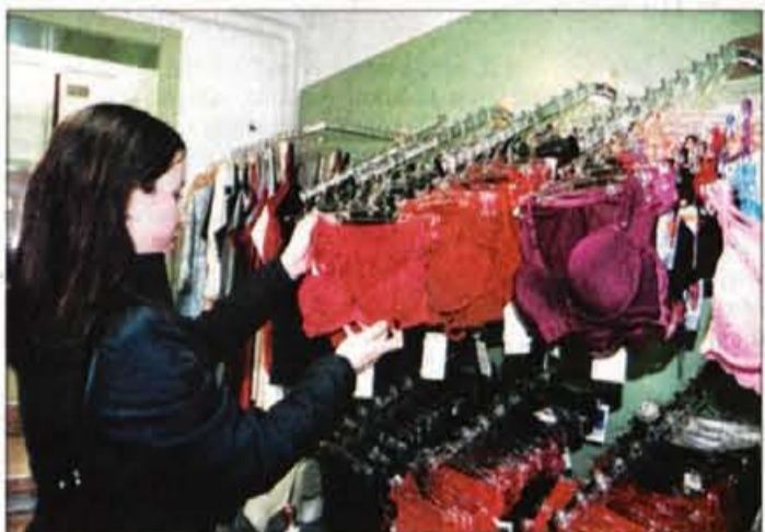
Za nakup perila ob prazniku zaljubljenih se večina odločajo mladi. Obvezno je rdeče barve.