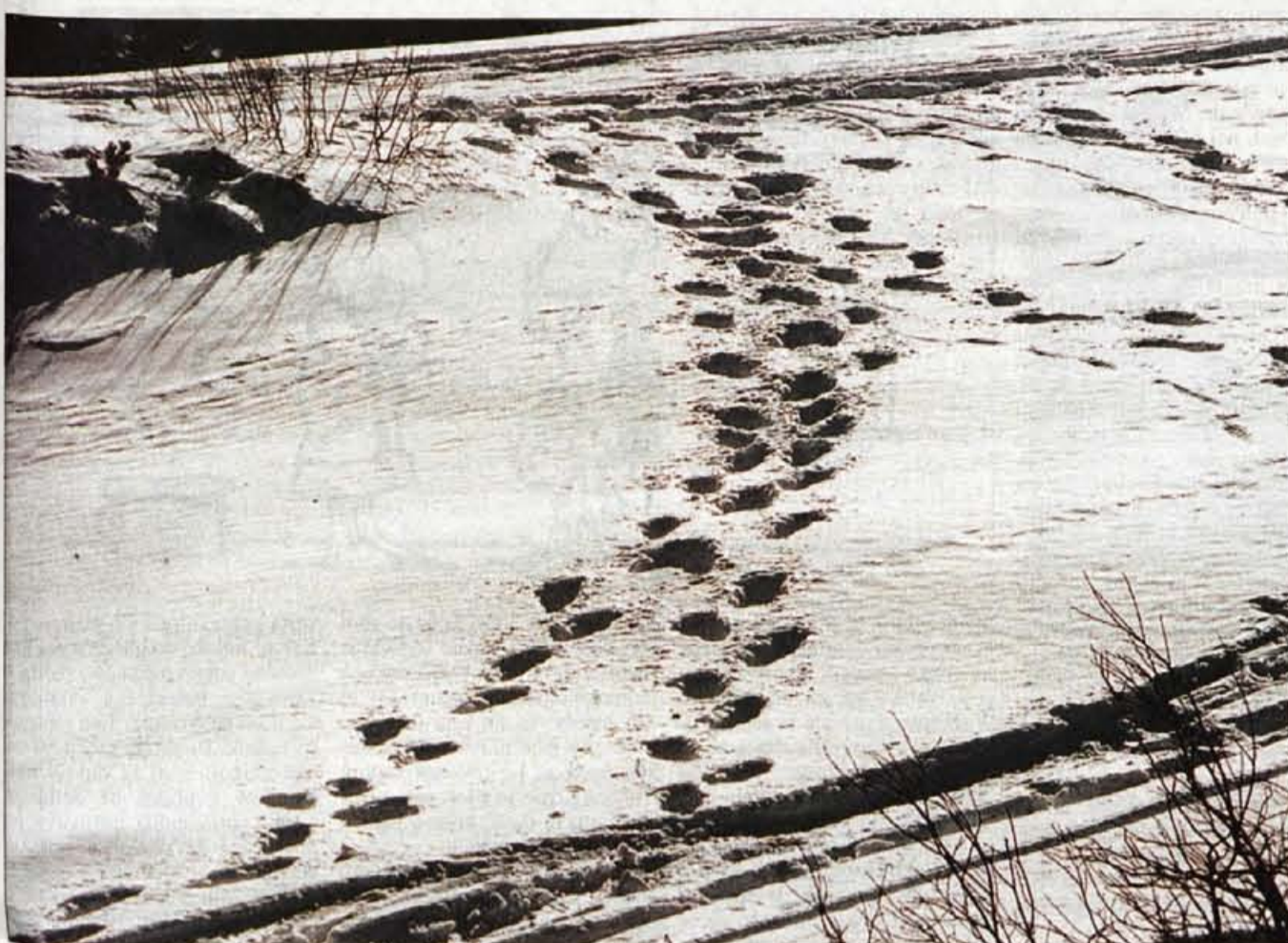
Dobrodelnost pri nas ubira čudne poti.