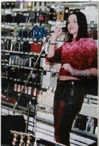
Zaljubljene je v drogeriji Muller na predpraznični dan razveselila popularna pevka Tinkara Kovac.

tudi za nakup perila, na katerem so potiskani srčki, čeprav srčki niso več tako popularni, kot so bili pred leti. Pomembno je tudi, da je vse v lepi embalaži. Zanimivo je, da mnoga dekleta kupijo darilo za fanta in rdeče perilo tudi