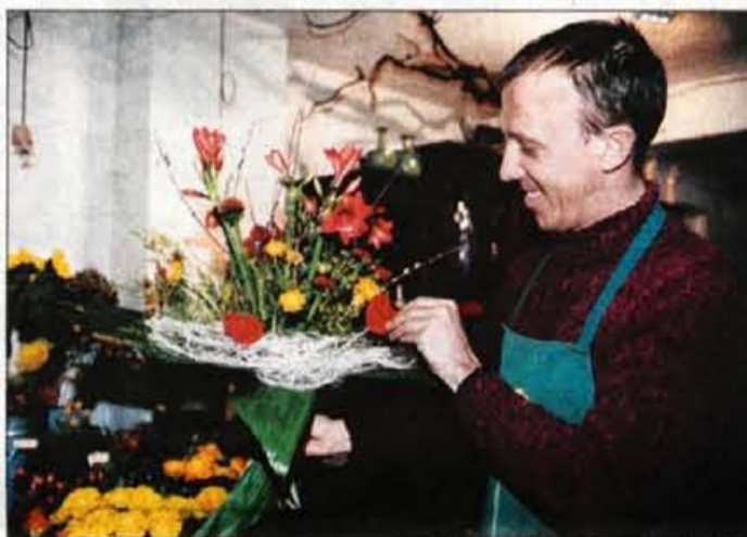
Za Valetinovo zaljubljeni ob šopku dodajo tudi srčke. Cvetličarji so se zato oskrbeli z vsem potrebnim. Največ seveda z rdečimi rožicami...