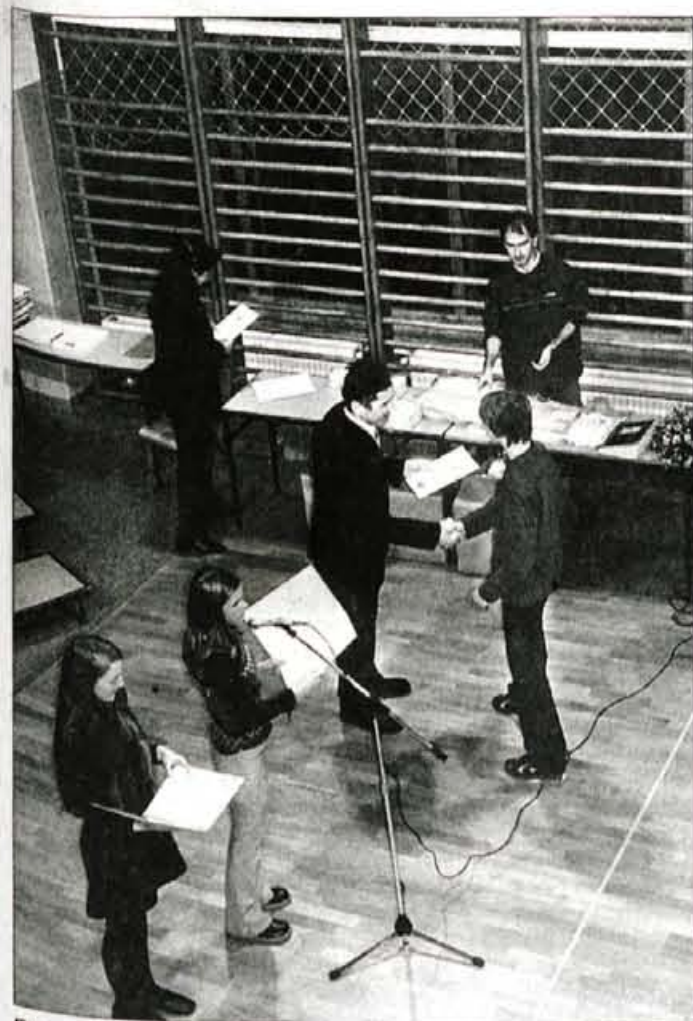
Ravnatelj podeljuje priznanja.

Prireditve Dosežki naše šole je bila letos v večnamenskem prostoru Gimnazije Kranj v sredo, 13. januarja, ob 17. uri. Tako kot vsako leto je bila tudi letošnja namenjena predstavitvi najodmevnejših rezultatov dijakov kranjske gimnazije na šolskih, regionalnih,