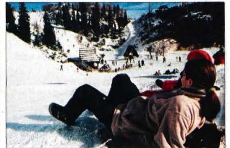
Na Voglu se je vendarle začela prava smučarska sezona.

• Za Gorenjski glas iz Salvadorja Marcelo Nascimento