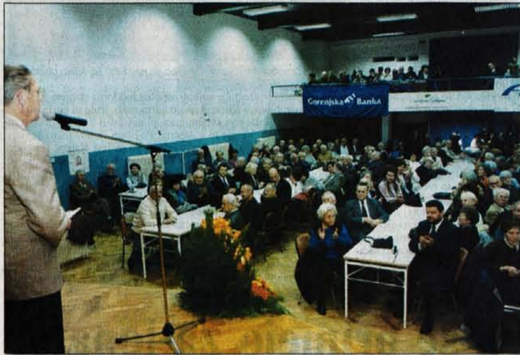
Oživel so spomini na Kokrško četo.