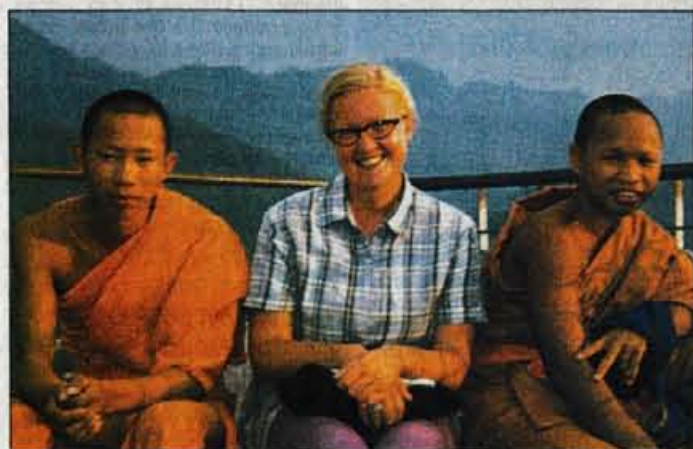
Laos: v nekdanjem kraljevem mestu Luang Prabang z dvema budističnima menihoma.

Njene želje za prihodnost so enostavne: dokončati fakulteto, potem pa delati v turizmu in z lutkami. In vsako leto vsaj za tri mesece kam odpotovati. Zagotovo še v Azijo. • Urša Peternel