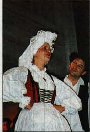
Gorenjska noša iz prve polovice 19. stoletja

različnih kostumov, ki so jih po večini ob Bojanovi pomoči, izdelale kar folkloristke same. Skupina namreč oblačilom, v katerih izvaja program, namenja posebno pozornost. Noše so izdelane na podlagi muzejskih originalov, slik in fotografij, sicer pa se Knific že dlje časa intenzivno ukvarja tudi z našo oblačilno kulturo v preteklosti. Ponavadi 45-članska skupina svoje večje nastope pripravlja tako, da medtem, ko ena skupina plesalcev predstavi en splet, druga že čaka za odrom z drugim spletom v nogah. Veliko so folkloristi s Slovenskega Javornika, sicer prihajajo s širšega gorenjskega območja, naredili pri izpopolnjevanju vseh elementov folklorne nastopa, za kar poleg