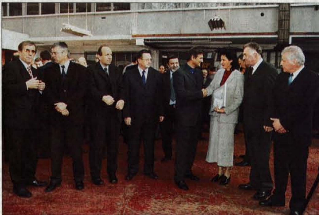
Na slovesnosti ob podelitvi obeh certifikatov in odprtju servisa za tovornjake in avtobuse Mercedes Benz so se zbrali številni gostje, med njimi je bil tudi minister za promet Jakob Presečnik.

"Več kot 90-odstotno se ukvarjamo z mednarodnim transportom, v tujini so nas vse pogosteje spraševali, ali kaj skrbimo za varovanje okolja. Certifikat kakovosti ISO 9001 smo pridobili natančno pred dvema letoma, na začetku je bilo med zaposlenimi veliko vprašanj, čemu je to potrebno, vendar smo ljudi ozavestili in na koncu so se kmalu pokazali re-