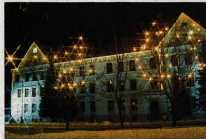
Jeseniška gimnazija je razsvetljena vse noči v letu.

Jesenice - Pred štirimi leti so se pri jeseniški Komunalni direkciji odločili, da bodo pred novim letom okrasili Jesenice s številnimi belimi lučkami, ki so jih napeljali najprej po drevesih na Čufarjevem trgu in na lepi stavbi gimnazije. Prvo leto so bile Jesenice v središču mesta zelo lepo okrašene, občina pa s takšno okrasitvijo deležna številnih pohval. Lepo se je bilo zapeljati skozi Jesenice, ki so se v prednovoletnem vzdušju bleščale v belem siju na tisoče lučk. Vzdrž vse magistralne ceste so stala drevesa, ki so bila vsa okrašena, okrašena pa so bile tudi nekatere stavbe ob cesti.