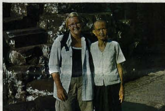
V Angkor Watu v Kambodži z eno od mnogih domačih obiskovalk tega navdse fascinantnega svetišča.

liji (kjer je padla odločitev, da s tako veliko skupino ne bo nikoli več potovala), nato Portugalska, naslednje leto Turčija in nato Maroko, skupaj s sošolci s fakultete in profesorjema. In nato Japonska, kjer je njena najboljša prijateljica študirala. Skupaj sta prestopali dobršen del otoka (Japonci, zanimivo, radi ustavljajo tujcem, ker se želijo pogovarjati angleško), obiskali pa sta tudi Južno Korejo. "In takrat sem se zaljubila v Azijo, kamor se moram vračati..." Sledila je prva samostojna pot. Indonezija. "To je bilo prvo potovanje, da sem šla čisto sama. In ugotovila sem, da je to to, da bom potovala samo še sama!" Zato, pravi, ker ni potrebnih nobenih prilagajanj, sproti lahko spreminjaš načrte, stik z domačini