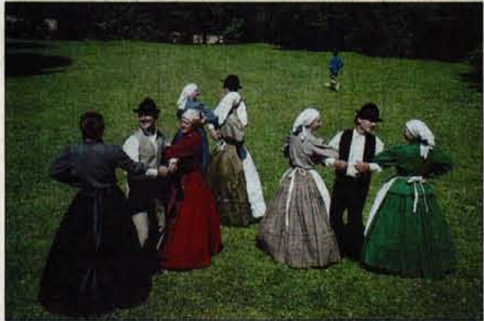
Ples trojke s Štajerskega

Folklorna skupina Triglav, ki bo z jubilejnim nastopom to soboto tudi javno obeležila 10 let delovanja, se je, kljub temu da je na Gorenjskem ena mlajših po stažu, doslej že uveljavila tako v doma kot v širšem slovenskem prostoru, zabeležila pa je tudi dobre odmeve na gostovanjih v tujini. Folklorna tradicija na Slovenskem Javorniku sicer sega že daleč nazaj, intenzivneje se je plesalo sre-