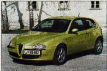
ALFA ROMEO 147

V izboru za Gorenjski avto leta sodelujejo: