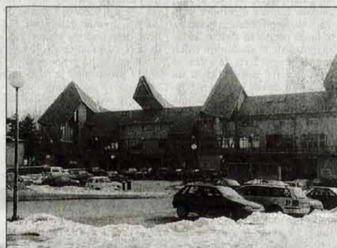
Med velike porabnike energije sodi tudi pokriti olimpijski bazen.

Podjetje Eltec Mulej bo v tej ogrevalni sezoni spremljalo porabljeno energijo v vseh štirinajstih objektih, občina pa bo poleg stroškovnega uvedla tudi energetsko knjigovodstvo. Varčevalni ukrepi so že predlagani za deset objektov, analiza porabljene ener-