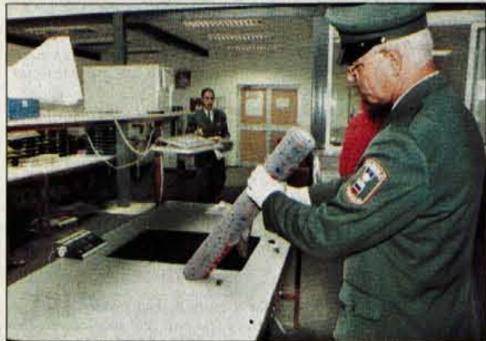
DHL je s Carinsko upravo Republike Slovenije kot prvi v Sloveniji podpisal sporazum o skupnih aktivnostih preprečevanja prevoza nelegalnih substanc.

Prejšnji teden je na Bledu potekala četrta evropska regionalna konferenca pogodbenic Ramsarske konvencije, ki sta jo organizirala Ministrstvo za okolje in prostor in Urad Ramsarske konvencije. Odbor za rešitev Save Dolinke je udeležence seznanil s tem, da se dober kilometer stran od mesta srečanja nahaja naravni spomenik Brje z mokriščni evropskega pomena, ki mu zaradi predvidene sanacije in doinstalacije HE Moste spet preti uničenje. Ministrstvo za okolje in prostor je namreč pripravilo navodila za izvzetje naravnega spomenika Brje iz zavarovanja.