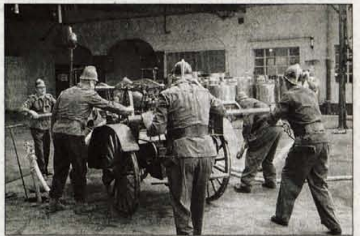
Veterani iz Predoselj so prikazali gašenje z opremo izpred 96 let.

V reševalno akcijo so se vključile tudi ekipe reševalcev in ekipe prve pomoči. Ponesrečencem so nudili prvo pomoč in jih z reševalnim vozilom prepeljali v zdravstveno oskrbo. V akciji je sodelovalo tudi reševalno vozilo