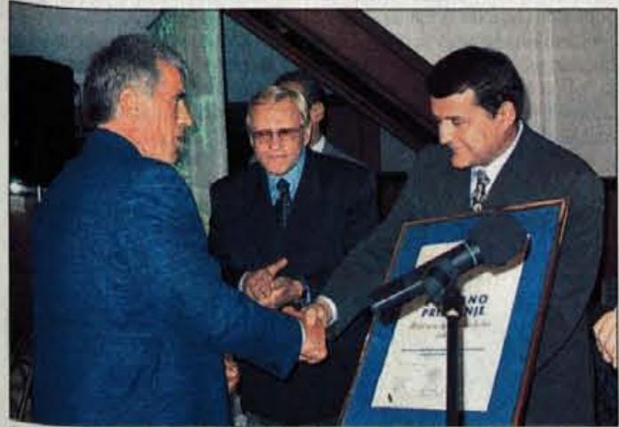
Posebno priznanje je med drugim dobilo Turistično olepševalno društvo Smlednik.

Vsem dobitnikom priznanj in turističnim delavcem je čestital tudi predsednik Turistične zveze