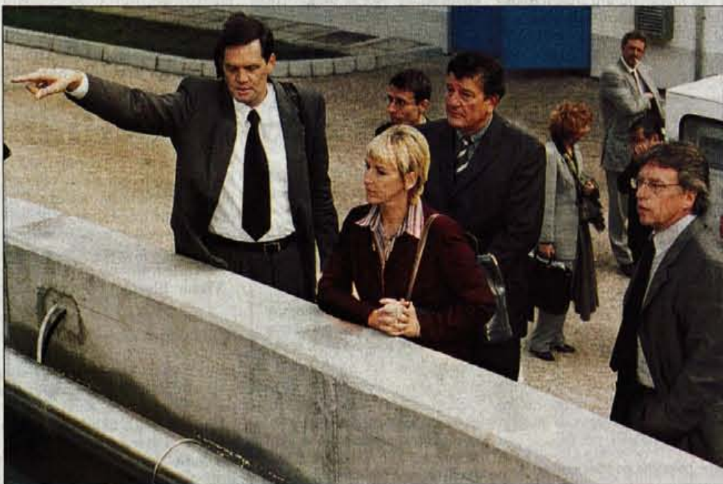
Evropska komisarka Margot Wallström si ogleduje čistilno napravo v Tabrah v Gozd Martuljku...

Evropsko komisarka za okolje Margot Wallström so sprejeli predsednik vlade, zunanji minister, minister za okolje in prostor, ob koncu obiska pa si je ogledala tudi čistilno napravo v Tabrah v Gozd Martuljku. Navdušena nad Zelenci.