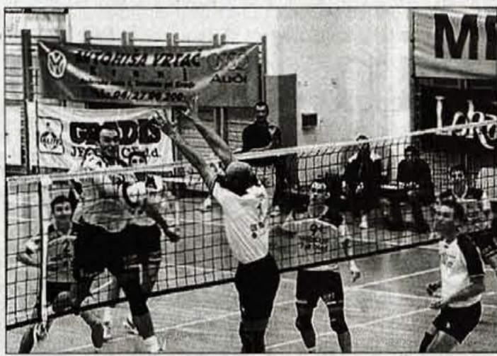
Odbojkarji Merkur Lip Bleda so zanesljivo ugnali goste iz Maribora.

V drugi ligi so odbojkarji Astec Triglav na gostovanju v Braslovčah le prišli do prvih letošnjih točk, pa čeprav predvsem v prvih