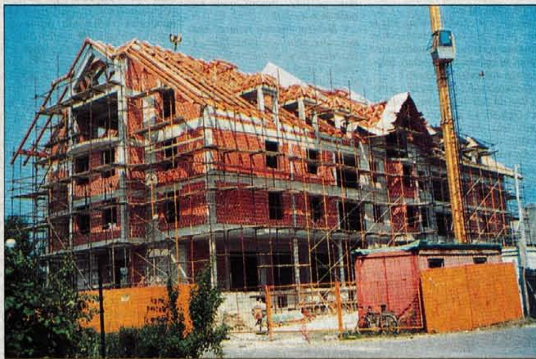
Stanovanjsko poslovni objekt v Šenčurju, ena od aktualnih naložb Stanovanjske zadruge Gorenjske, zaradi pritožbe sosedu zamuja za dobro leto. Zaposleni v zadrugi sprašujejo, kolikšno škodo je zaradi tega utrpela zadruga.

Zapis o domnevnih nepravilnostih poslovanja zadruge so delavci