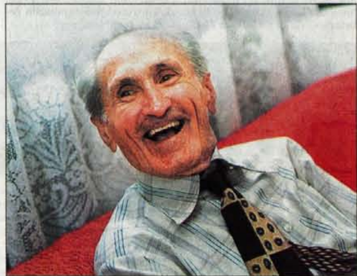
Češki. Kmalu je prišla druga svetovna vojna. Nemci so delavce vrgli na cesto in vse samske poslali na delo v Avstrijo.