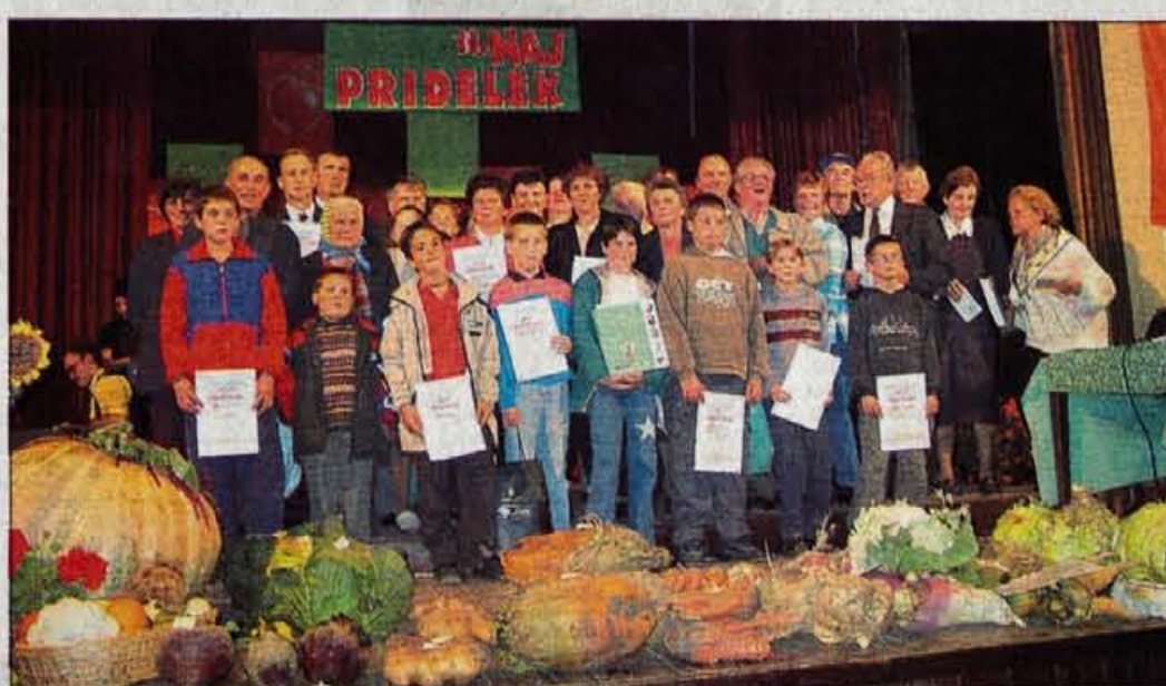
Najuspešnejši pridelovalci letošnjih kmečkih pridelkov.