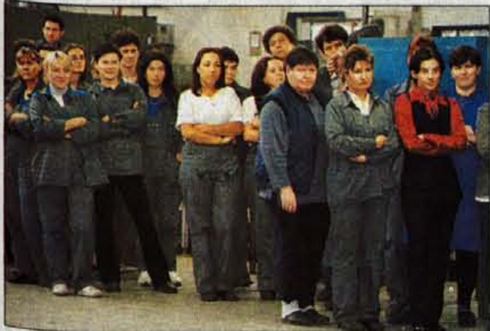
V ljubljanskem obratu je zaposlenih 368 delavcev, obseg proizvodnje pa se že bliža obsegu v Škofji Loki.