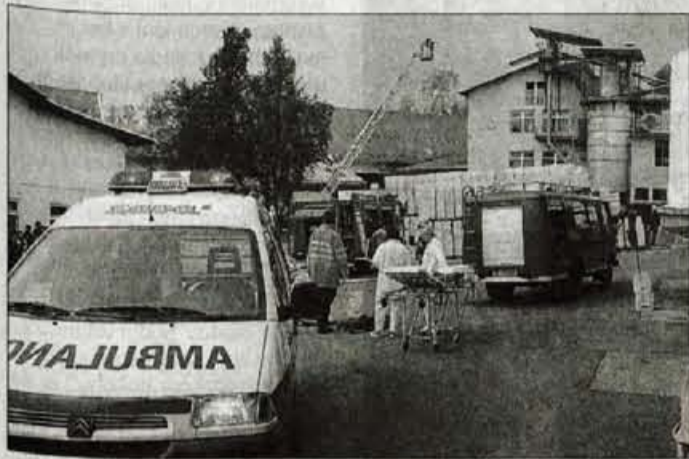
Poleg gašenja so pomagali tudi ponesrečencem.

Britof, 23. oktobra - V program praznovanja 95-letnice tovarne olja Oljarica Britof so minuli konec tedna uvrstili tudi veliko gasilsko vajo, v kateri je sodelovalo sedemdeset gasilcev iz šestih prostovoljnih gasilskih društev, orodna vozila in dve avtocesterni, avtolestev, posebna reševalna ekipa z vozilom Sava in gasilsko reševalna služba iz Kranja.