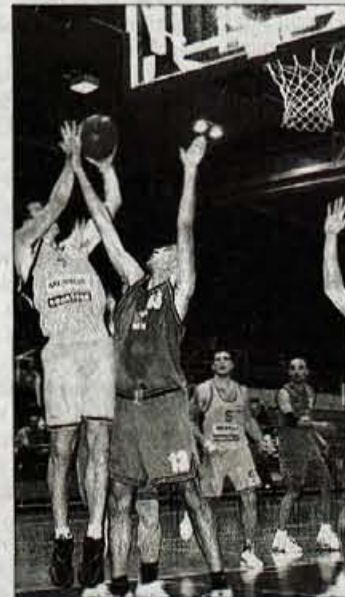
Na prvi letošnji tekmi v Hypo ligi je ekipa Triglava ugnala Zagorje Banko Zasavje.

2. krog so odigrale tudi košarkarice v 1. SKL. Že v tork je ekipa Kobram Jesenice premagala Slovenijo mlade z 82:53, ekipa Odeje pa si je prvo letošnjo zmago zaslužila v Murski Soboti, kjer je s 70:76 (54:57, 39:34, 17:16)