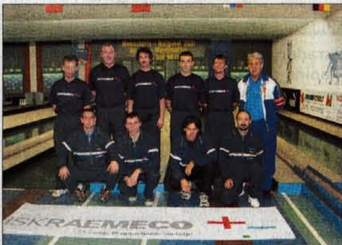
Ekipa Iskraemeca je v Nemčiji dokazala, da sodi v svetovni vrh.