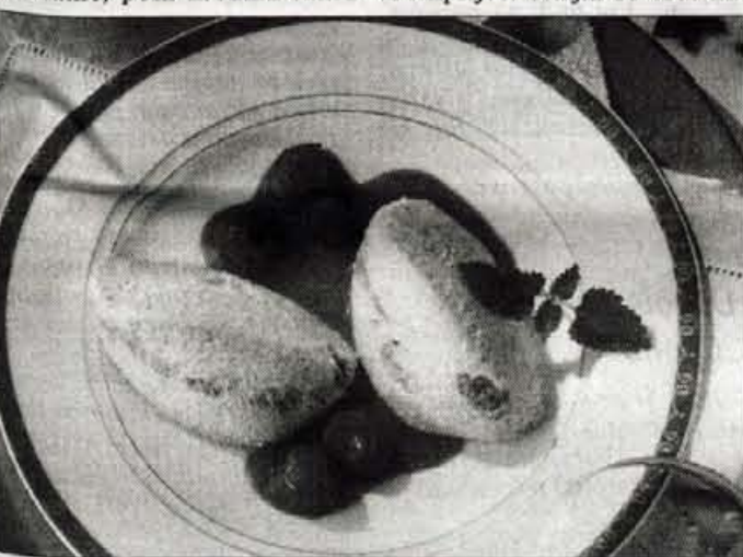
Skutne žličnike imamo lahko tudi za odlično sladico, če jih postrežemo s prelivom iz vložene ali kuhanega sadja.

Cel, opran krompir skuhamo, olupimo, pretlačimo, zabelimo z maslom in dobro premešamo. Ohlajenemu dodamo jajci, sol in moko. Z moko žlico zajemamo testo in ga dajemo v osoljen krop. Ko pridejo žličniki na površje, naj vro še dobro minuto, nato jih s penovko polagamo na ogret krožnik in zabelimo.