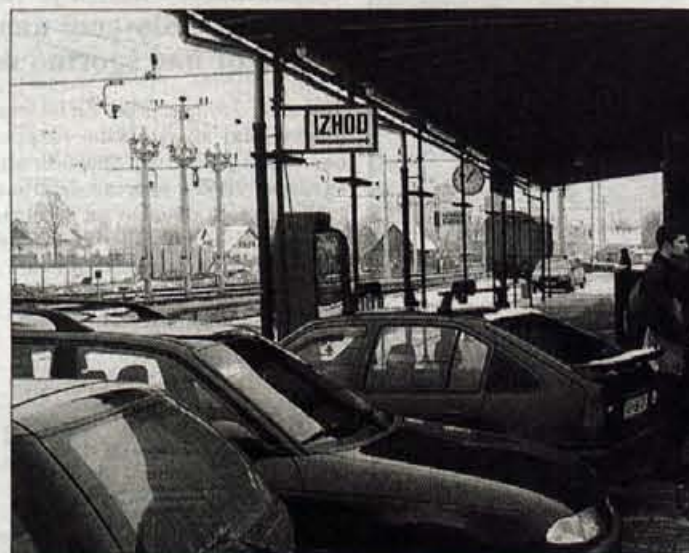
Zastoji prometa proti Ljubljani so ob urejenem prevozu do postaje preusmerili potnike na vlak. Mnogi pustijo svoj avto celo na železniški postaji.

potrebnih soglasij (tudi Alpetourja) ne omogočajo. Kako težavno je to urediti prav v teh dneh, občutijo v Železnikih, kjer je inšpektor za promet izdal odločbo o prepovedi (neregistriranih) prevozov delavcev