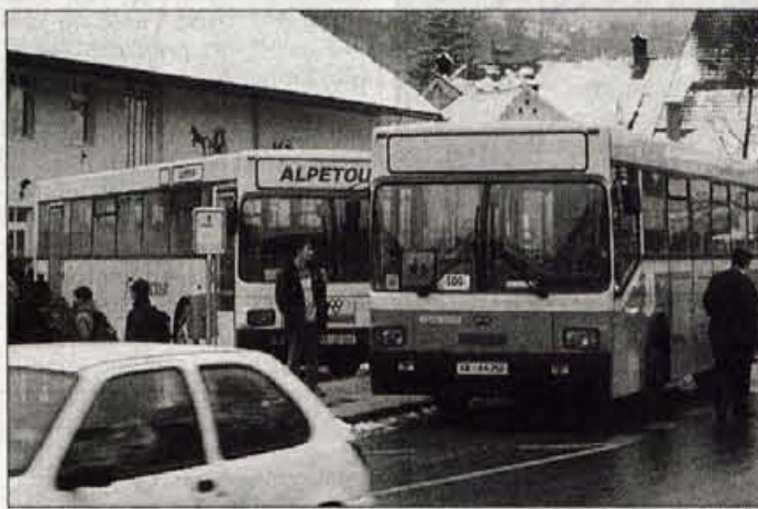
Na Škofjeloškem številni avtobusi vozijo prazni, polni so le ob konicah prevozov učencev, dijakov, študentov in delavcev.

Brez posebnih dogovorov pa so že omenjene proge ukinili v Poljanski dolini: na Občino Gorenja vas - Poljane je preprosto prišel dopis, ki župana in občinski svet seznanja z dejstvom o ukinitvi prog. V razpravi so svetniki priznali, da se resnično nemalokrat po dolini vozijo povsem prazni avtobusi, ne strinjajo pa se z načinom, ko so proge ukinjene brez posveta z občino ali KS, ki najbolje poznajo razmere in potrebe ljudi. Jasno je, da take ukinitve najbolj prizadenejo prav socialno najbolj šibke, ali druge, ki si ne