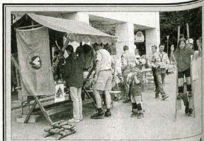
Medvode, 8. junija - Medvoški taborniki se vsako leto predstavijo pred blagovnim centrom Medvode. Tokrat so z igrani in s prikazom različnih veščin seznanjali in vabili mlade medse. Sicer pa je bila njihova sobotna predstavitev prjetna popestritev rednega vsakotedenskega sobotnega nakupovalnega utripa pred centrom Medvode. Tiste obiskovalce, ki so se zanimali za organizacijo in delo v njej, so podrobneje tudi seznanili o programu dela tabornikov v občini Medvode. • A.Ž.

eden do poldrugi odsek celotnega občinskega letnega proračuna za turizem. Takšna so bila že doslej prizadevanja v občini, je na ustanovnem občnem zboru pojasnil Sandi Bartol, predsednik odbora za gostinstvo in turizem. Letošnji program zveze bodo izoblikovali na izvršnem odboru, v katerem je ob predsedniku in podpredsedniku še pet članov. Listino o ustanovitvi turistične zveze Medvode bodo predsedniki turističnih društev v občini Medvode podpisali na prvi seji izvršnega odbora, ko bodo obravnavali in sprejeli tudi program zveze za letos. • A. Zalar