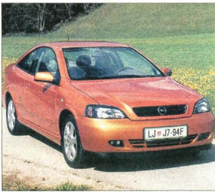
Astra coupe namesto izrazite športnosti ponuja bolj umirjeno zunanost, več elegancije in tudi prostornosti v potniški kabini.

Navade kupcev so se spremenile tudi v tej smeri, da želijo prostornost in udobje in tega lahko astra coupe kljub svoji kupejevski zasnovi ponudi v obilju. Prtljažnik se lahko pohvali s 460 litri in solidno veli-