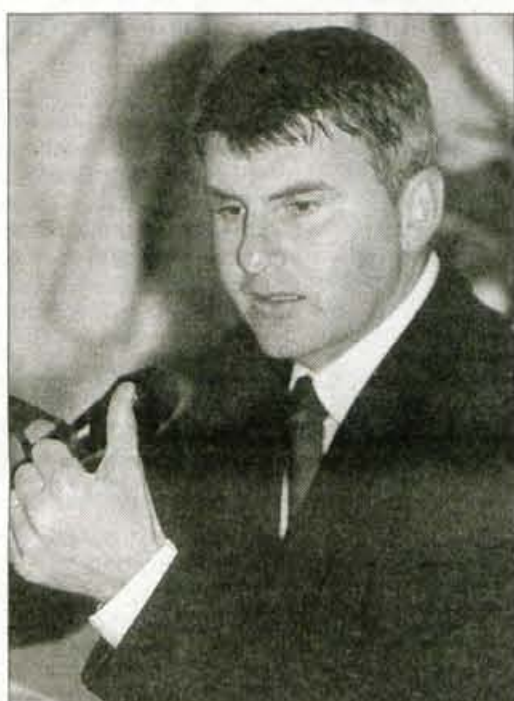
Minister mag. Franc But

"Izhajam iz podeželskega okolja in brat, ki kmetuje doma na kmetiji, je moj prvi kritik. Ljudje živijo v zmotnem prepričanju, da je Evropska unija kriva za vse spremembe v našem kmetijstvu. To ne drži. Spremembe se dogajajo zaradi novih razmer na trgu in bi se neodvisno od tega, ali bi bili v Evropski uniji ali