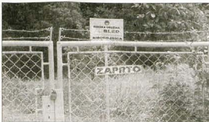
Ribogojnica Bled, last Ribiške družine Bled, je bila takoj, ko so odstranili okoli 2 toni potočnih postrvi, zaprta...

nima toliko denarja, da bi lahko sklenila kakršnokoli zavarovanje. Uradno poročilo pravilno navaja, kaj se je zgodilo. Žal se je tako zgodilo, kot se je... Še dobro, da je naš oskrbnik to opazil. Ko me je obvestil, sem takoj poklical vse: policijo, kriminaliste, Veterinarsko - higienski zavod, inšpekcije, obvestil sem Limnološko postajo, da ne gre za kakršnokoli onesnaženje... Vsi so se takoj odzvali. Zaradi