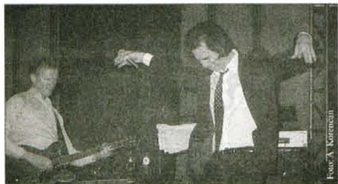
Nick Cave na nedeljskem koncertu v vlogi upornika brez razloga