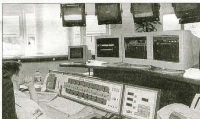
Nadzorna centrala na Hrušici, ki je v celoti računalniško opremljena; nadzor poteka izmenično z avstrijsko centralo Zauchen; ko vodijo predor na Hrušici, so na avstrijski strani v rezervi oziroma 24-urni pripravljenosti in obratno.