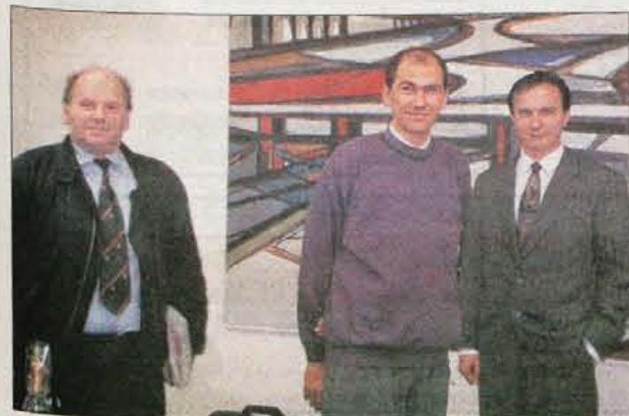
S predsednikom stranke v času po kongresu SDS leta 1993, ko je bil glavni tajnik stranke.