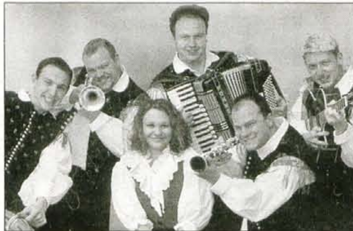
Ansambel Kranjski muzikanti so pred nedavnim izdali zgoščenko.

ansamblov narodnozabavne glasbe. Prireditve bodo tudi tokrat pri šoli v Besnici pod velikim šotorom, glavni medijski sponzor pa je tudi letos Gorenjski glas Več kot časopis.