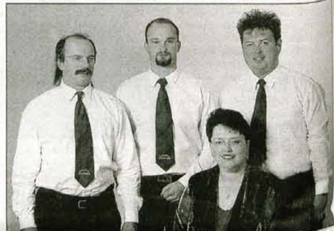
Ansambel Svežina se bo predstavil z novo pevko.