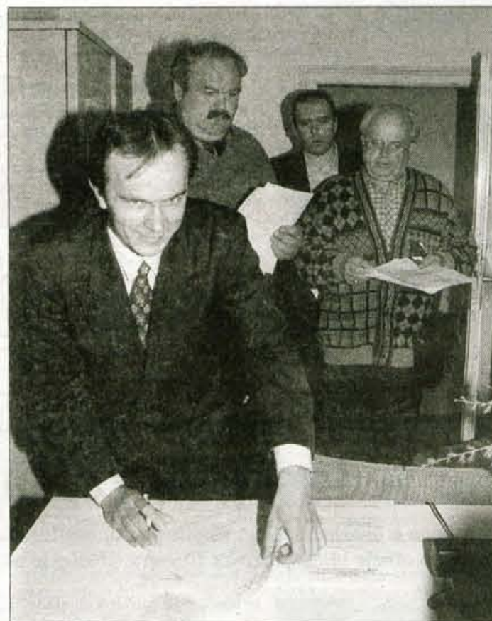
Pomladi leta 1996 ob začetku podpisovanja zahteve za referendum o večinskem volilnem sistemu.

"Pri študiju, pa tudi že prej, ko sem bil v vojski. Žal JLA, sem spoznal, kako velike razlike so med različnimi deli Jugoslavije, spoznal sem, kako velika, takrat še prikrita, so nasprotja med posameznimi narodi, zlasti med Hrvti in Srbi. Vedel sem, da je na nek način treba iti ven iz tega kotla. Ko so se začele spremembe na vzhodu, mi je bilo jasno, da je edina priložnost za Slovenijo, da čim prej seže po samostojnosti. Pri tem sem se tudi sam angažiral, vse skupaj pa je šlo naprej po sistemu, ko enkrat skočiš v vodo, moraš plavati."