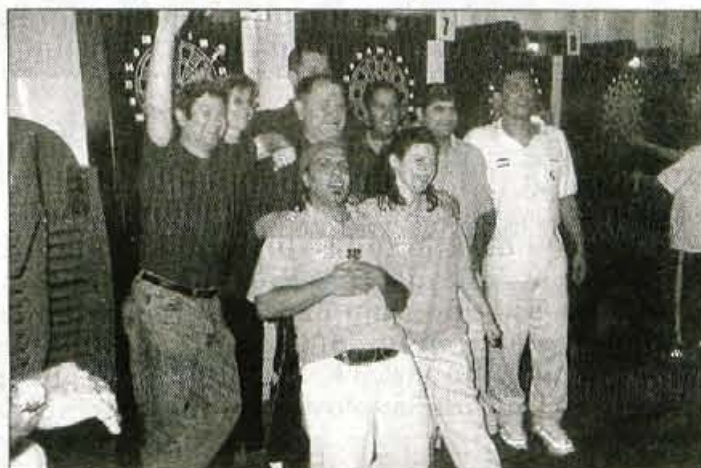
Slovenska reprezentanca se redno udeležuje evropskih prvenstev v pikadu. Letos maja so v Španiji osvojili ekipno 7. mesto.

Kljub temu da je pri nas precej zanimanja za pikado, pa ta šport še vedno nima svoje pikado zveze in tudi ni član Športne zveze Slovenije. "Imamo za resne športnike, čeprav nekateri pravijo, da je naš šport gostilniški. Res pa je, da je večina naših tekmovalcev v lokalnih, kjer so pač aparati za igranje pikada. Vendar pa nas to ne moti, vsako leto se udeležujemo tudi mednarodnih tekmovalj, evropskih prven-