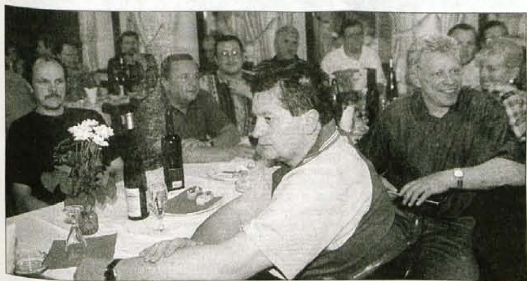
Med Glasovo prejo v restavraciji Tripič