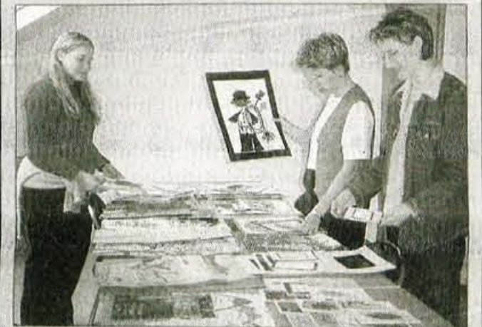
Na sliki: del komisije izbira najlepše risbice.

Kranj, 8. junija - Včeraj zvečer so v Mestni hiši v Kranju odprli razstavo otroških risb, ki so bile izbrane na natečaju Humanitarnega zavoda Vid za novoletne voščilnice za leto 2002. Aprila je namreč zavod objavil razpis, s katerim je otroke od 1. do 4. razreda gorenjskih osnovnih šol povabil k risanju novoletnih motivov. Čeprav pomlad ni ravno pravi čas zanje, je z 20 osnovnih šol vendarle prispelo 160 risb. Posebna komisija je izbrala 10 najlepših, ki bodo krasile novoletne voščilnice, dve pa sta prispevala akademska slikarja Zmago Puhar in Grega Čeferin, sicer tudi člana komisije. Na včerajšnji otvoritvi razstave, s katero so zaokrožili akcijo, so likovni dogodek pozivili z nastopom otroci iz osnovne šole Orehek. Risbe bodo na ogled do 24. junija. Izkupilec od prodaje voščilnic ob novem letu bo Humanitarni zavod Vid namenil otrokom s posebnimi potrebami. Tako se bo zaključil krog od otrok k otrokom. Otroci za otroke so ustvarjali že lani, in sicer so risbe za novoletne voščilnice prispevali otroci in mladoletniki z Osnovne šole Helena Puhar Kranj.