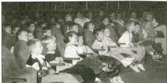
Otroci vrtcev so veselo prepevali in se zabavali, z rednim umivanjem zob pa so si prislužili tudi prijetne in uporabne nagrade.

čedalje manj zobne gnilobe. Med šolskim letom smo opravili tudi anketo o naši akciji, poleg tega smo za četrtošolce pripravili tudi križanko o zobeh. Naše preventivne sestre otroke učijo pravilnega umivanja zob in jih seznanjajo z zdravno prehrano. Preventiva je vodilo naših akcij in na območju nekdanjih kranjskih občin so rezultati razveseljujoči," je po talkovi zaključni prireditvi povedala doktorica Kalan. Zmagovalca med prvimi razredi sta bila 1.b. Osnovne šole Simon Jenko in