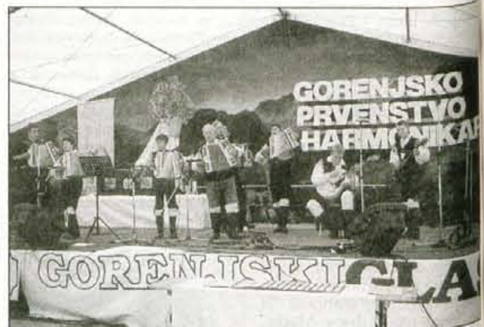
Letos že deseto gorenjsko prvenstvo harmonikarjev.

tokrat pripravili domači besniški gasilci, začelo pa se bo ob 20. uri. V okviru jubilejnega 10. gorenjskega prvenstva harmonikarjev, ki je hkrati ena od prireditev za zlato harmoniko Ljubečne, pa bosta sobota in nedelja pod pokroviteljstvom Mestne občine Kranj potrajali, da sta harmonika in domača glasba v Besniški dolini doma. 2. revija narodnozabavne glasbe se bo pod šotorom začela jutri,