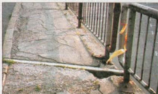
Pločnik ob obvoznici ne zasluži več svojega imena, ograja pa bo v kratkem povsem prerjavela.

Kranj, 29. maja - Kranjska obvoznica od semaforjev prek Gorenjskega sejma do odcepa za Gorenjo Savo in Besnico bi na nekaterih mestih že potrebovala preplastitev, v precej slabšem stanju pa sta pločnik in kovinska ograja. Rjasta prek in prek, pločnik pa čedalje bolj načet. Pešci morajo dobro paziti, da ne stopijo v eno od lukenj, ki jih je čedalje več. Čas je opravil svoje in pločnik z ograjo sta brez dvoma potrebna temeljite obnove.