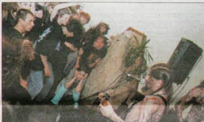
Dan mladosti s kranjskimi God Scardi.

tov Kranj, ki so se tudi letos spoprijeli z organiziranjem velikega dogodka.