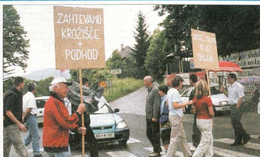
Na vrhu medvoškega klanca

Bevku in Blažu Kavčiču najprej predstavil občinska stališča do izgradnje avtoceste, nato pa so si skupaj ogledali še nekaj značilnih točk na trasi načrtovane avtoceste. V občini pričakujejo poslansko podporo predvsem pri njihovih prizadevanjih za poglobitev dveh kilometrov ceste mimo Lesc in Radovljice ter pri nasprotovanju izgradnje cestninske postaje pred viaduktom Peračica. Če poglobitve ne bo, potem bo po mnenju župana skoraj zanesljivo "padel" tudi jugovzhodni koridor. • C.Z., slika: G. Kavčič