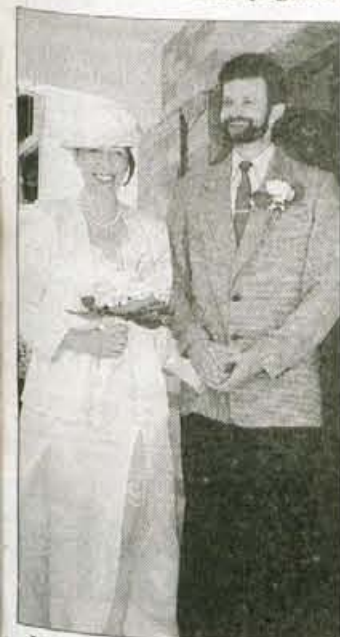
Štajerski par je krenil na pot iz tržiške hiše Na logu.