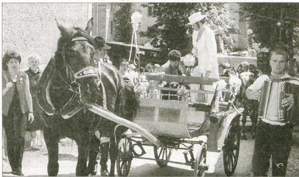
Ženina in nevesto so popeljali do Jelendola na dveh kočijah.