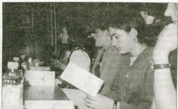
Mladi udeleženci okrogle mize so v sproščnem pogovoru prišli do mnogih napotkov, ki jim bodo pomagali pri izogibanju bele smrti.

Kranj - Na območju Kranja se je v zadnjem času znova pojavilo več ponarejenih bankovcev za deset tisoč tolarjev. Policijska postaja Kranj zato opozarja vse občane na previdnost pri sprejemanju takih bankovcev in hkrati naproša vse, ki karkoli vedo o ponarejenih bankovcih, da to sporočijo na tel. št. 113 ali na PP Kranj (04/268 1599) ali na anonimni telefon policije 080 1200. Ponaredek so sicer hitro vidni, saj gre za računalniški tisk slabe kakovosti. • S.Š.