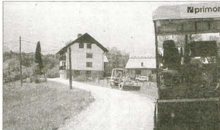
Cesta v Ravnah