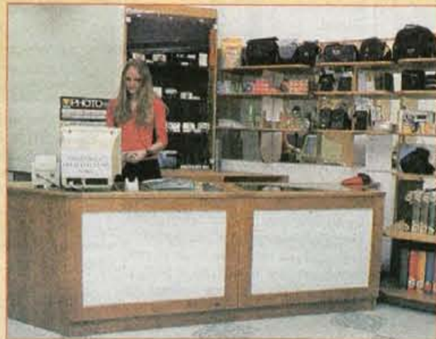
Del bogate ponudbe iz trgovine Foto Mitja.

V soboto, 26. 5., je odprla svoja vrata nova trgovina s fotografskim materialom in pripadajočo opremo FOTO MITJA na Primskovem poleg trgovine TUŠ. Lastnik trgovine MITJA SMRDEL pravi, da boste pri njem lahko kupili filme, baterije, alume za slike, fotoaparate (CANON, ROLLEI, PRAKTICA, EXACTA), torbice za fotoaparate (LOWEPRO, TAMRAC, CULLMANN), daljnoglede, stojala za fotoaparate (MANFROTTO, CULLMANN), dia pribor, itd... V trgovini FOTO MITJA Vam razvijejo fotografije, slikajo Vas za dokumente ali portret, fotografirajo poroke, naredijo "fotke" za reportaže.