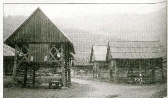
Značilna skupina studorskih stogov pod vasjo, kjer je najožji del zgornje bohinske doline, zmeraj piha in se dobro suši.

"Studorski stogovi toplarji so zanimivo zgrajeni, dveh tipov, na eno ali dve drevesi, z značilno ukrivljenimi stebri, prekriti s škodlami... Pozornost vzbujajo tudi zato, ker jih je na majhnem prostoru zelo veliko in ker so postavljeni v "sanjsko okolje", o katerem je eden od največjih obiskovalcev izjavil: "Pri nas bi za ogled takšne vasi pobirali vstopnino." Nenavadno