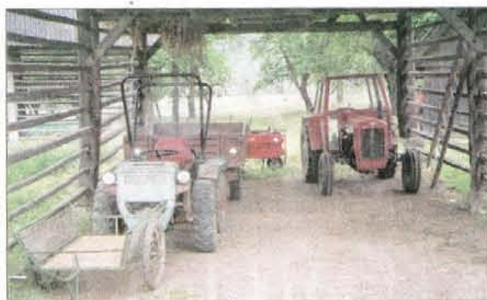
Ferjanov stog je tudi garaža za kmetijske stroje.

bi po nepotrebnem povzročili v vasi kakšne zamere."