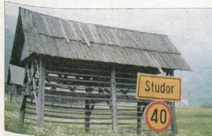
Skozi Studor počasi (stirideset kilometrov na uro) in z odprtimi očmi - to je lepa vas z značilnimi stogovi.

Kaj ustanova Poti kulturne dediščine lahko stori v Bohinju? "Mi reda na tujem dvorišču nikoli nismo hoteli delati in tudi v Studorju ga ne mislimo, lahko pa pomagamo tako, da vzpostavimo širši interes. Ob pomoči domačinov smo februarja sklicali sestanek, na katerem smo povabili enaindvajset lastnikov značilne skupine stogov pod vasjo. Večina se je odzvala in se tudi strinjala z obnovo, pri tem pa smo skupno ugotovili, da bo to velik zalogaj. Najprej bo treba popisati in dokumentirati dejansko stanje stogov, pripraviti načrt postopnih obnovitvenih del in ostalih potrebnih dejavnosti in