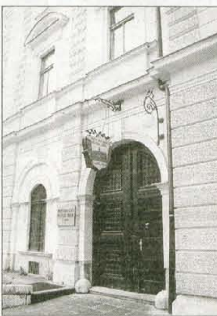
Šentjakobsko gledališče še vedno na starem mestu.

Prvo predstavo, Strindbergovega Pelikana, so na taktatnem Šentjakobskem gledališkem odru uprizorili junija 1921, s to in še drugimi igranimi pa že v tretji sezoni zabeležili stoto predstavo. V nekdanji Mestni dom, kjer se nahajajo še danes, so se preselili leta 1932, ko so postavili tudi prvo uspešno Linhartovo veseligr Ta vesel dan ali Matček se žení. Zanimivo je, da je slednja tudi ena največjih uspešnic zadnjih let.