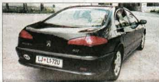
Limuzinsko uglajeni zadek v sebi skriva prostoren, vendar plitek prtljažnik, rezervno kolo je obešeno na dno z zunanje strani.

Limuzina je dolga skoraj pet metrov in zato zasede kar velik mestih, precej ponesrečeno nepregledna (in nerazumljivo majhna) pa sta digitalna zaslon, ki servira podatke o delovanju radijskega sistema, potovalnega računalnika,