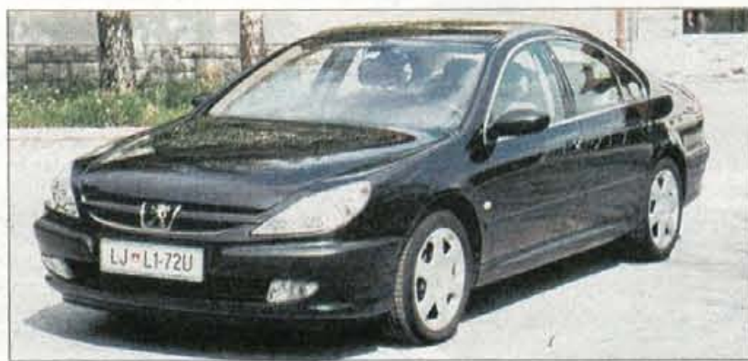
Peugeot 607 je trenutni francoski avtomobilski zastavonoša, ki se mora v višjem razredu kosati z močnimi nemškimi tekmeči, to pa mu uspeva predvsem z obliko.

Po oblikovalski plati je novi Peugeotov zastavonoša uspešen primer združevanja hišne tradicije, moderne brezčasnosti in dovolj odločne napovedi, da so se pri tej avtomobilski znamki spreobrnil. Oblikovalci so učinkovito uporabili filozofijo značilno še za modela 406 in 206, zato je tudi 607 limuzinsko uglajen in hkrati skoraj športno drzen. Sprednja žarometna sta bolj podobna mačjim kot levjim, in skupaj z masko hladilnika, na kateri se bohoti hišni znak, je celoten videz sprednjega dela nekako mačje zvit, nato pa se preko pritajeno zapognjenih bokov in le rahlo priobljene strehe nadaljuje v eleganten zadek z razpotegnjenimi lučmi nepravilnih oblik.