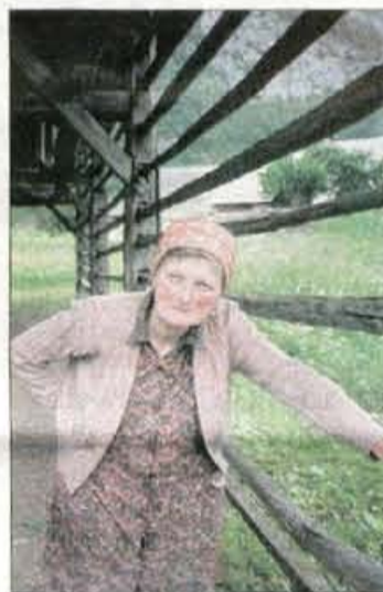
Minka Odar ob Petričevem stogu

je, da so pri promociji nove, samostojne Slovenije med najbolj pogostimi motivi, pri tem pa lastnikom in stogovom ne pomaga nihče. Se več: prepuščeni so problemom in zobem časa. In zakaj počasi propadajo? Ne zato, ker bi bili njihovi lastniki slabi gospodarji! Lastniki bi jih na načine, kot so bili v veljavi nekdanj, že zdavnaj popravili, vendar pa spomeniško varstvena zaščita in zakon o Triglavskem narodnem parku narekujejo, česa ne smejo narediti in kako jih morajo obnoviti. Pri tem je zanimiva pripoved enega od lastnikov, češ: rad bi obnovil stog, to znam narediti, vendar o tem odločajo v pisarnah, kjer vse vedo, a tudi žebnja ne znajo zabiti. Stroka je pri tem včasih neživljenjska, saj stogov ne bi smela obravnavati kot muzeja na prostem, ampak kot "žive" in še uporabne gospodarske naprave, ki so jih lastniki "tudi pripravljeni obnoviti."