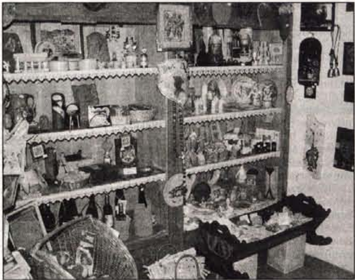
Ponudba turističnega društva Škofja Loka.

Izzrebane številke 16. kroga z dne 22. aprila 2001: 5, 18, 20, 25, 27, 31, 38 in dodatna 1. Dobitek "sedmica" v igri Loto se približuje lanskotnemu rekordnemu dobitku. Za 17. krog predvidevajo, da bo v skladu za sedmico že 120 milijonov SIT.