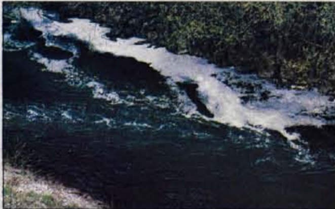
Belo peno, ki je minuli četrtek prekrivala reko Kokro, je zakrivil izpust iz tovarne Ibi.

Kranj, 24. aprila - Mimoidoci so minuli četrtek pogosteje pogledovali v kanjon reke Kokre, kjer so imeli kaj videti. Reka je bila namreč prekrita z večjo količino bele pene. "Nezaslišano, spet si je nekdo privoščil izpust. Očitno so kazni tako nizke, da se podjetja ali zasebniki požvižgajo nanje," je bilo slišati med komentarji. Ni kaj, lep uvod v dan Zemlje. Naš odnos je milo rečeno mačehovski in še dobro, da obratno ni tako.