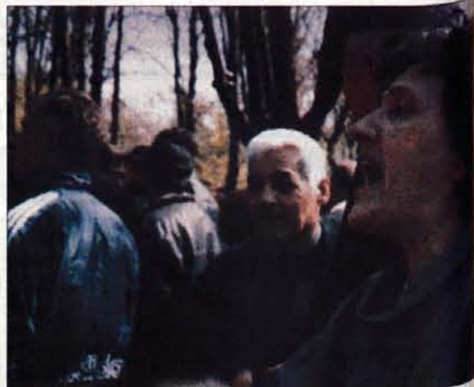
Dan se je počasi prevešal v večer, vzklikanje podpore je bilo vedno bolj šibko.

V uredništvu Freeserbije mi Andrija, še vedno pod vtisi minule noči, pokaže rengentske