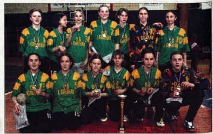
Ekipa osnovnošolskih prvakinj v rokometu je iz OŠ Ivana Groharja.

Rezultati: 1. liga moški: Slovan - Velika Nedelja 22-23; Gorenje - Inles Riko 30-19; Prevent - Trimo Trebnje 25-25; Termo - Pivka Perutinarstvo 33-16; Tekmi: Celje P.L. - Doboba in Avto Mikolič Rudar - Mobilnet Prule 67 bosta v sredo. 1. B liga moški: Gorišnica - Ormož 29-29; Krog Bakovci - CHIO Kranj 22-32; Smartno - Sevnica 19-28; Dol TKI Hrastnik - Cimos Koper 32-23; Tekma med Sežanci in Goričani bo v sredo, Izola pa je bila prosta. 2. enotna liga - moški: Kamnik - Sviš 21-32; Sava - Mokerc 19-23; Grosuplje - Arcont Radgona 32-24; Novo Mesto - Fužinar 37-25; Tekma Ajdovščina - Krim ni bila odigrana. 2. liga - kvalifikacije: Kras - Alples 28-24; Jezersko - Cerklje 33-22; DOM Zabnica in Radovljica prosti. • M. Dolanc