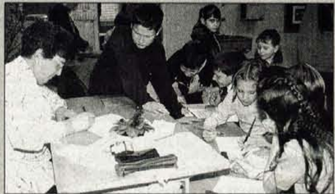
Razstavo v šoli so popestrili s prikazom praktičnega dela pri nekdanjem pouku.

V petek dopoldan so učence v Spodnjih Dupljah obiskali vrstniki iz centralne šole v Naklem in podružnice v Podbrezjah. Dan šole je minil ob ogledu zanimivosti v okolici, prireditve domačih solarjev in razstave. V spodnjih prostorih šole so uredili sodobno učilnico. V nadstropju so razstavili likovne izdelke, prikazali stara učila in predstavili razvoj šole po letu 1950. Posebej zanimiva je bila delavnica, v kateri so pletli in vezli, oblikovali predmete iz lesa in se učili lepopisa. Pri tem so jim pomagali tudi nekdanji učenci.