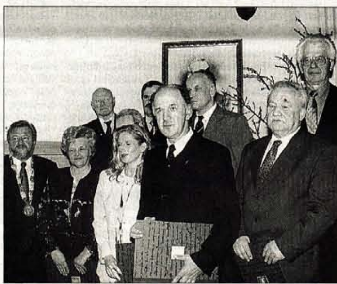
Letos so v občini Kamnik podelili devet priznanj in razglasili častnega občana.

njegov pomen. Med drugim je bil eden ob pobudnikov in peševalcev ustanovitve višje gimnazije v Kamniku. V zadnjem času pa je s tehtnimi strokovno znanstvenimi prispevki