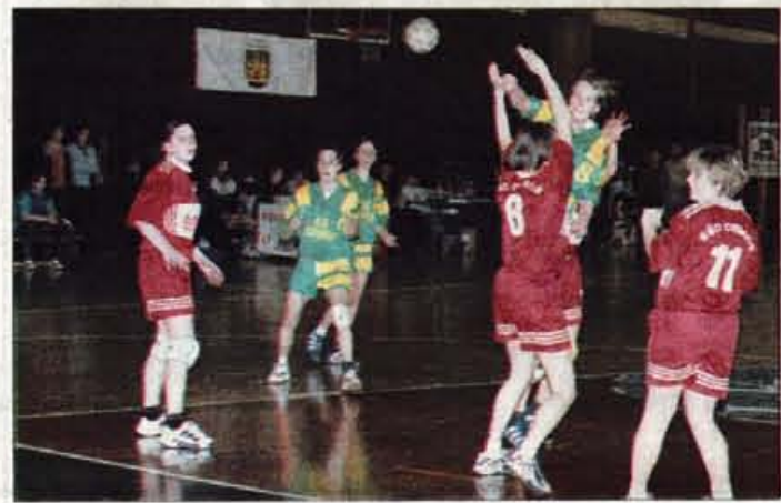
Mlade rokometiške so domačim navijačem dokazale, da so najboljše.

"Nekateri se sicer sprašujejo, zakaj so ob klubskih potrebah še šolska tekmovanja, vendar pa je namen šolskih tekmovanj predvsem spodbujanje množičnosti, pri klubskih tekmovanjih pa je seveda cilj kvaliteta. Zato je naš cilj tudi povezovanje med šolami in klubi, kar pomeni množičnost in kvaliteto. Hkrati se morata vključiti tudi lokalna skupnost in panožna zveza in tako je razvoj športa zagotovljen," je ob prire-