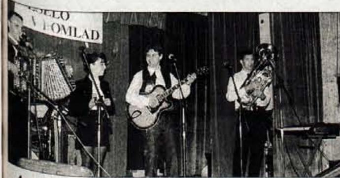
Ansambel Tulipan se je na prireditvi Veselo v pomlad prvič predstavil v dvorani v Podljudelju.

Dvakrat so že bili z nami na prireditvah Veselo v pomlad, prvič v Podljudelju, drugič pa v Leskovicah. Prijetno presenetili so na obeh prireditvah, ki so ju pripravili v Podljudelju krajevna skupnost, v Leskovicah pa Gostilna Metka. Ansambel Tulipan je obakrat potrdil, da so skupina, ki zna poskrbe-