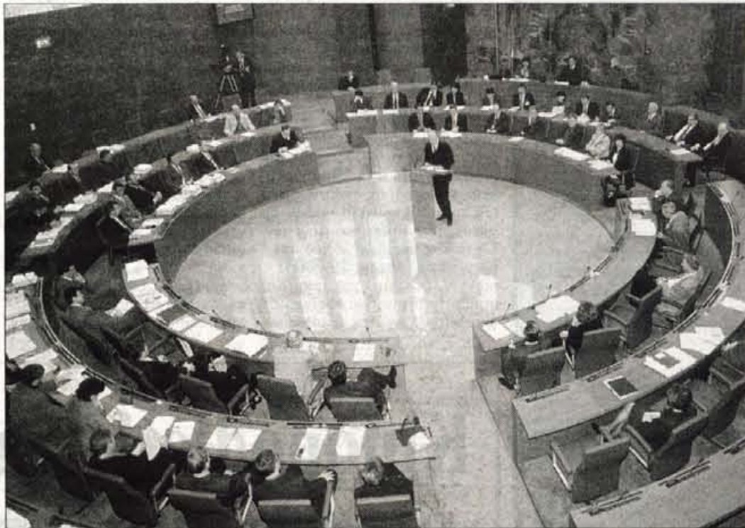
Poslanci državnega zbora bodo v tem mandatu zanesljivo razpravljali o financiranju občin in ustanavljanju novih občin. Zakon o financiranju občin naj bi spodbujal ustanavljanje novih manjših občin.

pa je razmerje med površino občine in številom prebivalcev, dolžina lokalnih cest in število prebivalcev, mlajših od 15 in starejših od 65 let, primerjano s povprečjem v državi. Za izračun se smejo upoštevati samo podatki, ki jih posredujejo ustrezne strokovne službe na državnih ravni. Če bi vzeli znesek primerne porabe kot mejo med