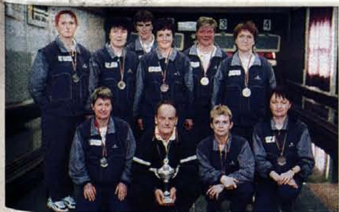
Ženska ekipa Triglava je osvojila drugo mesto za Miroteksom.

Končni vrstni red: 1. Miroteks (34 točk), 2. Triglav (29), 3. Adria Ankarana (21), 4. Gradnje IGEM (19), 5. Izola (18), 6. Gorica (16), 7. Brest (14), 8. Prosol-Stiking (14), 9. Postojnska jama (11), 10. Kočevje (4). V.O., V.S., foto: G. Kavčič