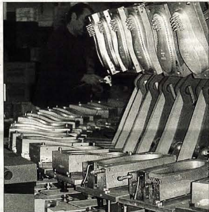
V tržiškem PGP izdelajo 28 tisoč parov podplatov dnevno. S pomočjo novega, trenutno najmodernejšega stroja za izdelovanje poliuretanskih podplatov bodo izboljšali kvaliteto izdelkov, omogoča tudi izdelovanje podplatov iz kombinacije različnih materialov.

te in boljši servis," je povedal direktor Zupan.