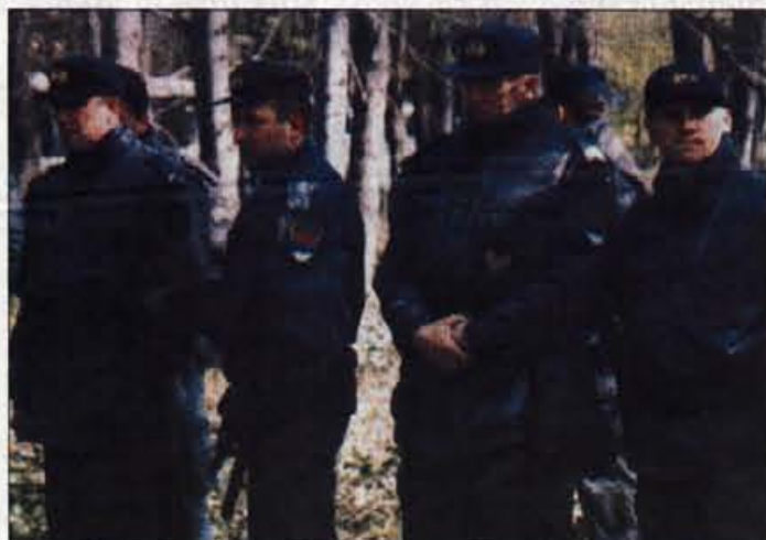
Kopica policistov pa jih je malce z dolgočasno opazovala.