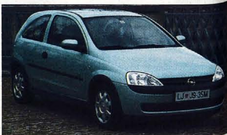
Nova corsa je vsestransko odrasla in ima poleg nove oblike tudi povečane mere v vseh smereh.

spodnjem delu odbijača. Zelo značilna je tudi plastična obroba nad zadnjima blatnikoma, popolnoma na novo pa je ukrojen zadek, kjer so oblikovalci lučem določili mesto v strešnih stebričkih. Zaradi takšne zasnove so prtljažna vrata lahko širša, pod njimi pa je skrit za ta razred kar velik prtljažni prostor, ki ima samo to pomanjkljivost, da nato varjanje nekoliko ovira visok rob. Corsina notranjost je tokrat dovolj udobna tudi za višjerale potnike, vzdolžni pomik