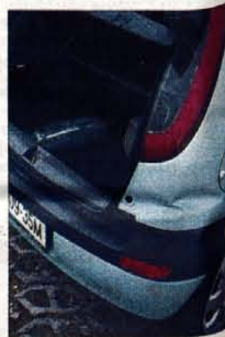
Prtljažnik: solidno velik, vendar z visokim nakladalnim robom.

Corsino podvozje je tokrat precej bolj uglajeno, kot je bilo pri prejšnji generaciji. Zaradi podaljšane medosne razdalje in večjih koles sicer dokaj