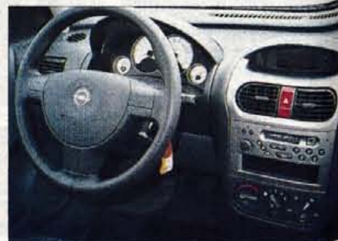
Pred voznikovimi očmi je pregledna armaturna plošča, ki je vdoljena v nekoliko preveč ceneno plastiko.

voznikovega sedeža je zadosten, preglednost armaturne plošče, kjer kraljujejo z belo barvo podloženi merilniki, zelo dobra. Oplovo okolje s stikali, s sredinsko konzolo, ki ima videz aluminija, in z ločenim zaslonom za radio, termometer in digitalno uro, je razpoznavno oplovsko, plastika na armaturni plošči bi morala biti za odtonek