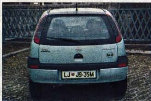
Stilska sprememba: zadnje luči so se umaknile v strešna stebrička.