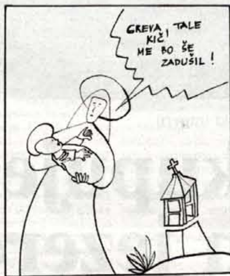
Tudi Marija z Jezuškom trpi v črnih gradnjah.

Glavič si je hotel v Trzišču postaviti spomenik za vsako ceno (v nadaljevanju boste videli, da se je za posel zmenil s samim hudičem). Zato je izsilil gradnjo nove gospodinjko-obrtne šole. Priženič je (tudi