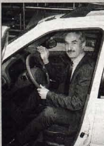
Težko in hkrati veselo slovo: Šparovec je izza volana svojega novega službenega vozila z orošenimi očesi še zadnjič pomahal v slovo svojim najtesnejšim sodelavcem.

Senzacionalni prvi primer na evropskem sodišču: Kako se je v Trzišču hudičilo