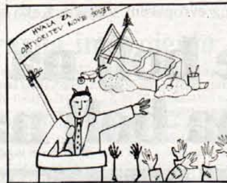
Tudi na šolo je Hudič kupoval tržiščanske duše.