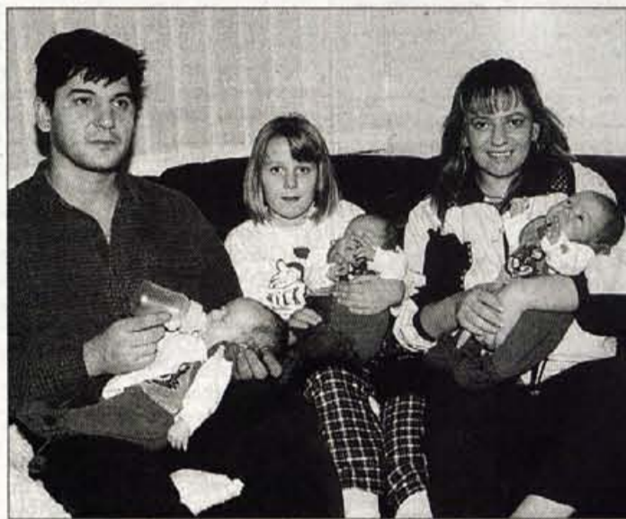
Delitev dela v modernih družinah je drugačna kot nekoč.

kulture ženske predstavljajo 67-odstotni delež. Sicer pa ženske prevladujejo tudi v podjetjih s področja gostinstva in turizma (67 odstotkov žensk) in trgovine (61 odstotkov žensk).