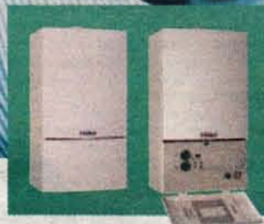
Visoka tehnologija na Vaillant način: Atmoblock Plus in Turboblock Plus

... Z NAŠO NOVO GENERACIJO PLINSKIH STENSKIH GRELNIKOV: