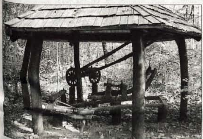
Ali se bo dediščina preteklosti na gozdni učni poti morala umakniti koridorju AC?

"Najprej bi rad poudaril, da nisem strokovnjak za cestno področje; enostavno sem si vzel čas in preštudiral predstavljeno gradivo, tako kot bi to lahko storil vsak občan. Osredotočil