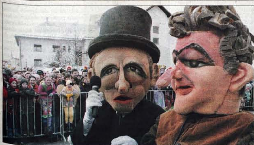
Največji gorenjski pustni sprevod

Leto LIV - ISSN 0352 - 6666 - št. 16 - CENA 150 SIT (12,50 HRK) Kranj, torek, 27. februarja 2001