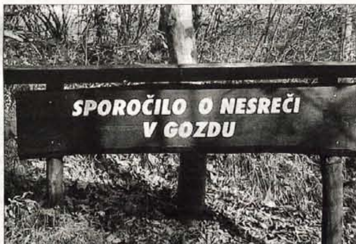
Nekoč se je tu nekdo ponesrečil. Približno na tem mestu je načrtovan začetek viadukta čez potok Zgōšo, kar bo nesreča za gozd.

"Dejstvo je, da je hrup moteč dejavnik v prostoru, obenem pa je tudi zdravju škodljiv. Hrupa je že danes preveč, še posebej