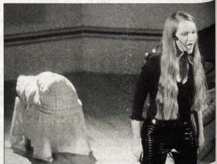
Kakšna bo usoda pravkar rojenih dvojčkov?