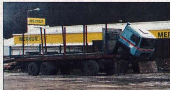
Zapuščeni tovornjak s priklopnikom lahko odstrani vsak, kdor želi, saj že leta velja za zapuščenega.

Naklo, 20. februarja - Zemljišče nasproti nakelske bencinske črpalke ni le parkirišče tovornjakov in vlačilcev, ampak tudi njihovo odlagališče. Svetlomodrega tovornjaka s priklopnikom se je lastnik več kot očitno želel znebiti, saj vozilo že leta stoji na omenjenem makadamskem parkirišču in ga je iz dneva v dan čedalje manj. Pobrli so vse, kar je bilo na in v njem uporabnega. Ostalo pa je tisto, kar je najbolj vidno in moteče.