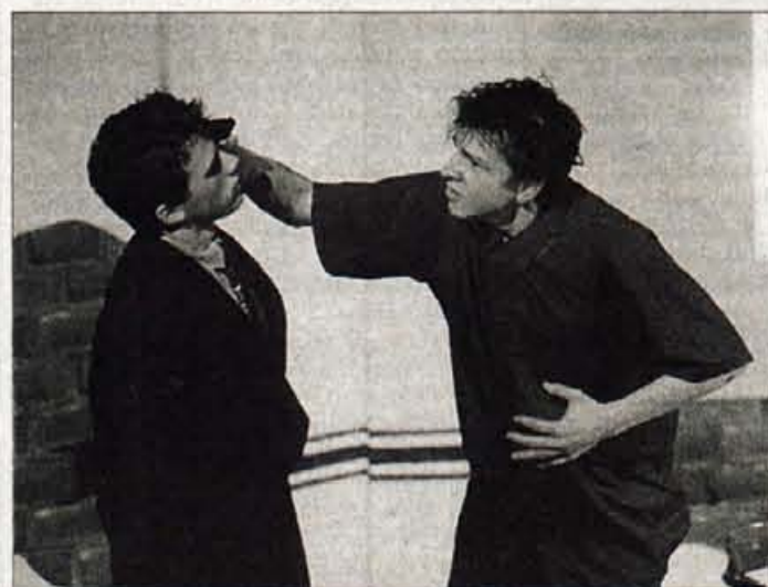
Brata pred končnim obračunom.