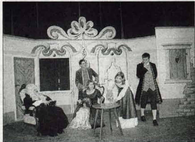
Utrinek z vaje za komedijo Priložnostni zdravnik.

Cerklje - V soboto, 17. februarja, ob 19.30 uri bodo člani gledališke sekcije pri kulturnem društvu Davorin Jenko Cerklje v dvorani Zadrugnega doma v Cerkljah premierno uprizorili Molierovo komedijo v treh slikah "Priložnostni zdravnik", ponovitev pa bo v nedeljo, 18. februarja, ob 18. uri. Prihodnjo soboto, 24. februarja, bodo ob 19. uri gostovali v Adergasu.