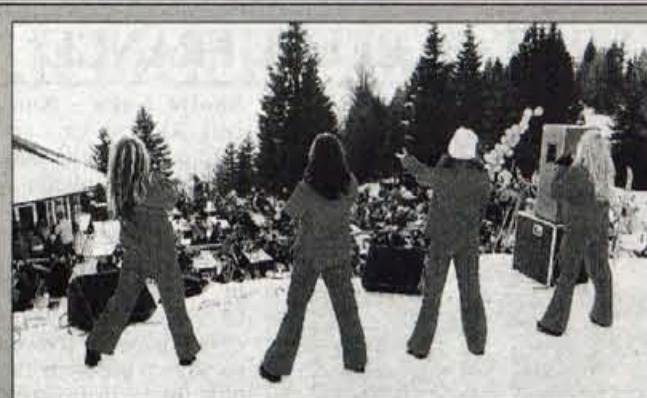
Veselo na Črnem vrhu - Holding Hidria iz Spodnje Idrije je priredil pretekli teden v smučarskem središču Črni vrh nad Cerknim srečanje zaposlenih v družbah holdinga, njihovih družinskih članov in upokojenecov. Igre so otvorili domžalski rogisti, tekmovalnemu delu (smučali so v veleslalomu) pa je sledil družabni, ki so ga popestrila dekleta iz skupine Power Dancers (na sliki). Vidimo se znova na naslednjih igrah in ob drugih družabnih priložnostih, je bilo sporočilo tokratnega srečanja. • J.K.

nov tolarjev) plačali iz letošnjega proračuna. Reciklažno dvorišče bo jugovzhodno od nekdanje deponije na Črnicu, odlagališče pa v smeri proti Grofiji na območju krajevne skupnosti Otok. Letos bi radi pridobili gradbeno dovoljenje za deponijo in uredili reciklažno dvorišče (lokacijski ogled je že bil), kar je pogoj, da bi se prihodnje leto izognili novi podražitvi odlaganja odpadkov na Malo Mežaklo. Izgradnja deponije jih bo stala okrog ene milijarde tolarjev, pri tem računajo na državno in celo mednarodno pomoč, razmislili pa bodo tudi o podelitvi koncesije. Novo deponijo so napovedali leta 2002, bolj realno se jim zdi leto 2003, a tudi za izpolnitev tega roka bodo potrebna velika prizadevanja. • C. Zaplotnik