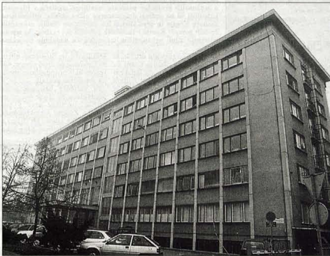
Begunski center v Šiški in Ljubljani. Okoliški stanovalci zahtevajo, da mora država v dveh mesecih prebežnike izseliti in center zapreti.

Kranjska Gora: do 40 cm naravnega in kompaktnega snega; Rogla: do 40 cm; Cerklje: do 50 cm; Soriška planina: do 35 cm snega.