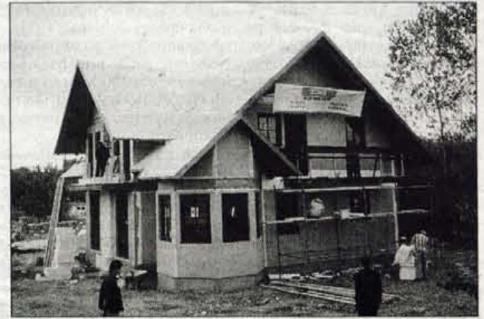
Pred vhomom v luksuzno naselje v Istanbulu Jelovica gradi vzorčno hišo.

Škofja Loka - Škofjeloška Jelovica v Istanbulu, pred vhomom v luksuzno stanovanjsko naselje Kemer Country, gradi svojo prvo vzorčno montažno hišo v Turčiji. Gre za evropski tip hiše, le določeni detajli so prilagojeni okusu turških kupcev. Hiša bo še ta mesec pripravljena za otvoritev, sporočajo iz Jelovice.