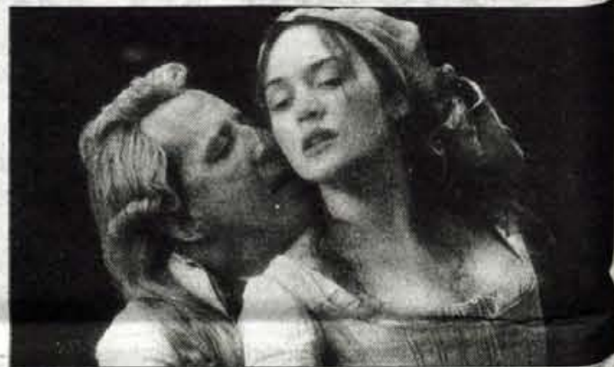
Markiz De Sade (Geoffrey Rush) in Madeleine (Kate Winslet) v filmu Škandalozno pero.

tuji film in najboljšo režijo, nominiran pa je tudi za več oscarjev, je zgodba o dveh ženskah časa dinastije Ching, ki obvladata borilne veščine. Film, katerem se mešajo številni žanri in filmske tehnike, zaznamujejo odlično koreografiranje in briljantno posneti borilni prizori. Na Kitajskem jedo pse, naslov danske drame, v kateri se mirno in urejeno življenje nekonskega para povsem spremeni, ko se mož znajde sredi pravega ropa v banki... Primerjava s Tarantinovim Šundom in Ritchijevem Pfjunt in jo stisni naključna. Na sporedu Filmskega gledališča bosta še dva filma in sicer drama Shine madžarskega režiserja