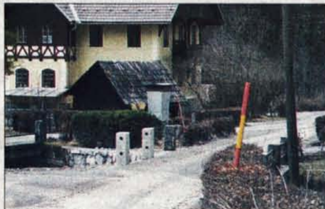
Lani so obnovili most prek Dovžanke in betonske stebre. So na ograjo pozabili?

Jelendol, 13. februarja - Lansko jesensko deževje je v trziški občini povzročilo za več kot 100 milijonov tolarjev škode, zaradi specifične lege pa je urejanje hudournikov v tej občini nikoli končano delo. Narasla voda je lani poškodovala tudi most v Jelendolu, na križišču za Medvodje.