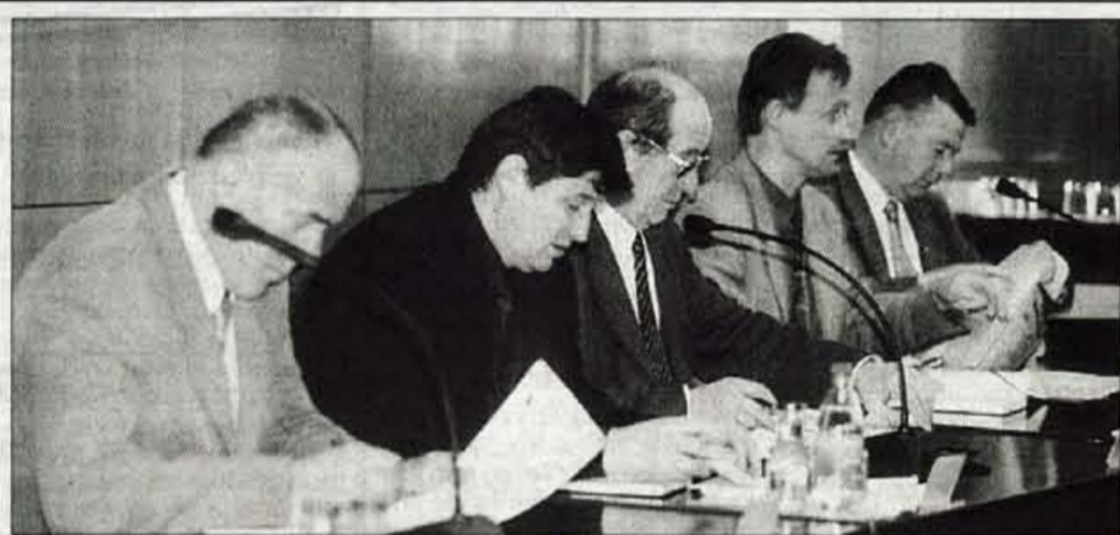
Kranj - Včeraj je v Kranju potekala tretja seja razvojnega sveta Regionalne razvojne agencije Gorenjske. Na njej so župani občin ustanovitelji območnih razvojnih organizacij obravnavali pogodbe o sofinanciranju regionalnega razvojnega programa. Šest pa so se tudi člani programskega odbora, ki je začel z delom. Sprejeli so poslovnik ter načrt priprave regionalnega razvojnega programa Gorenjske. • U. P.

Za družbo Tovil je komisija kot najugodnejšega ponudnika izbrala družbo TKG Ljubljana, kupec je kupnino plačal konec decembra. Projekt prodaje družbe Energetika Štore pa je v pripravi. • U. P.