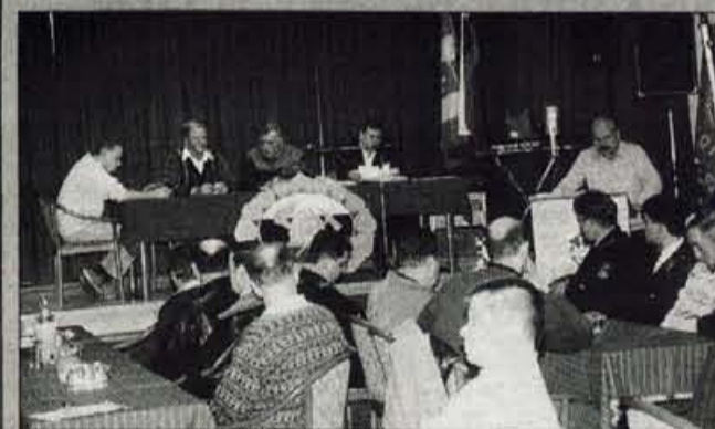
Križ, 13. februarja - Prostovoljno gasilsko društvo Križ je eno od treh gasilskih društev v občini Komenda, ki je na zadnjem občnem zboru ugotovilo, da so lanskim delovnim programom na izobraževalnem, tekmovalnem in drugih področjih uspešno uresničili. Največ težav imajo v društvu, ki ima več kot dvesto članov, pri predpisnem opremljanju. Sicer so vajeni različnih prostovoljnih akcij in zbiranja denarja z veselnicami, vendar so stroški za opremljanje preveliki. Ze nekaj časa pa imajo v programu tudi nabavo manjše avtocisterne. Na občnem zboru so podelili tudi priznanja za delo in napredovanje. • A. Ž.