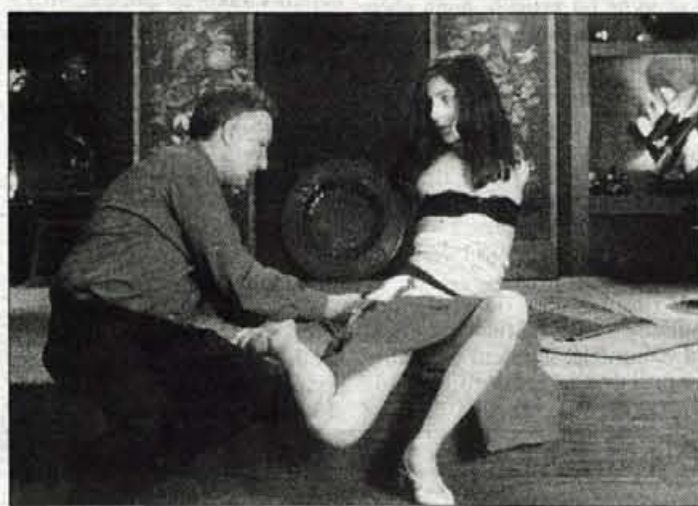
Francoska erotična drama Romanca - film, ki bo dvignil mnogo prahu.

Prvi film letošnjega pomladnega ciklusa Filmskega gledališča, ki ima v Kranju in še nekaterih kinematografih po Gorenjskem že dolgoletno tradicijo, bo ameriški psihološki triler Nezlomljivi režiserja M. Night Shyamalana (lani je posnel uspešnico Sesti Cut ). Nsrečo ob trčenju dveh vlakov preživi le en človek, igra ga Bruce Willis, in ko se ta sprašuje o pomenu tega, kar se mu je zgodilo, ga obišče skrivnostni tujec, igra ga Samuel L. Jackson, ki ima redko dedno bolezen krških kosti. Film je poglobljena drama, ki se spogleduje z nadnaravnimi silami, usodo, strahovi in pogumom povprečnega človeka. Vrstni red za filme, ki bodo sledili v naslednjih tednih, še ni dokončen, seveda pa gre za žanrsko zelo različne filme iz različnih delov sveta. Ameriško-italijansko-francoska koprodukcija je romantična komedija Hitra hrana, hitre ženske (film smo videli tudi na lanskoletnem LIFE-u). Glavni junakinji, 35-letni neporočeni natakariči z občasnim ljubim-