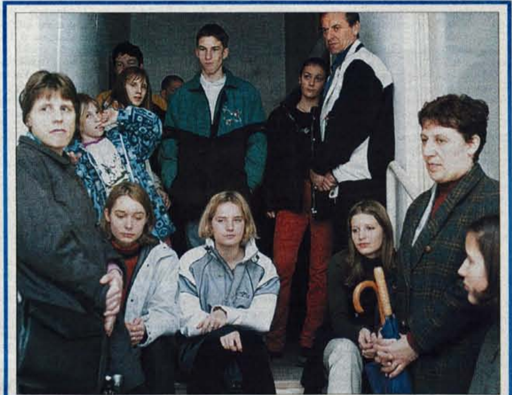
Kranj, 13. februarja - Minuli konec tedna so srednje šole in visokošolske ustanove odprle vrata za generacije, ki se odločajo, kje se bodo šolale v prihodnjem šolskem letu. Osmošolci so se razgledovali po srednjih šolah, kamor se morajo prijaviti v začetku marca, srednješolci pa so se na petkovem in sobotnem informativnem dnevu zanimali za možnosti študija na višjih in visokih šolah ter na fakultetah. Zlasti v petek dopoldne, ko so imeli osmošolci in četrtošolci šole prost dan, je bila povsod velika gneča. Za srednje šole se letos na Gorenjskem zanima nekaj več kot 2300 osmošolcev in kar dve petini med njimi si je ob prvi nameri izbralo gimnazije, tretjina štiri-letne srednje šole in niti petina poklicne šole. Na sliki: osmošolci so skupaj s starši prisluhnili informacijam o šolanju.