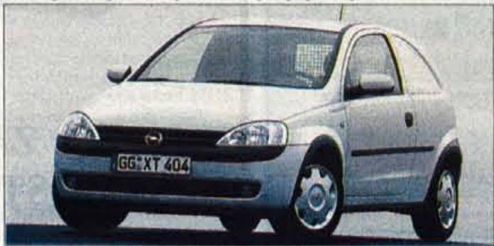
Opel Corsa Van

NOVE OBLIKE FINANCIRANJA - Sredi lanskega leta ustanovljena finančna družba GMAC (General Motors Acceptance Corporation) je ustanovila tudi slovensko podružnico, ki bo odlej skrbela za različne oblike financiranja Oplovih vozil. Ponujali bodo leasing, kredit in zavarovanje vozil, poleg tega pa bo s financiranjem pomagal tudi 25 slovenskim Oplovim trgovcem. Med najpomembnejšimi prednostmi navajajo financiranje vseh stroškov, ureditev vseh formalnosti in izdajo avtomobila v enem dnevu, obračunsko valuto euro, fiksno obrestno mero ter prilagodljivo dolžino odplačevanja in višino obrokov.