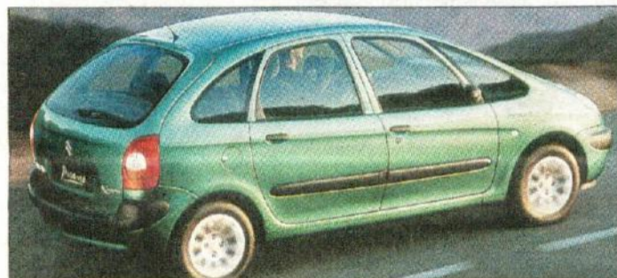
Citroen xsara picasso v razred kompaktnih enoprostorcev vnaša oblikovalsko svežino

posebnež audi A2, ki se bo postavil ob bok mercedes-benzu razreda A. Manjši in cenejši bo nov Opel mali avtomobil agi-