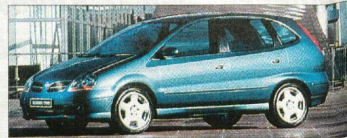
Nissan almera tino bo prišel s precejšnjo zamudo, a se ne bo stopil v sivem povprečju nižjega srednjega razreda

Z naštetimi novostmi, ki bodo vsekakor pomembno zaznamovale letošnje leto, pa novih avtomobilov seveda še zdaleč ni konec. Letos bo očitno tudi leto avtomobilov "zgoraj brez": tak bo novi BMW-jev kabriolet serije 3, ki bo pri nas naprodaj tik pred poletjem, mesec ali dva za