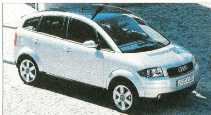
Audi A2: ingolstadtski (aluminijasti) odgovor uspešnemu stuttgartschemu baby benz

polo, najbolj pa je pred nekaj dnevi razred majhnih avtomobilov razburkal povsem novi fiat punto. S tem pa bitke v tej kategoriji še ni konec; že marca ali aprila se bo vanjo vključila Škodina novinka fabia, kasneje pa še nova Opelova corsa. Do poletja pride k nam še aluminijasti