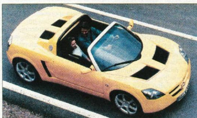
Opel speedster je vznemirljiv športnik, ki naj bi ugajal predvsem mladim voznikom

jega prvenca in konec prve polovice bo pri nas naprodaj astra coupe, medtem, ko bo Hyundai jeseni največ pozornosti namenil novi lantri precej večja pa bo gneča med kompaktnimi enoprostorskimi avtomobili. Že februarja bo Citroen pripeljal vznemirljivo oblikovano xsara