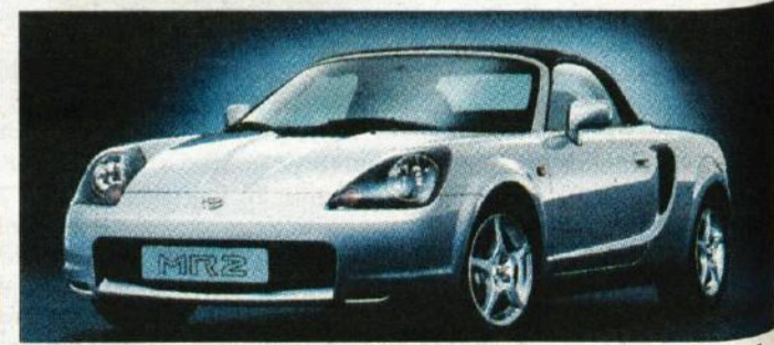
Toyota MR-2 je mladostni športnik, sicer pa le ena izmed številnih novosti te japonske avtomobilске tovarne

njim pa iz iste tovarne pride še vznemirljivi roadster Z8. Adrenalin bosta od poletja dalje dvigovala tudi peugeot 206 kabriolet in opelov roadster z imenom