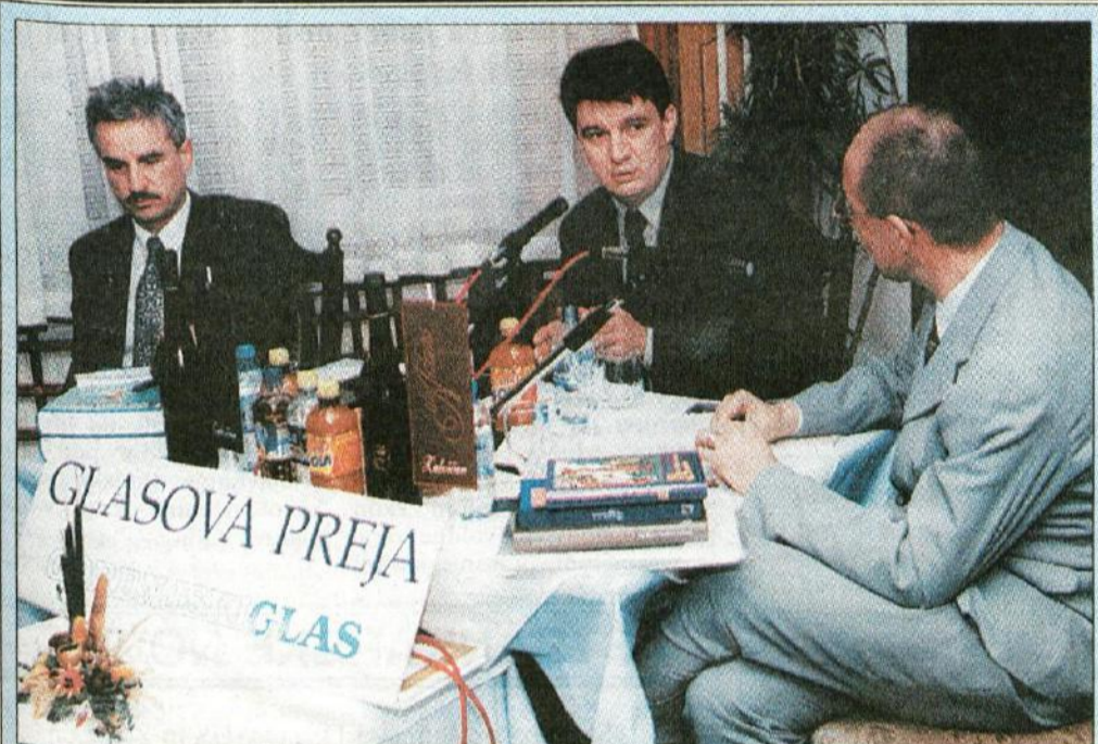
Prva letošnja Glasova preja