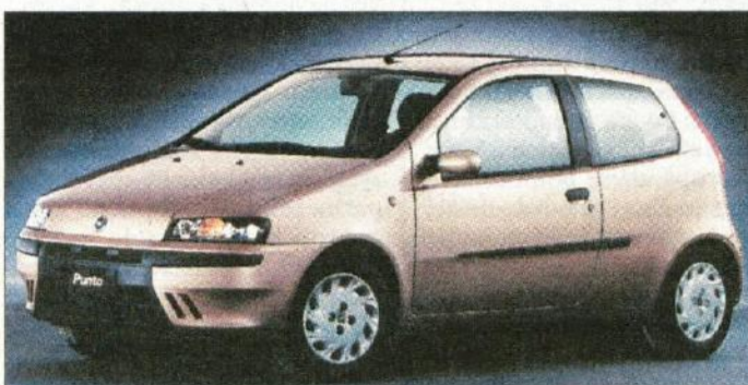
Novi fiat punto pomeni prelomnico za italijansko tovarno in bo nadaljeval uspešno pot svojega predhodnika.

V najbolj množičnem spodnjem srednjem razredu letos ne bo veliko pravih pravih novosti. Španski Seat bo spomladi razgrel kupce s temperamentnim leonom, Opel bo obogatil karoserijsko in motorno paleto svo-