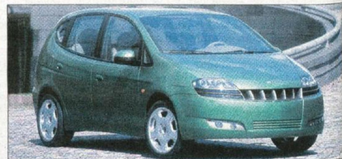
Daewoo vstopa v razred kompaktnih enoprostorcev, njihovo orožje se imenuje tacuma

novi audi A4, skoraj zagotovo pa podaljšani volkswagen passat plus. Med jesenskimi novostmi bo tudi Renaultov posebnost avantime, mešanec med limuzino, luksuznim kupejem in enoprostorcem. Za popestritev pridejo vmes še nekatere dodelave: pri Alfa Romeo naj bi sredi