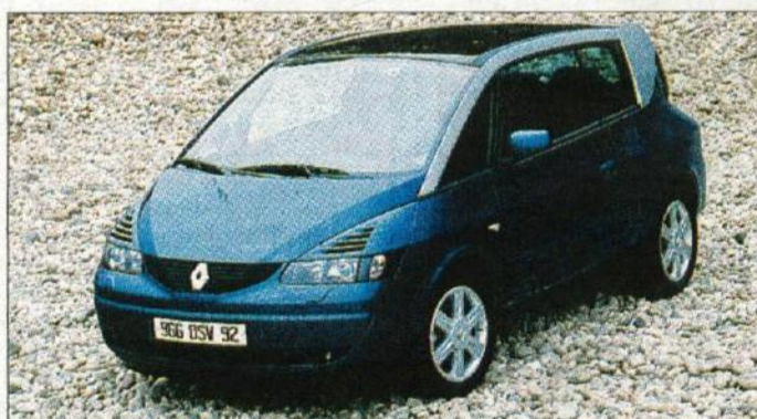
Renault avantime je posebnost, ki zanesljivo nakazuje razvoj novih avtomobilskih razredov