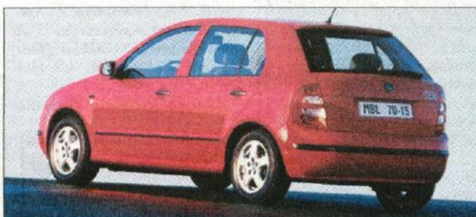
Skoda fabia se bo skušala preriniti med sama zveneča imena, a ima najbrž veliko adutov za uspeh