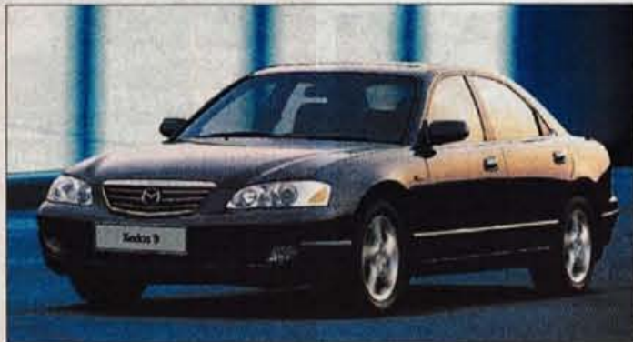
nova pa so tudi 16-palčna aluminijasta platišča s prtimi kraki.

Mazdin zastavonoša ima po novem značilno masko, kakršno so že naredili vsem drugim modelom, žarometi so namesto običajnih dobili ločeno optiko, popravljen sta oba odbijača,