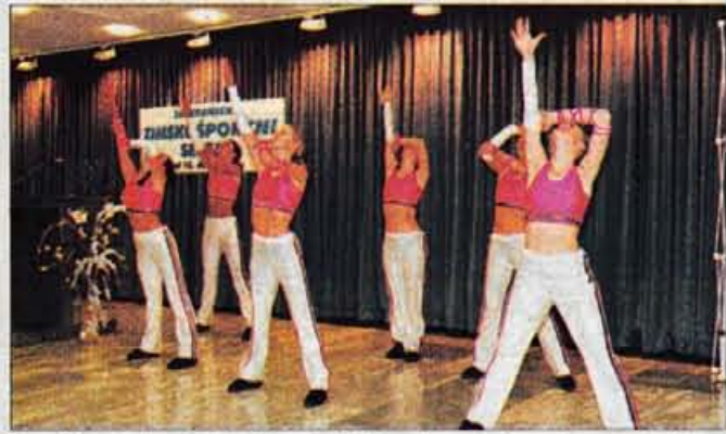
Letošnji začetek 26. zimskošportnega sejma je popestrila tudi plesna skupina Tačke.

Kranj, 20. novembra - Na razstavišču Gorenjskega sejma v Kranju so sinoči zaprli 26. zimsko športni sejem, ki sta ga letos organizirala Zbor učiteljev in trenerjev smučanja in Gorenjski sejem. Specializirana sejemska prireditev, ki so jo pred petindvajsetimi leti začeli vaditelji, učitelji in trenerji smučanja in je bila nekaj časa na začetku v Delavskem domu Kranju, je zadnja leta, vse bolj obiskana in zanimiva.