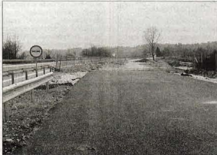
Nadaljevanje bo prihodnje leto proti Podtaboru.

Kot rečeno se v tem desetletju Gorenjski obeta živahno gradbeno dogajanje na avtocestnem področju. Po izgradnji sedanjega odseka se bodo dela nadaljevala proti Podtaboru. Celotna trasa na 4,3 kilometra dol-