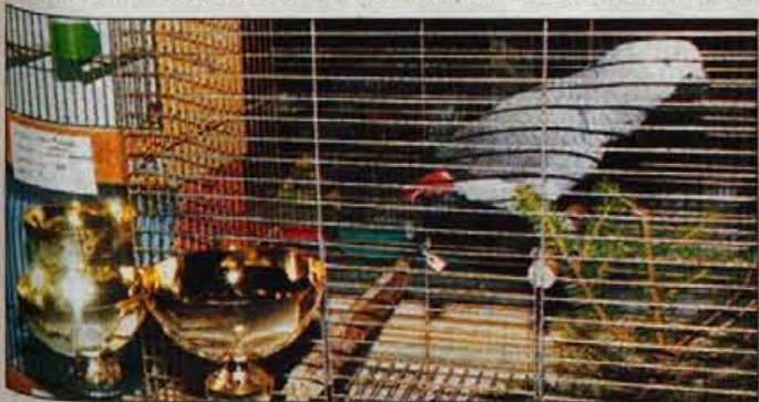
Šampion Pero, afriška papiga Sivi Zako.

ja že 14, uspelo pa mu je vzgojiti že kar nekaj vrst afriških papig in drugih redkih ptic. Sivi Zako je papiga, ki je med vsemi najbolj občutljiva in jo je moč naučiti tudi največ besed, stavkov ali pesmi. Živi pa okrog sto let. Od pod posebnosti je, da se v stanovanju izredno naveže na enega od članov družine. Če se zgodi, da ostane nekaj časa sama, recimo zaradi odhoda družine na dopust, zaradi osamljenosti zgubi perje. Cirilu pa je uspelo, da je takšne papige "pozdravil", da so se ponovno obrasle s perjem. • A. Ž.