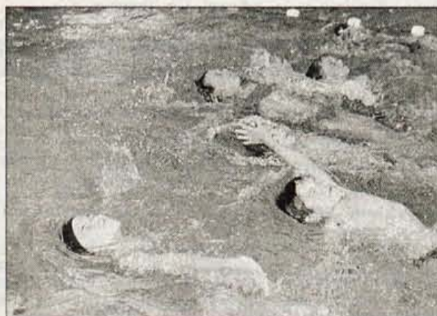
Že v plavalni šoli so otroci zelo tekmovali.

50 m delfin (M4, W4) 100 m delfin (M1, M2, M3, W1, W2, W3) 50 m hrbtno (M4, W4) 100 m hrbtno (M1, M2, M3, W1, W2, W3) 100 m hrbtno (M1, M2, M3, W1, W2, W3) 100 m prosto (M1, M2, M3, M4, W1, W2, W3, W4) 200 m mešano (W1, W2, W3, M1, M2, M3) 800 m prosto (M1, M2, M3, W1, W2, W3) 50 m prsno (M4, W4) 100 m prsno (M1, M2, M3, W1, W2, W3) 50 m prosto (M4, W4).