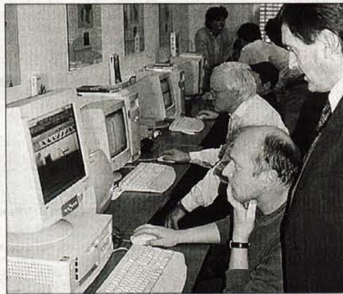
V prostoru, kjer so nekdanj samoupravljali, se bodo poslej učili.

opremo za samostojno učenje. S središču se bodo izobraževali in usposabljali vodilni, strokovnjaki in zaposleni, ki se izobražujejo ob delu, na voljo bo tudi štipendistom. Tam bodo potekali tudi različni tečaji, seminarji, delavnice itd. Vsak mesec sproti bodo sestavili urnik, na razpolago pa bo od 12. do 17. ure. Na razpolago bo tudi drugim podjetjem slovenske obutvene industrije. • M.V.