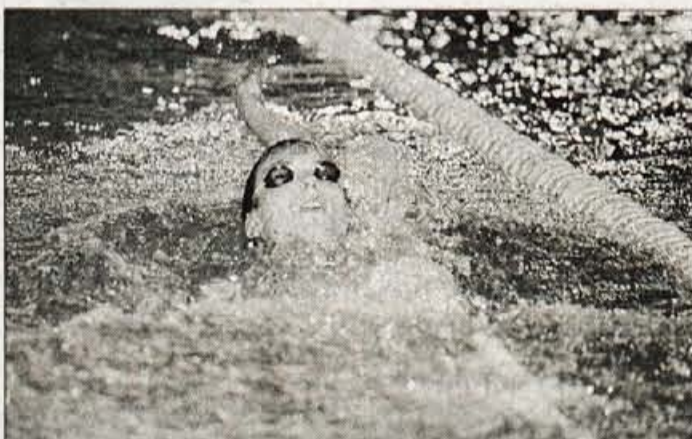
Tekmovalci v hrbtnem slogu.

Več kot polovica sodelujočih na sobotnem tekmovanju prihaja iz 17 slovenskih plavalnih klubov. Ostali tekmovalci so iz naslednjih držav: Bosna in Hercegovina, Češka, Jugoslavija in Liechtenstein, ki sodelujejo s tekmovalci iz po enega kluba, Hrvaška, od koder prihajajo tekmovalci iz petih plavalnih klubov, Madžarska s tekmovalci iz štirih klubov in Italija s tekmovalci iz dveh plavalnih klubov.