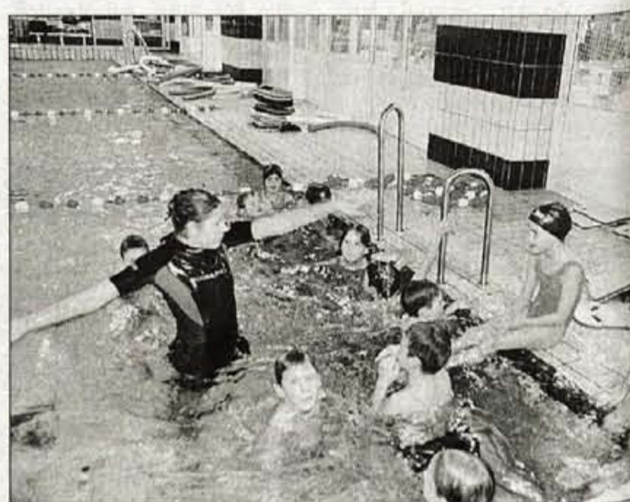
Najmlajši se takole učijo, kako postati pravi plavalci.

Olimpijske kolajne plavalci kranjskega kluba sicer še nimajo, ob obetavnih mladih upih pa morda v prihodnosti lahko upamo nanjo. Pot do odličja na olimpijskih igrah pa je dolga in