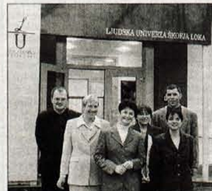
Ekipa Ljudske univerze Škofja Loka

Pridobili so štiri učilnice in dve večji predavalnici - Uprava in del prostorov še naprej v šolskem centru