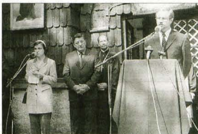
Vsako zadnje julijsko nedeljo poteka ob ruski kapelici na Vršču spominska slovesnost, ki se jo udeležijo predstavniki slovenske države, ruski prijatelji in številni domačini.

Vladimir Lukin, podpredsednik državne Dume, se je med drugim zahvalil domačinom, da tako spoštljivo ohranjajo spomin na številne ujetnike - ne le ruske, kajti na Vršču je tedaj umirala vsa Evropa - ki so žrtvali svoje življenje. Dogodek je spomin in opomin, da se grozote vojne ne bi smele nikoli več ponoviti. Z nasiljem se ne da izkoreniniti nasilja. Počastitev spomina je že nekaj let tudi priložnost, da se slovenski predstavniki srečajo z ruskimi prijatelji, da se sodelovanje krepi, tudi na gospodarskem področju. Zdaj se dogovarjajo, da bodo prav tu, v kranjskogorski občini, v prihodnje potekali seminarji in konference.