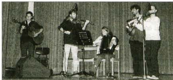
Glasbeniki osmih držav so z ljudskimi pesmimi 11 držav navdušili trziško občinstvo.