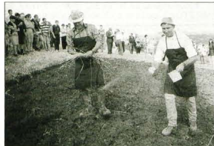
Repo so sejali, zraven pa debelo lagali.

Po opravljeni žetvi so bila prikazana še ostala opravila, ki so bila nekdanji sestavni del nastajanja pravega in okusnega domačega kruha - obkladanje snopov v štante, mlatev s cepci,