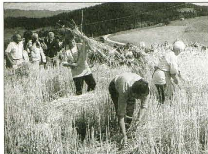
Rž so poželi še pred točo.

Žirovski vrh, 1. avgusta - Tudi tretja etnografska prireditev Praznik žetve na Žirovskem vrhu, ki vsakič poteka na kmetiji na Javorču, je minulo nedeljo popoldne privabila številne obiskovalce. Laična ocena je bila, da se na Javorču zbere vsako leto več ljudi, kar potrjuje, da so take prireditve zanimive in dobrodošle. Prikaz tradicionalnih kmečkih opravil namreč ni privabil le okoliških ljudi, ampak so se v Poljansko dolino pripeljali tudi številni, lahko bi rekli - mestni ljudje.