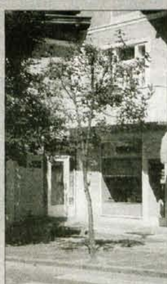
Eno od posušenih dreves.

Dve drevesi pa naj bi komunalna služba tudi požagala. Seveda smo se odločili preveriti ozadje zadeve. Komunalna služba je res odstranila dva suha javora, ker je bilo to potrebno, seveda pa poudarjajo, da v okolje in prostor ne posegajo samovoljno, pač pa le z dovoljenjem posebne komisije. Občina na Bledu ima namreč posebno komisijo, ki obravnava vse posege v okolje in prostor in točno določa tudi postopke in načine teh posegov. Torej lahko zaskrbljene bralke in bralce pomirimo, da ni bojazni, da bi se na Bledu odstranila okrasna drevesa, če za to ne obstaja tehten razlog. Seveda pa se drevesa lahko nasadijo na novo in lahko smo prepričani, da bo občina, s pristojnimi službami, znala poskrbeti za dostojno podobo tega turističnega bisera tudi v prihodnje. Uslužbenec komunale je na