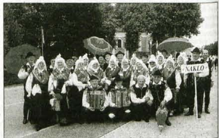
Gasilska: FS Društva upokojencev Naklo