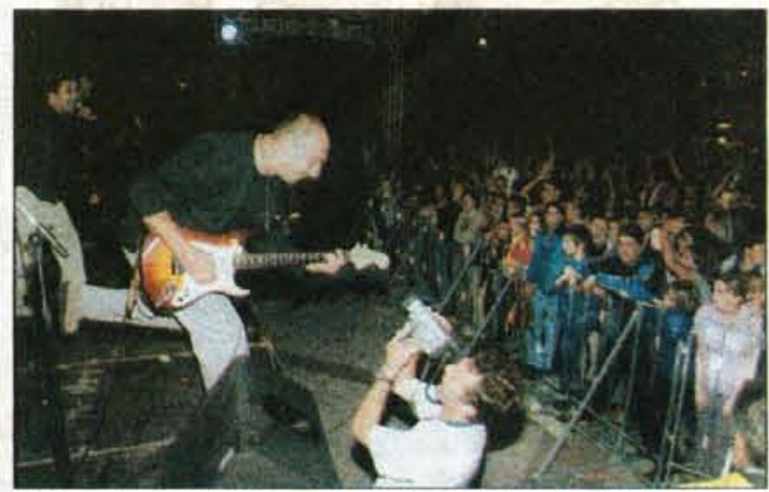
Dež, ognjemet in California so sklenili letošnjo najdaljšo Kranjsko noč

Tudi sobotna vremenska napoved ni bila preveč blesteča, a ste vsi, ki vas je ta dan gostila Kranjska noč, napravili še en zadetek