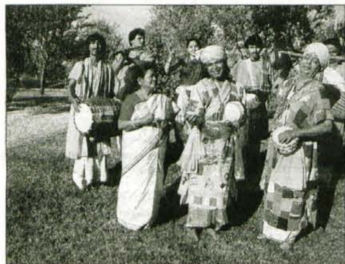
The Balus Of Bengal iz Indije bodo nastopili prvi večer, v petek, 4. avgusta.

Kljub temu da je nekdanji Okarina folk festival z letošnjim letom dobil novo ime in podobo, njegova vsebina ostaja zvesta desetletni tradiciji. Že je končan prvi del Glasbenega festivala brez meja 2000, ki je potekal sredi julija v sosednjem Trbižu. V Celovcu bo ta potekal konec avgusta, v vikendu, ki je pred nami, pa bomo glasbenike iz različnih koncev sveta gostili na Bledu.