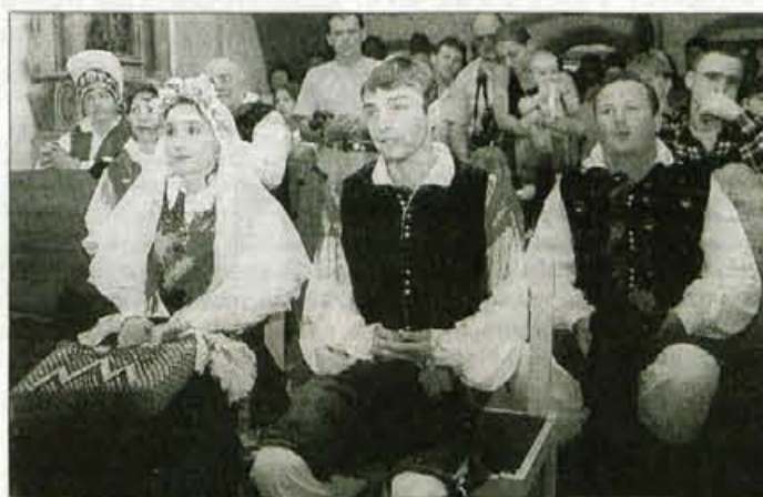
Srednje vasi in Kulturnega Svatje in obiskovalci so se nato veselili ob zvokih Kvinteta društva Bohinj iz Bistrice.

več bohinja kmečka ohceta. V nedeljo se je dogajanje začelo ob enih popoldne z ženitno povorko s kmečkimi vozovi - letos jih je bilo kar trinajst - do Agotneka v Stari Fužini, kjer je ženina že nestrpno čakala nevesta. Na kopaljšču je bila seveda šranga, nato pa cerkvena poroka v cerkvi sv. Janeza. Osrednje dogajanje pa je bilo Pod skalco, kjer so nastopili folkloristi KUD Triglav iz