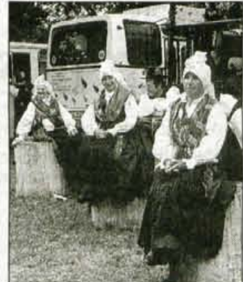
Naklanske folkloristke so si pred plesom raje vzele čas za počitek.

upokojenskih, plesali smo splet starih, še neobjavljenih plesov, zanimivo pa je bilo tudi to, da so naše ženske tokrat nastopile s pečami na glavah in v zavijačkah, kot prej," je povedal Andrej Košič, ki je bil letos na beltiškem festivalu že sedemnajstič, in hkrati dodal: "Ta nastop je bil naš najpomembnejši doslej. Pred štirimi leti, ko smo ustanovili folklorno skupino, si