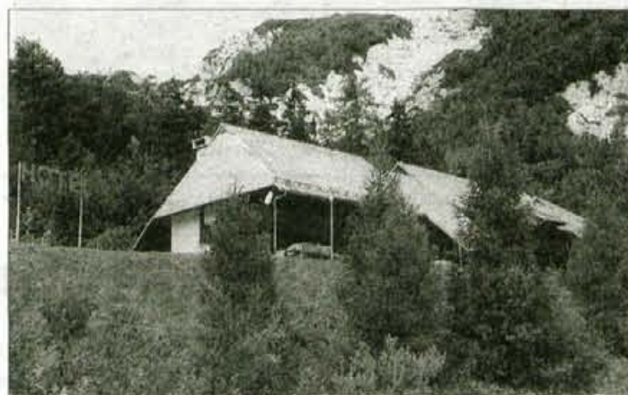
Kompasov hotel je potreben temeljite obnove, smučišče Zelenica pa oddajajo v dvajsetletni brezplačni najem.

Ljubelj, 1. avgusta - Bližina meje, neokrajena narava in izhodišče številnim izletniškim ter planinskim potem v ljubeljskem primeru ne zadoščajo. Niti smučišče Zelenica, niti Kompasov hotel. Oba je že zdavnaj povozil čas, saj so žičniške naprave zastarele, hotel pa s svojo opremo in ponudbo ne zadošča današnjim potrebam gostov. Tisto, kar je zadoščalo pred tremi desetletji, ko so hotel zgradili, je danes primerno le še za šolski turizem, kamor spadajo šolski izleti, zimovanja in raziskovalni tabori. In namesto da bi turizem na Ljubelju polnil občinsko blagajno, jo zadnja leta prazni.