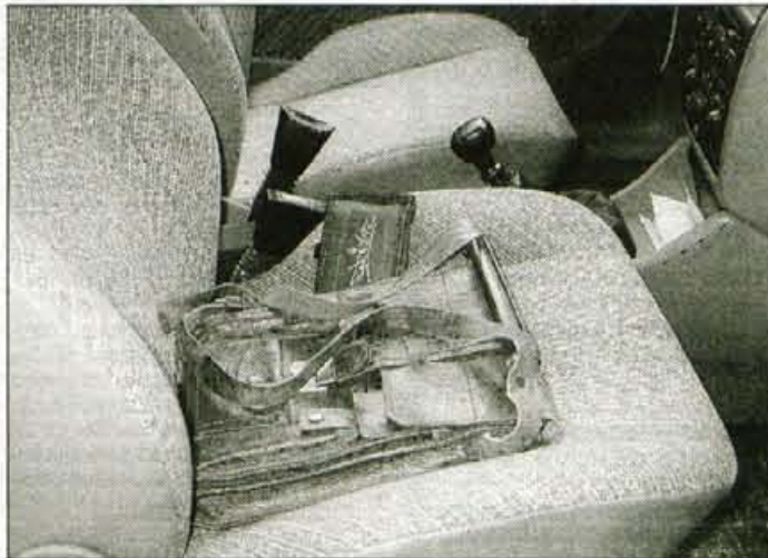
Denarnica in torbica ne puščajte v avtomobilu.

Na Bledu sta nekaj noči nazaj mlajša mladoletnika z Jese-