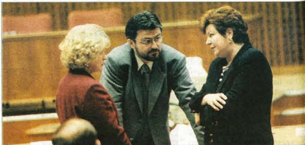
V državnem zboru se ta teden začnejo poslanske počitnice. Med njimi bodo začeli temeljito obnavljati osrednjo dvorano.

Kljub videzu neučinkovitosti in zgubljanju v prepirih je bil naš državni zbor v zimskem in spomladanskem obdobju učinkovit. Bil pa bi še bolj, če ne bi bilo zastoja zaradi glasovanja o novem mandatarju in vladi. Predsednik državnega zbora Janez Podobnik je pretekli petek,