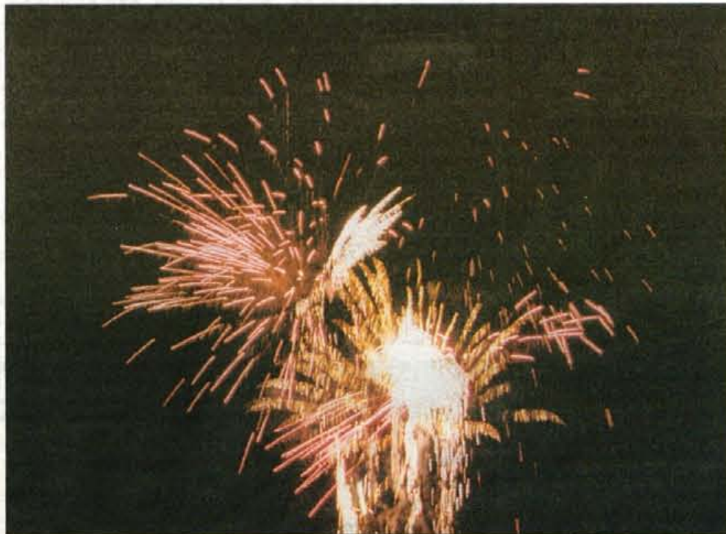
S KIK Kemijsko industrijo Kamnik smo na Globusu "našli" lokacijo za bodoče Kranjske ognjemete

jev Slovenije. Osrednji del mesta z Maistrovim trgom je bil tisti prehod, ki je skušal del obiskovalcev zadržati zaradi ponudbe in programa in hkrati delovati kot povabilo na obisk Glavnega trga z vodnjakom. Program na Glavnem trgu pa je bil seveda nasprotje tistemu na Slovenskem trgu. Domačinom in še komu namreč ni toliko za estradne skupine in hite, ki jim mladi še kako pritrjujejo. Marsikomu prija tudi narodna, zabavna in predvsem bolj umirjena glasba.