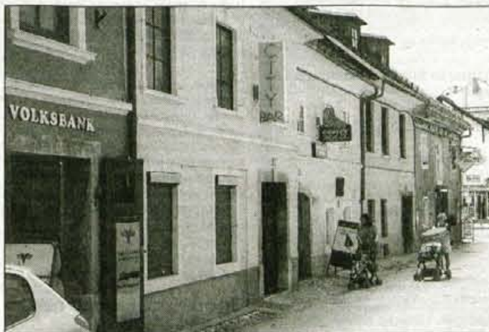
Pretepeali so se pred City barom.