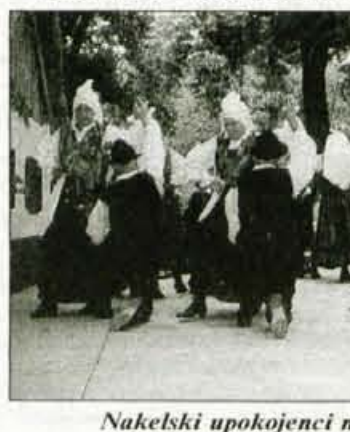
Naklanski upokojenci na odru, ko je šlo zares.