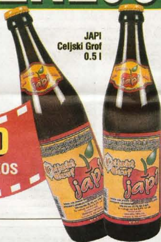
JAPI Celjski Grof 0.5 l