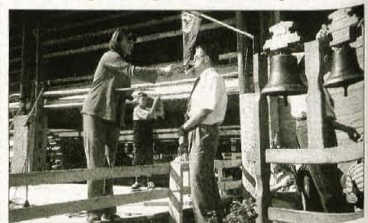
Nastopili so tudi Vrhnjski pritrkovalci.

Na nedavni prireditvi se je zbralo kar ducat skupin, ki so nastopile pod naslovom Pojemo in godemo v Vinharjih.