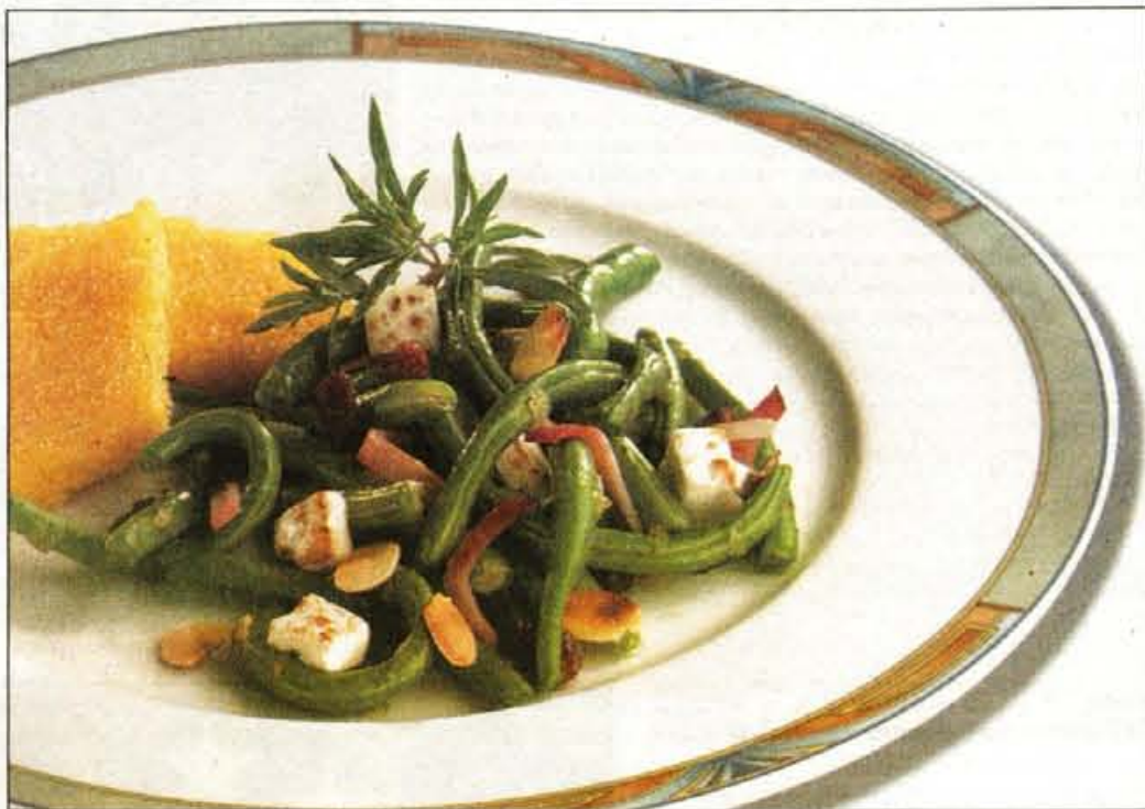
Stročji fižol z noto

kot je omake pri golažu. Že gotovo jedi dodamo smetano.