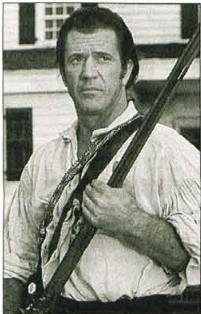
Mel Gibson, tokrat bojevnik za ameriško neodvisnost.

Kranj - S premierno predstavo v četrtek, 27. julija, v kinu Center v Kranju je tudi v gorenjske kinematografe prišel dolgo pričakovani ameriški film Patriot. Mel Gibson v glavni vlogi.