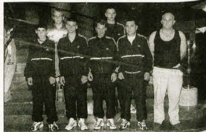
Slovenski boksarji na stopnišču hotela v Atenah.