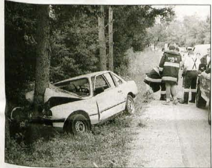
BMW je silovito trčil v drevo.

Ko je pripeljal iz delno preglednega desnega ovinka na krajšo ravnino, v neposredno bližino mostu čez Savo Dolinko, je nenadoma zavil desno na makadamsko bankino, nato pa z des-