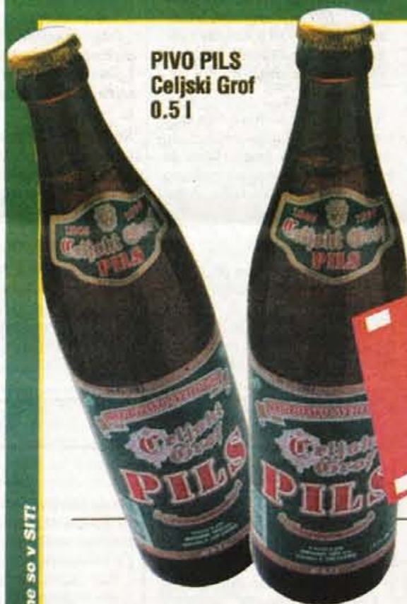
PIVO PILS Celjski Grof 0.5 l