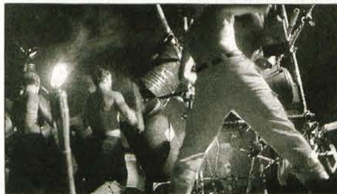
Na zaključni prireditvi Kiselfesta 400 obiskovalcev: koncert skupine The stroj