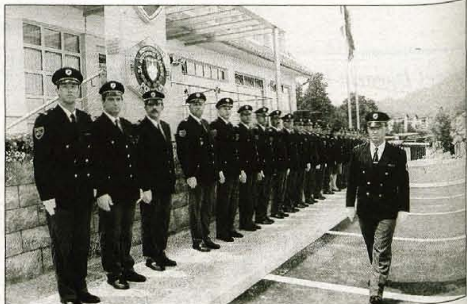
Z otvoritve...