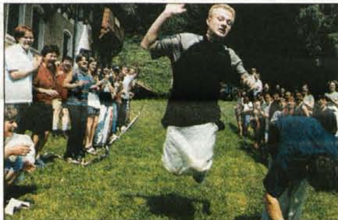
Vaške igre so privabile prebivalce Jelendola in Jezerškega.