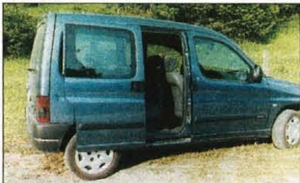
Lanska novost: dodatna bočna drsna vrata, ki omogočajo lažji vstop v zadnji del potniške kabine.