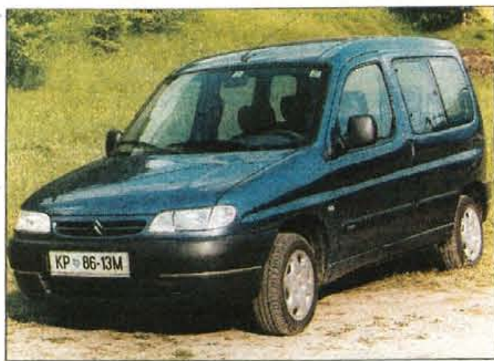
Berlingo združuje dovolj uglajeno obliko z izjemno prilagodljivostjo in uporabnostjo, zato je priljubljeno prevozno sredstvo številnih družin in podjetij.

Ampak zato se berlingo izdatno oddolži z velikim prtljažnim prostorom, ki je že v osnovi tolikšen, da zmore