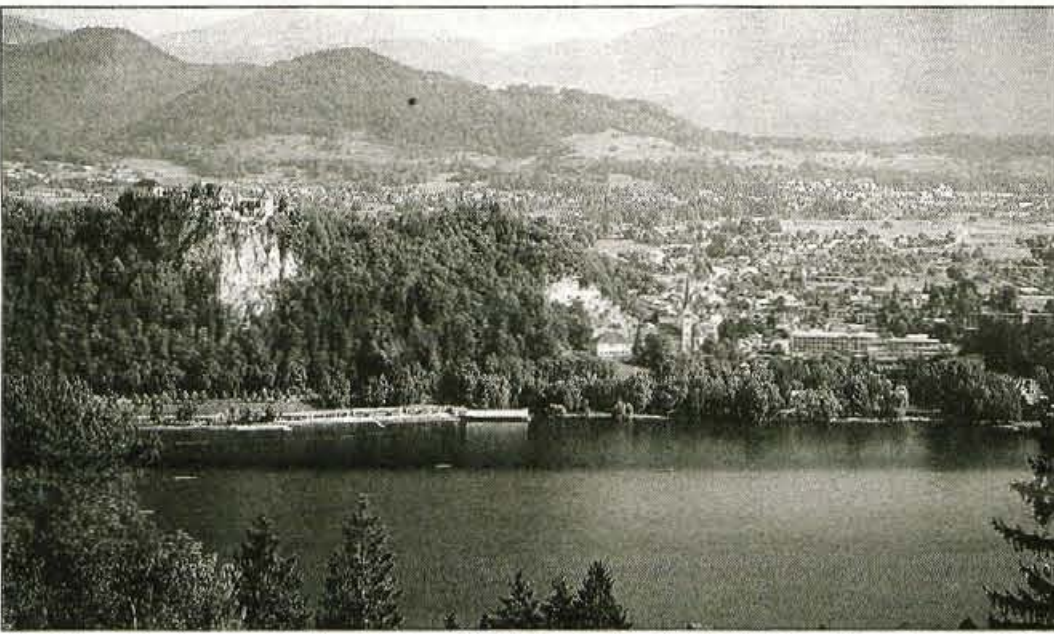
Zavod za zdravstveno varstvo Kranj po opravljenih meritvah ugotavlja, da je kvaliteta vode v Blejskem jezeru celo boljša kot v Bohinjskem...

Zavod še opozarja, da vodo z neustreznimi izvodi ogroža zdravje ljudi. Pitje take vode povzroči okužbo s povzročitelji črevesnih nalezljivih bolezni, ki se kažejo z naslednjimi znaki: zvišana telesna temperatura, bruhanje, driska in bolečine v trebuhu. Posebej pa kopanje v taki vodi ogroža zdravje otrok, ker so otroci bolj dovzetni za okužbe in med kopanjem nenamerno popijejo več vode kot odrasli. Zato odsvetujejo kopanje otrok v onesnaženih gorenjskih rekah. Slaba mikrobiološka in kemijska kvaliteta gorenjskih rek je posledica vpliva neочиščenih odpadnih vod - iztokov kanalizacije. • D.Sedej