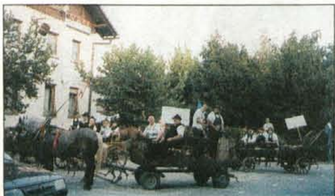
Vesela družina se je še pred mrakom s potujočo kovačijo in "krompirjem" vozom vrnila v Naklo, kamor so konjički priškrbļjali iz Preddvora.