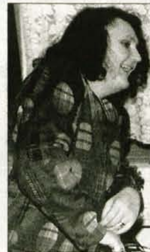
PREJ 88 kg

POKLIČITE KOZMETIČNI STUDIO ŠE DANES IN PRESENEČENI BOSTE NAD REZULTATI!