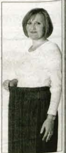
POTEM 70 kg

Pomladimo se v Kozmetičnem studiu KSENJA