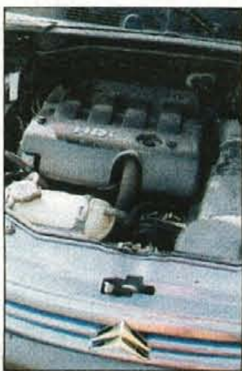
Sodobni turbodizel HDi za lahkotno vožnjo, dobre zmogljivosti in solidno ekonomičnost.

Predvsem pa pri odločitvi, da bo postal družinski član, glavno vlogo igra njegova uporabnost; s turbodizelskim motorjem in primerno opremo je prav lahko vse v enem in eden za vse. • M. Gregorič