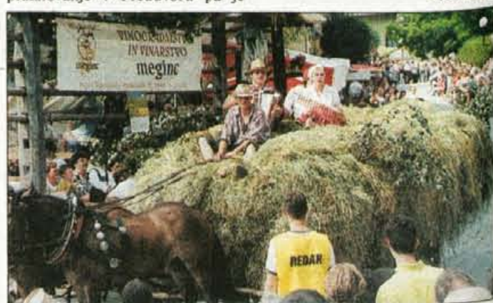
Konjeniško društvo Krvavec je pripravilo lojtnik naložen s senom