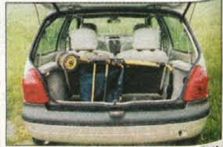
Majhen prtljažnik se pri dveh potnikih lahko poveča s pomočjo polovično deljive in vzdolžno pomične klopi.