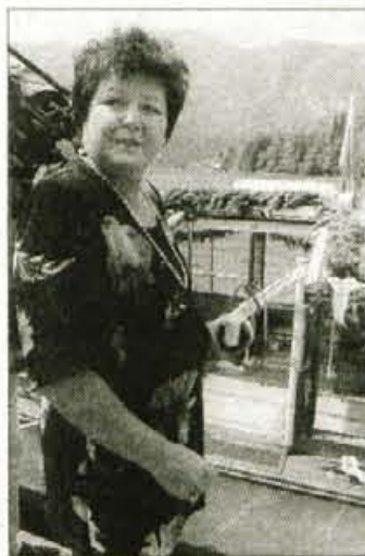
Botra čolna - poslanka Darja Lavtižar Bebler