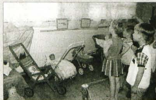
Deklice pri punčkah in vozičkih...