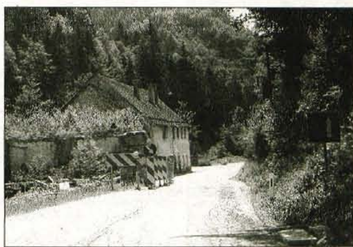
Zapora v Kokri.