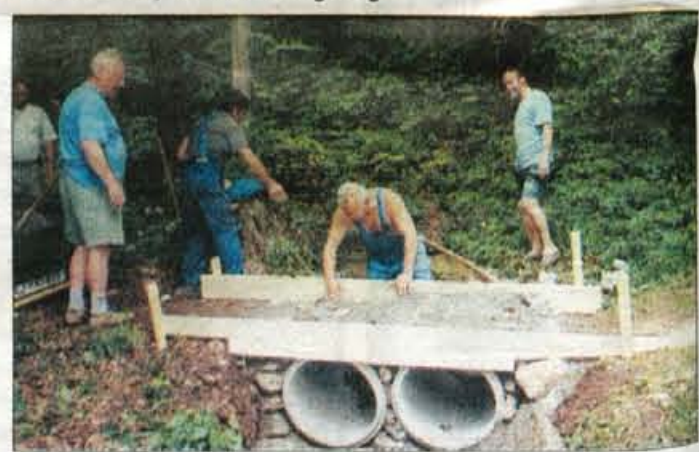
V soboto so zgradili most čez Štefanovev studenec.

V petkovi in sobotni akciji pripravljalnih del na srečanje, ki bo 24. junija, glavni pokrovitelj bo občina Vodice, glavni medijski sponzor pa bo Go-