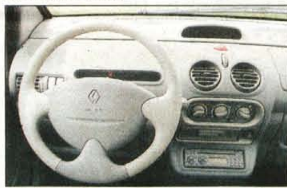
Usnje na volanu, sicer pa na instrumentni plošči nič novega, še vedno manjka merilnik vrtljajev.

TEHNIČNI PODATKI vozilo: kombilim., 3 vrata, 4 sedeži mere: d. 3,435, š. 1,630, v. 1,420 m medosna razdalja: 2,345 m prostornina prtljažnika: 170/1095 l motor: bencinski, štirivaljni gibna prostornina: 1149 ccm moč: 44/60 KM pri 5200 v/min navor: 93 Nm pri 2500 v/min najvišja hitrost: 150 km/h pospešek od 0 do 100 km/h: 13,4 s poraba EU norm.: 5,1/7,5 l/100 km maloprodajna cena: 2.446.500 SIT zastopnik: Revoz, Novo mesto