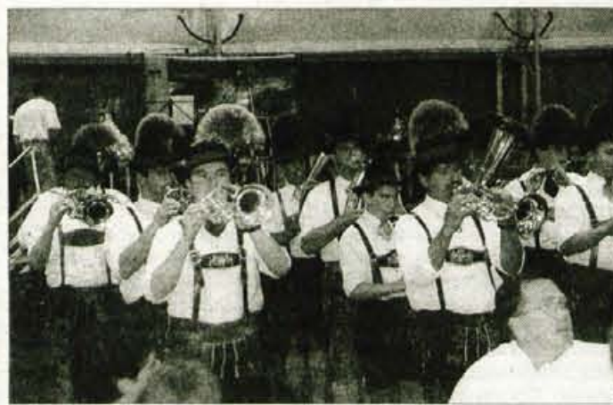
Slovensko bavarski večer - godba iz Ramsaua.