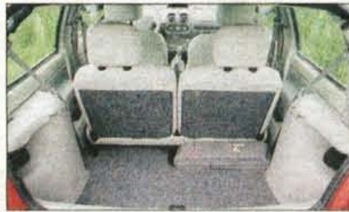
Svetlo usnje na sedežih je barvno usklajeno s celotno notranjostjo, tudi tako twingo initiale dokazuje svojo odraslost.

TEHNIČNI PODATKI vozilo: kombilim., 3 vrata, 4 sedeži mere: d. 3,435, š. 1,630, v. 1,420 m medosna razdalja: 2,345 m prostornina prtljažnika: 170/1095 l motor: bencinski, štirivaljni gibna prostornina: 1149 ccm moč: 44/60 KM pri 5200 v/min navor: 93 Nm pri 2500 v/min najvišja hitrost: 150 km/h pospešek od 0 do 100 km/h: 13,4 s poraba EU norm.: 5,1/7,5 l/100 km maloprodajna cena: 2.446.500 SIT zastopnik: Revoz, Novo mesto