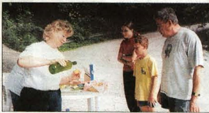
Na cilju je v nedeljo vsak dobil še okrepčilo.

So se pa tokrat člani organizacijskega odbora Turističnega društva s prireditvijo Vsi na trim še posebej izkazali, saj je vsak pohodnik dobil značko in okrepči-