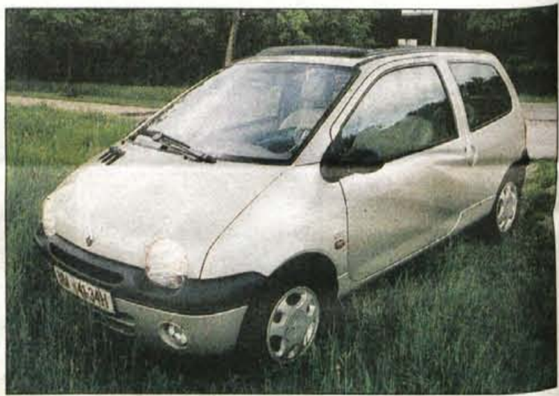
Twingo initiale od skromnejših bratov loči prestižna opalna barva, v notranjosti pa vrhunska oprema.

Ali bi za avtomobil, ki v dolžino meri manj kot tri metre in pol odšteli skoraj poltretji milijon? Velika večina bi najbrž odločno odkimala, nekateri pa bi v takšni naložbi vseeno videli del sebe in svojega življenjskega stila. In za to kategorijo imajo pri Renaultu pripravljeno posebno različico twinga z dodatno oznako initiale.