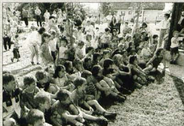
Ob otvoritvi razstave Iz babičine skrinje so naredili pravi žur.

pistaeljico Berto Golob in se z njo pogovarjali o knjižicah Drobne zgodbe in Iz babičine bale, program ob srečanju z njo pa je bil sestavljen iz ljudskih pesmic, ki so jih otroci prav tako "podedovali" od svojih babic. Priredili so tudi srečanje s starši in si ogledali lutkovno igrice Mojca Pokrajculja, ki so jo uprizorile vzgojiteljice in izdelale tudi lutke. Ob dnevu otvoritve razstave pa je bila na igrišču ob vrtcu prava zabava z lutkami, pesmicami, igrami in delavnici. Starši so prispevali pecivo, otroke pa so pogostili tudi s sladoledom. • D.Z. Žlebir