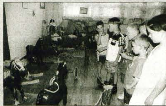
...fantje pri vlakcih in konjičih.