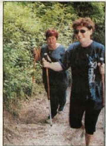
"Večkrat se podava na trimsko stezo..."

Tokrat se je nanjo podali več kot 140 ljubiteljev Gobavice, po kateri je speljana 2,2 kilometra dolga steza. Trimska steza so zgradili pred 26 leti in ima 21 postajnih mest z različnimi napravami. Med poznavalci tovrstnih stez pri nas je mengerska med najbolj razgibanimi, urejenimi in zato tudi priljubljenimi. Tudi tokrat so prireditelji dobivali od pohodnikov pohvale, slišati pa je bilo tudi pripombe, da bi nekatere naprave veljalo popraviti, utrditi, obnoviti.