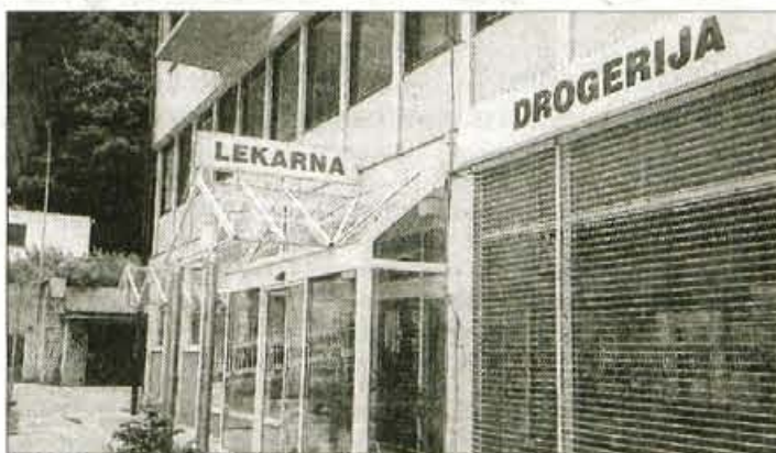
Bodo Jeseničani dobili tudi zelo potrebno nočno dežurno lekarniško službo, saj je sedanje nočno potovanje v Kranj za bolnega človeka lahko zelo naporno.