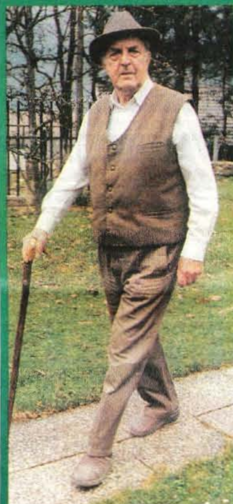
Ací Puhar Kranj v 20. stoletju

Knjiga, ki bo zanimala Kranjčanke in Kranjčane