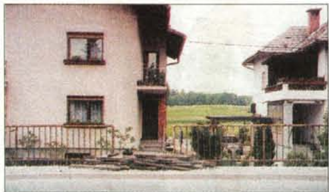
So na kup desk pozabili ali pa so tam ostale zaradi poškodovane ograje, ki bi jo končno tudi že lahko popravili.

Kranj, 30. maja - Pred dnevi nas je poklicala O. K. z Gorič in opozorila na malomarnost, ki sicer ne ogroža življenja in je marsikdo sploh ne opazi, po njenem mnenju pa vseeno zasluži vsaj toliko pozornosti, da bi jo nekdo odpravil. "Vsak dan se vozim po