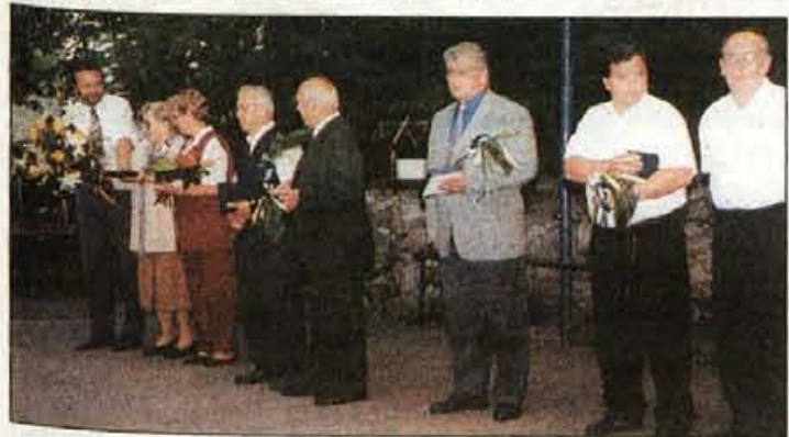
Po končani predstavitvi pihalnih orkestrrov je župan podelil priznanja.