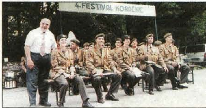
Program je začela vojaška godba

ljubitelji koračnic tudi od drugod. Mengšani pa so potem ob prijetnih zvokih koračnic in v prijetnem spomladanskem večeru in zavetju nekdanj in tudi zdaj vse bolj priljubljenega kotička praznovali pozno v noč. Med gosti pa so bili tudi župan občine