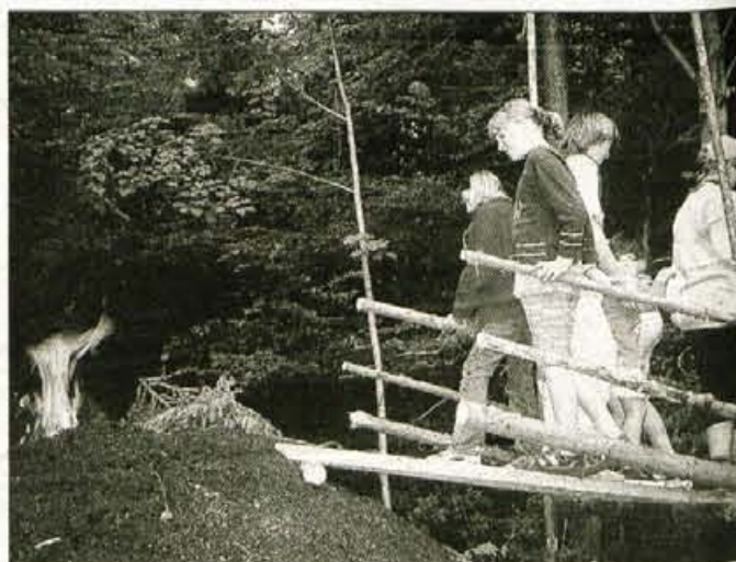
V predtrškem gozdu kope še ni bilo, vsaj mlajši se tega ne spominjajo.