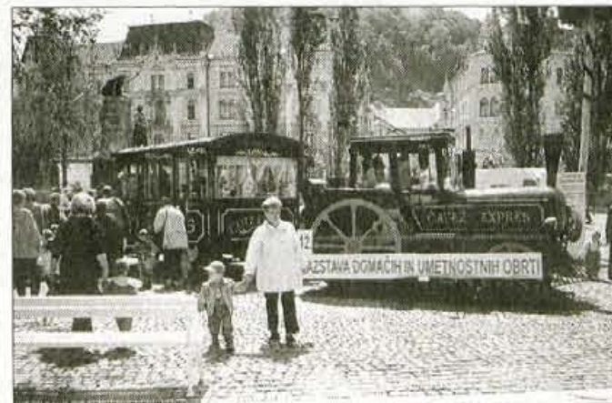
Na Ljubljanski grad se boste lahko popeljali tudi z vlakcem, ki bo vozil s Prešernovega trga v Ljubljani, vstopnica stane dvesto tolarjev.

Obrotna zbornica Slovenije je po dveh letih spet pripravila razstavo domače in umetne obrti, že trinajsto po vrsti, ki si jo boste na Ljubljanskem gradu lahko ogledali do 11. junija. Ob razstavi so izdali zelo lep katalog, v njem je tudi seznam razstavljavcev in lahko rečemo, da je med 230 razstavljavci zelo veliko gorenjskih, ki se predstavljajo z najrazličnejšimi izdelki, saj je na razstavi zastopanih kar 46 dejavnosti. Razstavo bodo spremljale številne prireditve, posebej zanimive bodo delavnice, kjer bodo mojstri predstavili svoje delo.