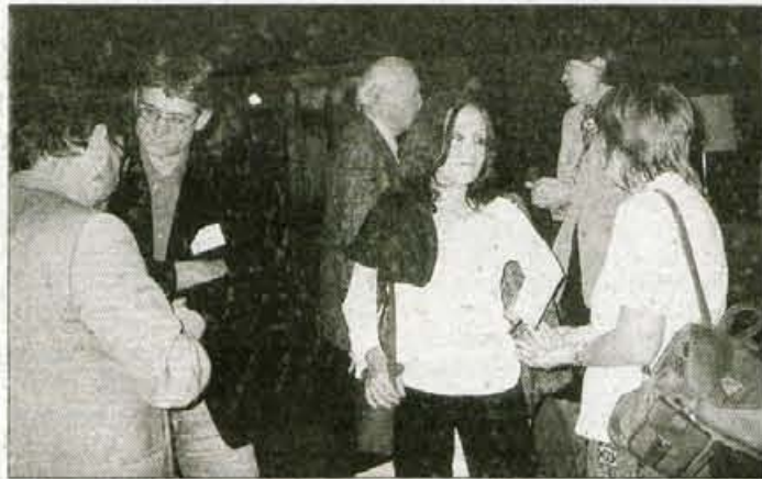
Pisatelji iz tridesetih držav so se minuli konec tedna srečali na Bledu.