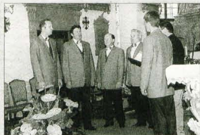
Redni gost na srečanju oktetov v Tunjicah je tudi Trsteniški oktet.