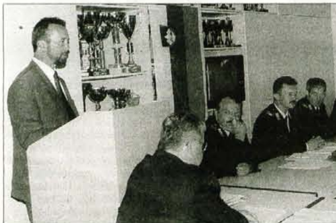
Na občnem zboru so ugotovili, da so v celoti uresničili lanski program.

Program, ki so si ga zastavili pred letom dni, so gasilci v celoti in dosledno uresničili.