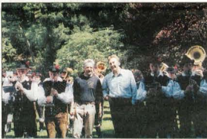
Po skupnem nastupu v parku tudi skupni posnetek z direktorjema.

Dogovor, ki smo ga tako utrdili tudi za prihodnje prireditve, je: 27. april - dan upora proti oku-