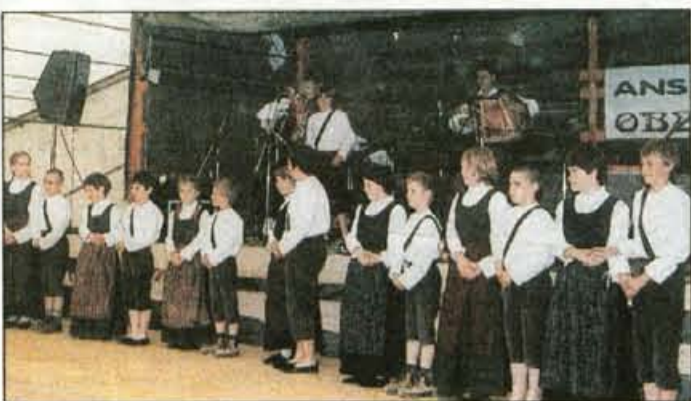
Otroška folklorna skupina Kulturnega društva Gorje-Bled.