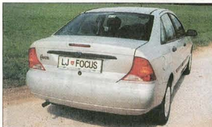
...nastal je razpotegnjen zadek z ozkimi lučmi, ki diši po ameriškem oblikovanju.