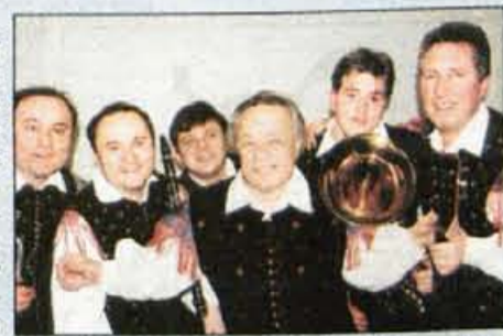
Na Alpskem večeru bo tudi Alfi s svojim ansambлом.

Kranj, 8. maja - Za štirinajsti Alpski večer na Bledu je skorajda že vse nared. Scenarij s tremi oddajami je pripravljen, posnetki skladb so usklajeni in pripravljeni, dvorana dobiva vse bolj pravi videz sobotnega večera, na katerem bo revija narodnozabavne glasbe.