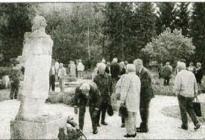
Talci so bili simbol uporništvu in trpljenja. Obeležja in spomeniki, kakršni so v Begunjah, bi morali biti skrb države.