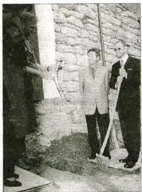
Čez dve leti bo trta že obrodila

Srečanje gorenjske podružnice Združenja MS Slovenije