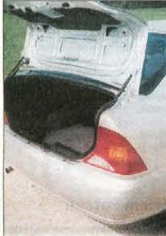
Prtljažnik je velik, vendar ima visok nakladalni rob in limuzinsko majhno odprtino.

Južnokorejski Hyundai Motor Company je v letošnjem prvem četrtletju zabeležil nov prodajni rekord. Prodajne rezultate so v primerjavi z enakim lanskim obdobjem izboljšali za več kot polovico. Skupaj so uspeli prodati 364.372 avtomobilov v vrednosti 3,5 milijarde dolarjev, kar pomeni porast v višini 71 odstotkov. Na domačem trgu so bile prodajne krivulje višje za 59, na tujih pa za 51 odstotkov. Med tujimi trgi so prednjačile ZDA, kjer se je število novih hyundajev podvojilo, medtem ko je evropska prodaja večja za 42 odstotkov. Sicer pa se je uspešna prodaja nadaljevala tudi v aprilu, tako da se letošnja številka že približuje polovici milijona. • M.G.