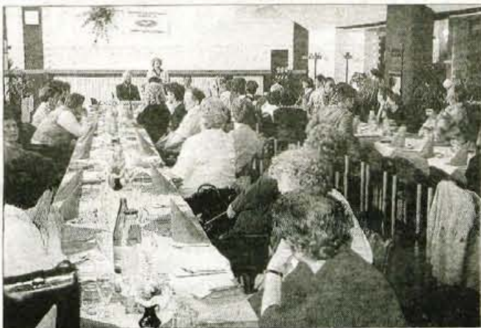
Srečanje je vsako leto bolj obiskano, tokrat so posebno pozornost posvetili zdravilu betaferon.

Gorenjska podružnica Združenja MS Slovenije je dobila