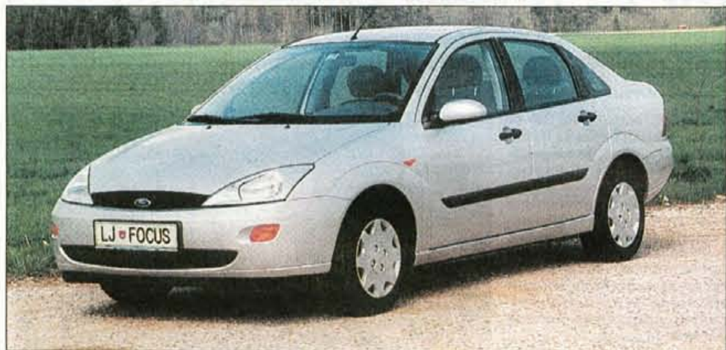
Ford focus z limuzinskim zadkom: oblikovalci so se trudili ohraniti Fordov new edge stil...