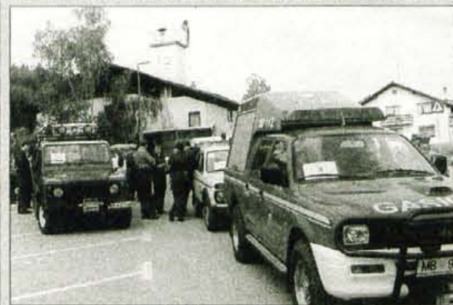
Srečanja so se udeležile ekipe iz vseh slovenskih regij.

Preska, 8. maja - Prostovoljno gasilsko društvo Preska v občini Medvode je minulo soboto pripravilo že 4. srečanje gasilskih terenskih vozil. Tokrat se je na povabilo največjega gasilskega društva v občini Medvode odzvalo kar 26 prostovoljnih gasilskih društev iz vseh slovenskih regij. Ekipa s terenskimi gasilskimi vozili so se v različnih športnih in gasilskih veščinah na največjem tovrstnem srečanju do zdaj pomerile na petih kontrolnih mestih. Najboljše ekipe so bile iz PGD Postojna II. ekipa, PGD Ribnica in PGD Preska I. ekipa. Prve tri ekipe so dobile pokale, prva pa tudi prehodni