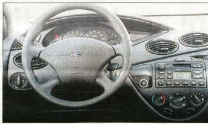
Notranost zvesto sledi zunanosti, zato je tudi na armaturni plošči veliko ovalov in ostrih robov.

To, kar je uspelo Fordovemu focusu pri pobiranju najrazličnejših lovov, ni uspelo še nobenemu avtomobilu: hkrati je bil namreč razglašen za avto leta v Evropi in Severni Ameriki in že zdaj je jasno, da gre za enega uspešnejših modelov te avtomobilske hiše. K uspehom je najbrž pripomoglo tudi dejstvo, da so focusa takoj ponudili v različnih karoserijskih izvedbah.