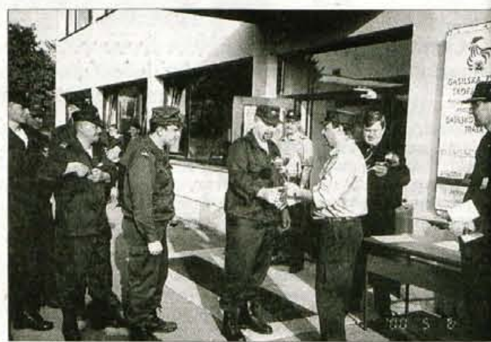
Ekipa PGD Sovodenj je dobila pokal Gasilske zveze Škofja Loka in trajno last tudi prehodni Loka.

ekipa in 3. PGD Poljane I. ekipa. Na rallyju pa so morale ekipe v določenem času prevoziti pot od štarta do cilja, upoštevati znake in UKV navodila. Na cilju so bile potem še spretnostna vožnja in vaje s prenosom vode, preverjanje znanja in polževa vožnja s kolesom. Prvi trije so dobili pokale, pokroviteljica rallyja pa je bila Gasilska oprema Ljubljana. Najboljše tri ekipe na rallyju so bile: 1. PGD Sovodenj, 2. PGD Dobračeva in 3. PGD Gosteče.