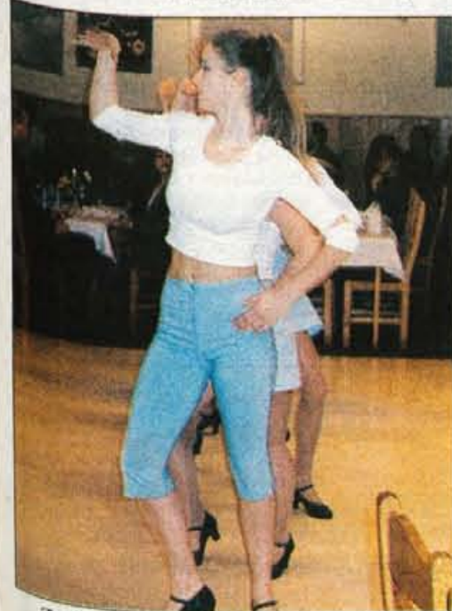
Za zabavo so poskrbele tudi mične plesalke.