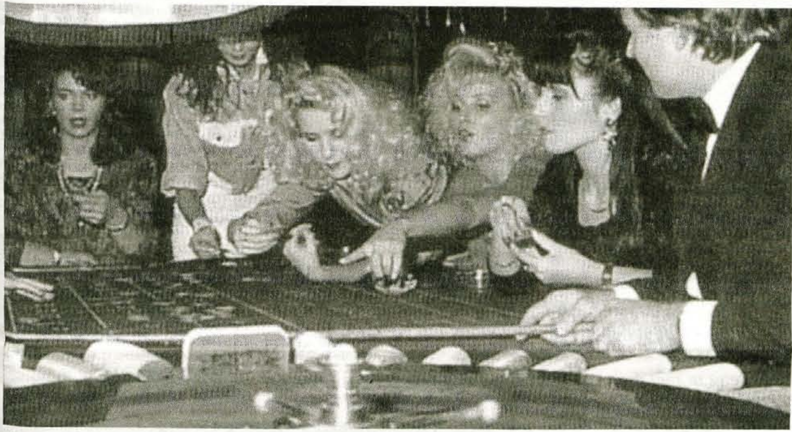
Slovenske igralnice postajajo vedno bolj pomemben del slovenske turistične ponudbe...