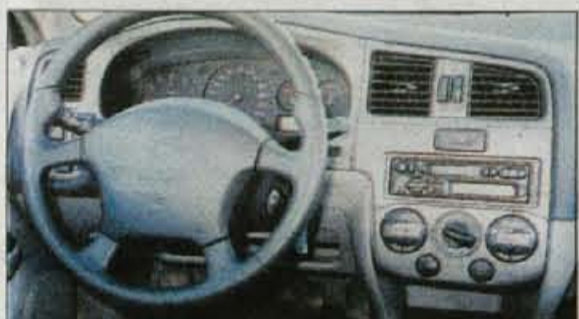
Notranjost: dobra ergonomija, čvrsti sedeži in nevpadljiva sivina.