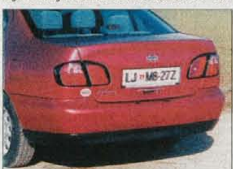
Prtljažnik je sicer prostoren, vendar dostop ovira nepriročna limuzinska odprtina.

Primerino podvožje je bolj nagnjeno k dobremu oprijemu ceste kot k udobju. Vzmetenje je tako le povprečno dobro, vendar razen pregroba odzivanja na kratke grbine to ne vpliva na počutje potnikov. Celoten avtomobil dobro sodeluje z voznikom, enako velja tudi za zavore s serijsko dodanim protiblokirnim sistemom.