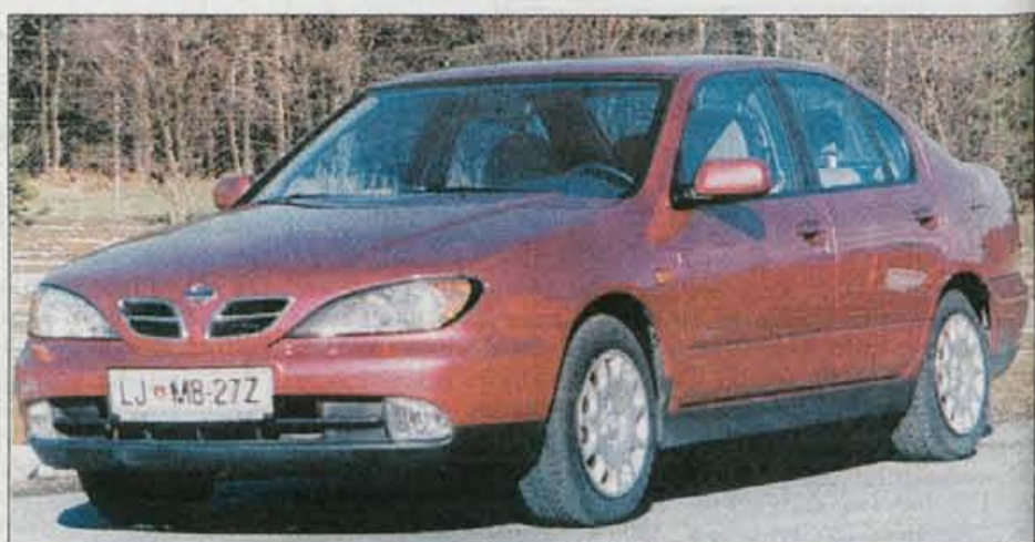
Nissanova primera je lansko leto doživela osvežitev, tehničnih sprememb skoraj ni.

Primera je bila povsem na novo narejena pred tremi leti, lani pa so jo zaradi lažjega kljubovanja tekmeccem oblikovno in teh-