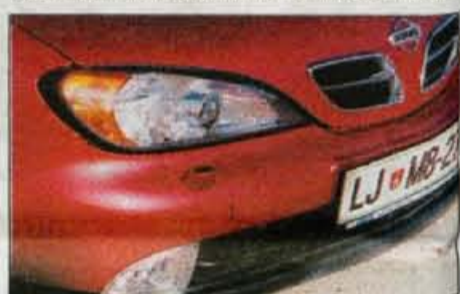
Zlobneži pravijo, da je nos podoben kot pri renaultu meganu: popolnoma naključno in nenamerno.

Osnovni primerin motor je že znani 1,6-litrski bencinski štirivaljni, ki zmore 100 konjskih moči. Nazivna moč sicer obeta dovolj, dejansko pa se izkazuje, da je motor podhranjen. Voznik ima občutek, da mu je vrtenje precej odveč, da pokaže vsaj malce živahnosti, ga mora priganjati v višje vrtiljaje in prešibki prožnosti mora pomagati s pogostejšim pretikanjem. Vse skupaj pa je še bolj občutno, kadar je avtomobil