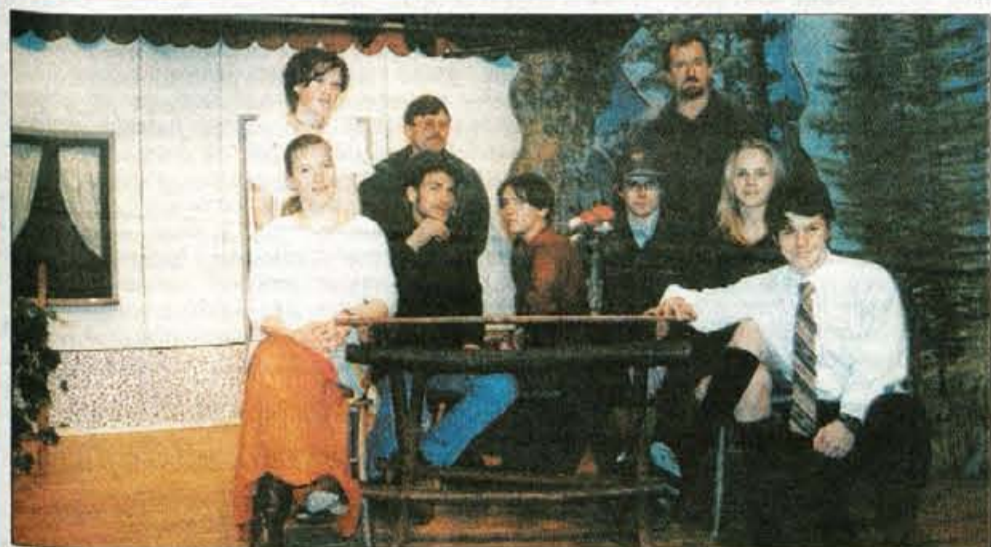
Na Sovodnju je bila premiera veseloigre Kam iz zadreg že v soboto.

V amaterskih gledališčih že cveti pomlad