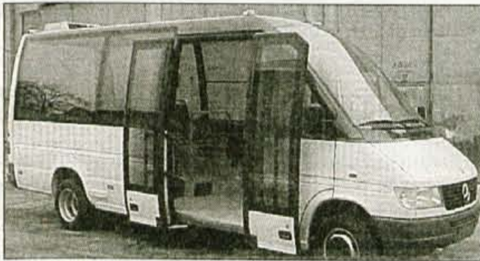
Novi avtobusek bo odšel na pot skozi mesto predvidoma 1. junija.

Predvsem zaradi spremljanja ekonomske upravičenosti posameznih avtobusnih linij, tako v mestnem kot medmestnem in medkrajevnem prometu, so v Alpetourovi Potovalni agenciji z lanskim 1. septembrom uvedli nov sistem inkasa. Kartica je novost v Sloveniji, drugi prevozniki je še nimajo, vizija Alpetoura pa je enotna kartica, s katero bi ljudje lahko potovali po vsej državi z vsemi prevozniki. Ali bodo za to uspeli navdušiti tudi druge, je seveda vprašanje.