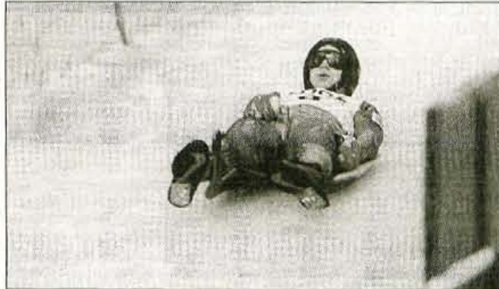
Proga v Dolenji vasi je med najtežjimi na svetu, vendar pa so jo domači organizatorji za tekmo odlično pripravili.

Tudi v ženski konkurenci Slovenci v svetovnem pokalu tre-