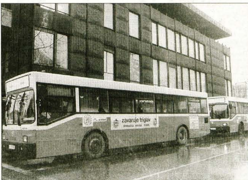
Začarani krog: premalo potnikov, drage karte, še manj potnikov

Po januarskem pregledu prepeljanih potnikov je najbolj donosna lokalna proga št. 1 do Prebačevega, po kateri se je peljalo 20.177 ljudi. Na dvojki je bilo januarja 6.558 potnikov, na trojki 4.780, na štirikotki 3.351, na petki 7.863, na šestki 5.677, na sedmici 9.075, na osmici 2.353 in na struževski devetici le 271, torej skupaj 60.105 potnikov.