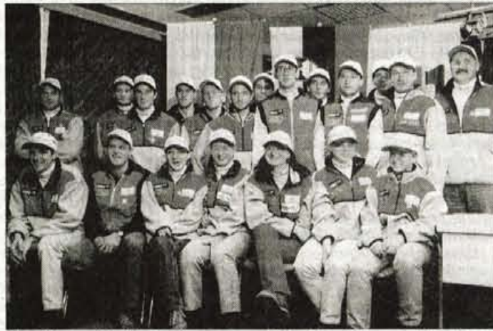
Naš biatlonci in biatlonke sezono pričakujejo dobro razpoloženi.

Fantje, ki so lani razveseljevali zlasti z dobrimi rezultati v štafetnem tekmovanju imajo tudi letos cilj, da se izkažejo v tej disciplini