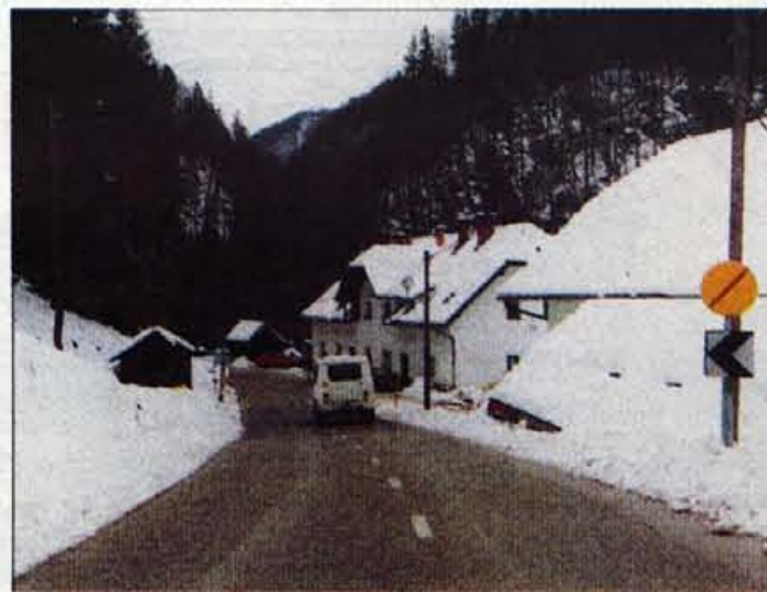
Na Fužinah se začne Spodnje Jezersko.