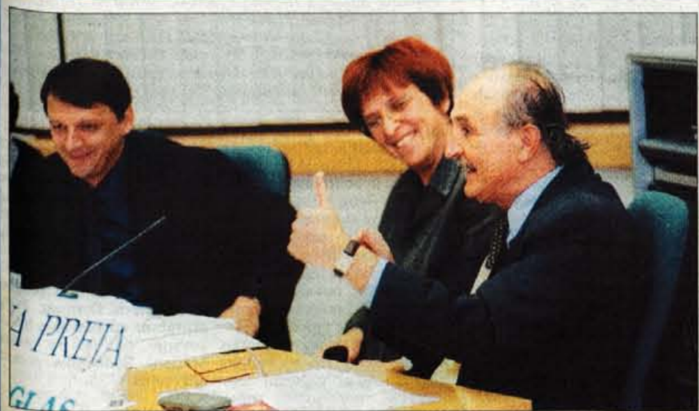
Šesta letošnja Glasova preja