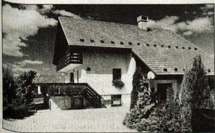
Hiša družine Tršan iz Valburge je bila ocenjena za najbolj urejeno.