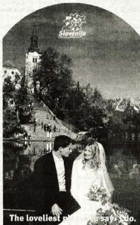
Naslovnica brosure s poroko na Bledu