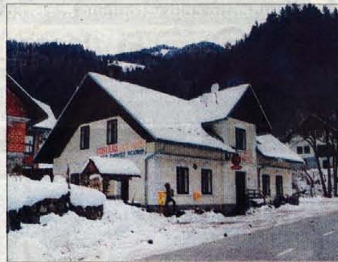
Kanonir je najstarejša gostilna na Jezerskem.