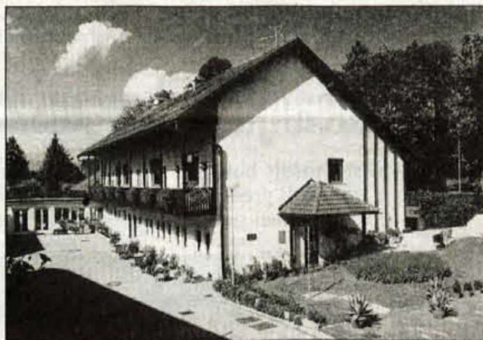
Med zavodi in šolami je dobil najvišjo oceno VIZ Fran Milčinski iz Valburge.