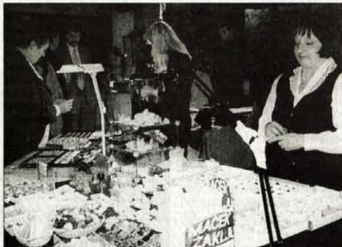
Razstavljeni minerali in fosili - paša za oko.