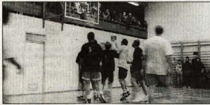
Košarka je v Gorenji vasi med najpopularnejšimi športi.

Vse pomembne mejnike v razvoju košarke so v Gorenji vasi zbrali v posebnem zborniku, pripravili pa so tudi razstavo. Kot je na sobotni slovesnosti ob praznovanju 30-letnice košarke v