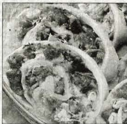
Zvitek iz kislega zelja in mletega mesa

zarumeni, dodamo rdečo papriko in vse skupaj stresemo v kuhano zelje. Juha naj vre vsaj še 10 minut. Meso ali klobaso