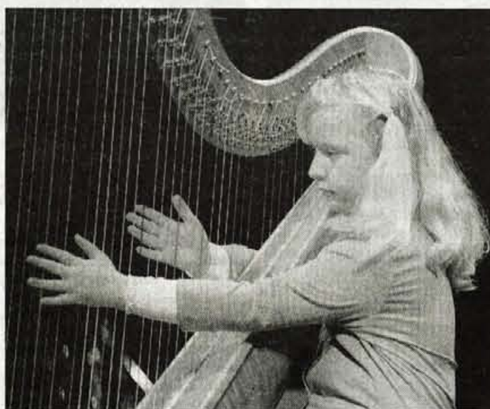
Na jubilejnem koncertu so pod mladimi prsti zazveneli tudi zvoki harfe.

Pihalni orkester Glasbene šole Kranj pa je bil le ena od glasbenih skupin, ki so nastopile na slovesnem koncertu ob devetdesetletnici šole. Predstavil se je tudi ansambel harmo-