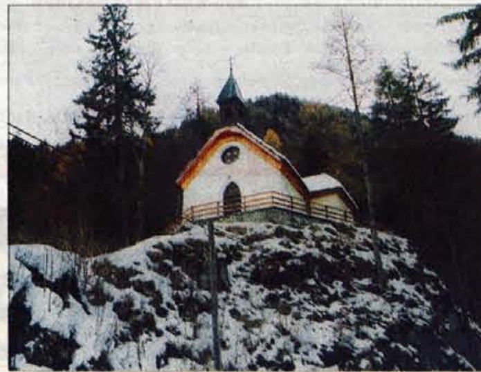
Kapela svetega Huberta še vedno brez blagoslova.