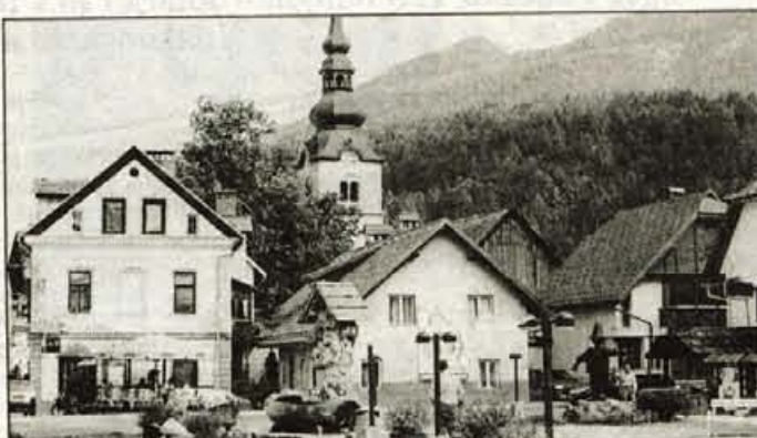
Med vsemi Gorenjskimi občinami bo največ koncesijskega igralniškega denarja dobila občina Kranjska Gora

Zdaj je bilo pa občinam dovolj, povzdignile so glas upora. Minister za turizem je na Brdu sklical sestanek z župani občin na turistično zaokroženih območjih. Na posvetovanju je minister pojasnil razloge za ustanovitev fundacije in zaplete. Vlada je vztrajala pri fundaciji, minister tudi, kajti to naj bi bil edini način, da bi bila sredstva od igralniških koncesij namenjena na razvoj turizma in turističnim projektom. Tu naj ne bi šlo le za sredstva, ki pripadajo občinam, ampak tudi za sredstva, ki pripadajo državnemu proračunu in so po zakonu o pospeševanju turizma ter zakona o igrah na srečo namenjena za razvoj turizma in promocijo na nacionalni ravni. Turistično ministrstvo in občine naj bi tako prišle do kvalitetnih razvojnih sredstev. Občine na zaokroženih območjih, kjer so igralnice, naj bi namensko koristile lastna sredstva, kandidirale pa tudi za sredstva, ki jih