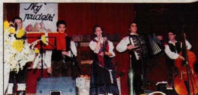
Da vedo, kako se stvari streže, da je potem tudi veselo, so potrdili člani ansambla Gorenjski kvintet s pevko. Obljubili smo jim, da bomo objavili, da iščejo pevca. Pokličite kar na Gorenjski glas.