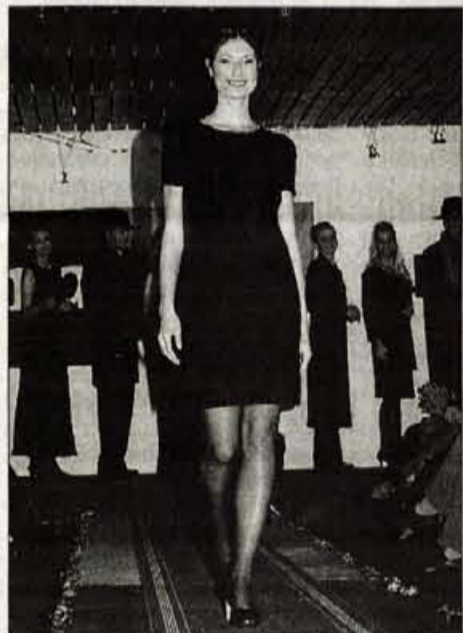
Posebnost 'male večerne obleke' so srebrne kovinske niti v tkanini, ki se lesketajo pri hoji, kar na fotografiji sicer ni opazno, do izraza pride predvsem v večernem soju luči.

Kroj je tako še naprej delniška družba, v kateri imajo večinski delež notranji lastniki (sedanji in bivši zaposleni). Ker so nekateri svoje delnice prodali, se je delež notranjih lastnikov s 60 zmanjšal na 53 odstotkov. Za 7 odstotkov pa je svoj delež povečala pid Krona, ki je delnice kupila in tako svoj delež z deset povečala na 17-odstotnega. • Marija Volčjak