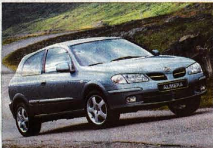
Eden od Nissanovih upov je tudi prenovljena almera, ki so jo zasnovali in oblikovali v Evropi za okus evropskih kupcev.

Nissan namreč v avtomobilskem svetu velja za enega največjih finančnih bolnikov, saj dolgovi presegajo 1,4 trilijona jenov. Do obračunskega leta 2002 naj bi dolgove vsaj prepolovili, vendar po besedah Nissanovega poslovnega vodje Carlosa Ghosna zmanjševanje stroškov ne bo najbolj dramatičen del programa. Carlos Ghosn je bil od leta 1996 pri Renaultu, kjer je opravljal naloge izvršnega podpredsednika skupine, zadolženega za razis-