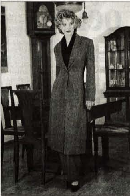
Zimska kolekcijo sestavljajo tudi kostimi z zelo dolgimi jaknami, ki segajo celo tja do gležnjev.

Za letošnjo zimsko kolekcijo je še vedno značilna siva barva, ki jo poživljajo mehki materiali s tkalnimi učinki, bukle in umetno krzno, celo lesketajoči se saten. Plašči so zelo dolgi, mehko vas bodo ovili, precej