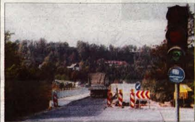
Polovična zapora prometa pod Betinskim klancem se do konca leta.

Betonska konstrukcija je bila dotrajana, obnove pa je bilo potrebno tudi vozišče, zato se je Direkcija republike Slovenije za ceste odločila za njegovo temeljito obnovo. Trenutno urejajo vozišče, ki ga bodo na novo asfaltirali ter uredili hidroizolacijo in pločnika za pešce, omenjena dela pa bodo končali do konca leta. Do tedaj bo tudi polovična zapora prometa, ki predvsem ob koncu tedna povzroča zastoje. Ljubljansko podjetje SCT, izvajalec del, bo potem obnovilo še mostno konstrukcijo pod voziščem. Zahtevna dela bodo po besedah Gregorja Kosa, predstavnika za odnose z javnostmi na DRSC, končali predvidoma do konca pomladi prihodnje leto. Obnova mostu naj bi stala okoli 94 milijonov tolarjev, ki jih bo v celoti zagotovila omenjena direkcija. • R. Škrjanc