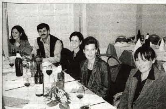
Na sliki: del izjemno uspešne ekipe Radia Triglav na 10. Festivalu nekomercialnih radijskih postaj prejšnji teden v Celju.

Jesenice, 26. oktobra - Od prejšnje srede do petka je v Celju potekal jubilejni, deseti Festival slovenskih nekomercialnih radijskih postaj. Na njem je sodelovalo 13 radijskih postaj, ki so vključene v gospodarsko interesno združenje in imajo v svojem programu najmanj 40 odstotkov informativnega programa.