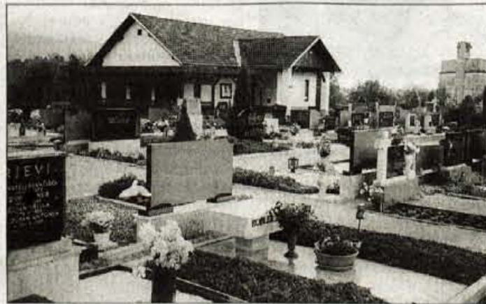
Pokopališče na Kokrici, leži ob cerkvi, je v zadnjih letih postalo premajhno za krajevne potrebe. Ena izmed predlaganih rešitev je razširitev pokopališča proti strugi bližnjega potoka Golnišnica.

nem pokopališču. Razmišljanja o njegovi razširitvi so že kar nekaj časa močno živa, dogovori z