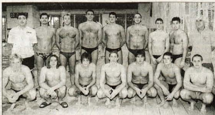
Vaterpolisti Triglava so v domačem bazenu v Kranju prvi favoriti.