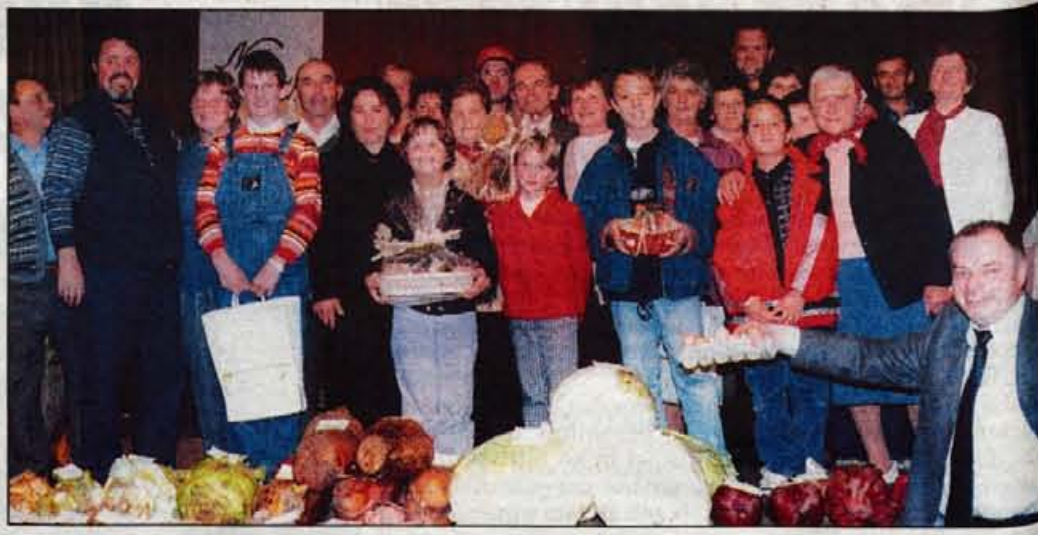
Rekorda sicer nismo doživeli, razen pri sladkorni pesi, bila pa je zato vseeno dobra letina. Odrezala pa se je tudi Kmetijska zadruga Cerklje, ki je nagradila prinašalca najstarejše hranilne knjžice iz leta 1912.

Ko so ministru Smrkolju na priveditvi povedali, da je imel največji krompir zaradi odločitve o izvozu rdečega mesa v Evropo, je povedal, da bodo zadeve glede "reda" in ukrepov skrajšali pri nas na 30. november. Pa tudi število izvoznikov dovoljenj se bo zmanjšalo, saj se je pokazalo, da na primer 9 izvoznikov potrebuje dovoljenja za 40 tisoč ton mesa. En sam naš zasebnik pa bi bil vesel, če bi lahko na leto predelal 50 tisoč ton mesa. Če vemo, da vsako izvozno dovoljenje za izvoznika potegne za seboj še vrsto ljudi, potem je zmanjšanje na dlani.