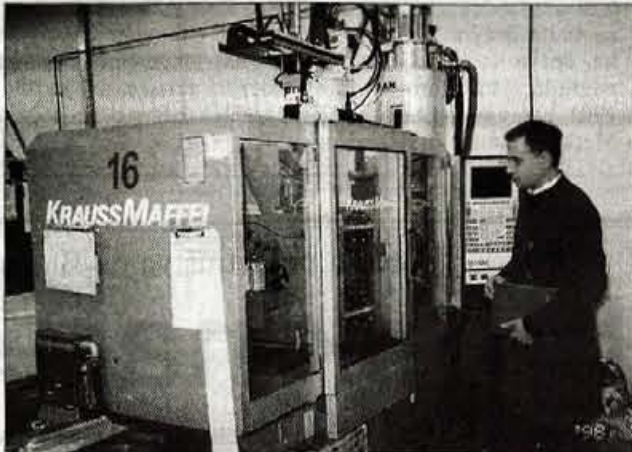
V livarni strežejo livarskim strojem roboti. Livar lahko tako nadzoruje dva stroja hkrati.