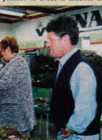
Sejem z zanimivo gobarsko razstavo, ki jo je pripravila Gobarska družina Kranj, si je ogledalo prek 10.000 obiskovalcev.

Na Gorenjskem pa je v soboto potekala vaja Letalska nesreča '99. Pripravili so jo uprava RS za zaščito in reševanje ministrstva za obrambo, ministrstvo za promet in zveze z uradom za