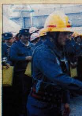
Po končani mednarodni gasilski vaji so v soboto najboljšim podelili tudi priznanja.