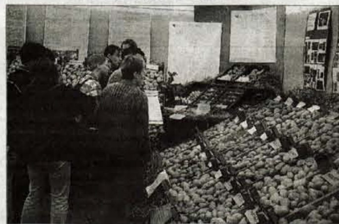
Obiskovalcem sejma so predstavili 84 sort krompirja.