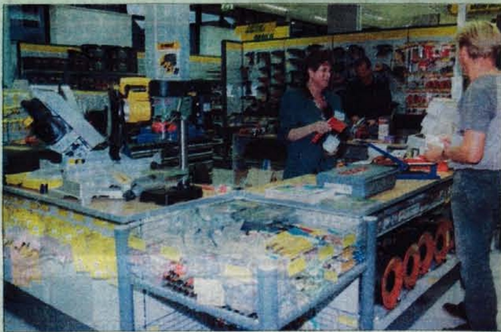
Sodobno opremljena notranjost prodajalne.

hočejo, pri izbiri kaj zataknilo. Torej, kar brez strahu. V novi Kovini so dovoljeni vsi prijemi samopostrežnega kupovanja, od "tipanja" do odpiranja pokrovov na policah, v katerih so zloženi razstavljeni artikli. Osem v trgovini zaposlenih prodajalcev po vsakem delovnem dnevu poskrbi, da je zjutraj spet vse na svojem mestu. Zaposleni v Kovini namreč blago sami kupujejo, sami prevzemajo in z njim tudi sami polnijo police.