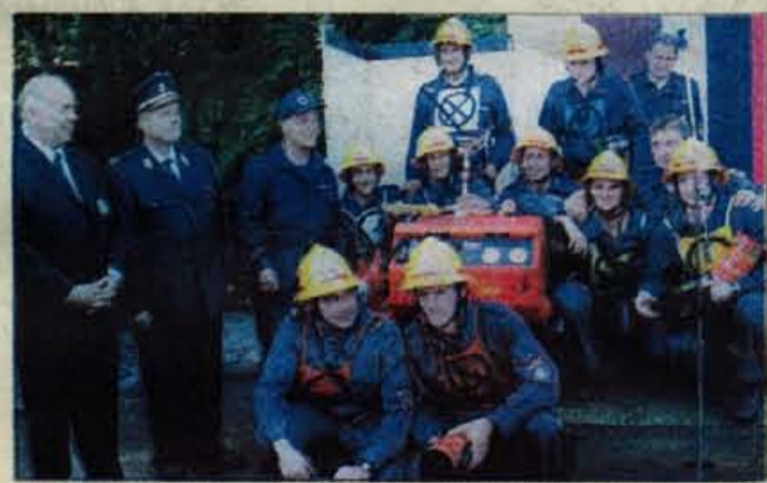
Na gasilskem tekmovanju je bila najboljša ekipa PGD Rogaska Slatina, GZ Šmarje pri Jelšah, ki je dobila brizgalno Ziegler.

letalstvo in Upravo RS za zračno plovbo, uprava policije ministrstva za notranje zadeve in ministrstvo za zdravstvo. Vajo so izvedli, da bi preizkusili in izpopolnili pripravljenost in organiziranost delavcev za iskanje in reševanje pri večji letalski nesreči. Domnevali so, da sta na območju Kamniško-Savinjskih Alp trčili potniško