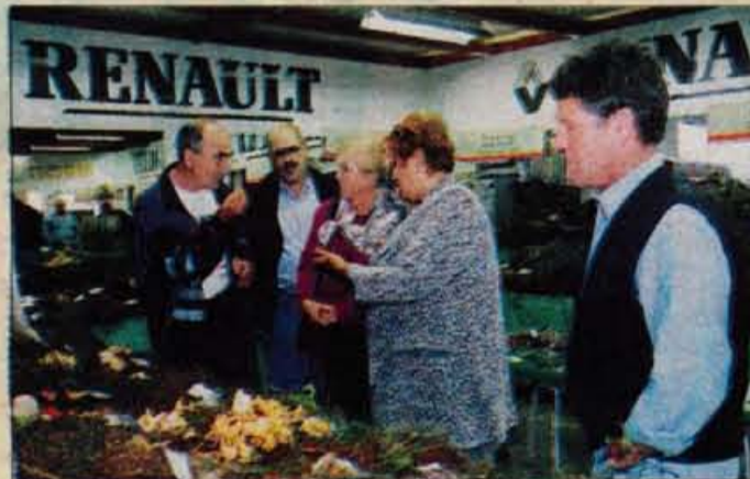
Sejem z zanimivo gobarsko razstavo, ki jo je pripravila Gobarska družina Kranj, si je ogledalo prek 10.000 obiskovalcev.

Na igru pri Ljubljani je bilo peto državno preverjanje usposobljenosti ekip prve pomoči