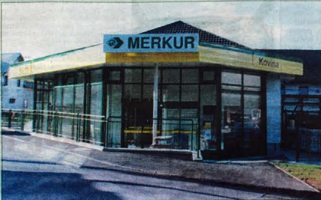
Pročelje prenovljene Kovine.

Najbrž zato, če bi se komu, ki ne sodi ravno med podjetnike in druge kupce strokovnega tipa, ki že ob vstopu v trgovino vedo, kaj