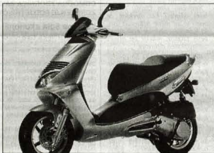
Tudi ukraden gre očitno dobro v promet.

Policisti so njihovo početje nekaj časa opazovali. Videli so, da imajo fantje za kraje skuterjev, ki se zaklepajo s ključem, posebej prirejeno orodje, t.i. top, to je cev, s katero zlomijo ključ na skuterju. Orodje so tudi zasegli. Tatovi