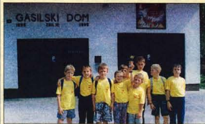
Pionirji iz PGD Zbilje so osvojili tretje mesto.

Škofljica, 14. junija - Na Škofljici je bilo konec tedna v soboto regijsko tekmovalje pionirskih in mladinskih ekip prostovoljnih gasilskih društev. Pomerilo se je 37 pionirskih in 32 mladinskih ekip. Najboljše so bile: pionirke - Pijava Gorica (Gasilska zveza Škofljica), Rudnik (Ljubljana), Žazar (Dolomiti), pionirji - Horjul (Dolomiti), Bukovica-Utik (Vodice) in Zbilje (Medvode), mladinke - Sora (Medvode), Šinkov Turn (Vodice), Notranje Gorice (Brezovica), mladinci - Spodnje Pirniče-Vikrče-Zavrh (Medvode), Sora (Medvode) in Horju (Dolomiti). Uspeh sta na tem tekmovalju dosegli z ekipami Gasilska zveza Medvode in Vodice, saj se je na državno tekmovalje iz obeh zvez od 12 možnih uvrstilo kar 5 ekip. Za člane, članice, veterane in veteranke pa bo jeseni podobno regijsko tekmovalje v občini Vodice. • A. Ž.