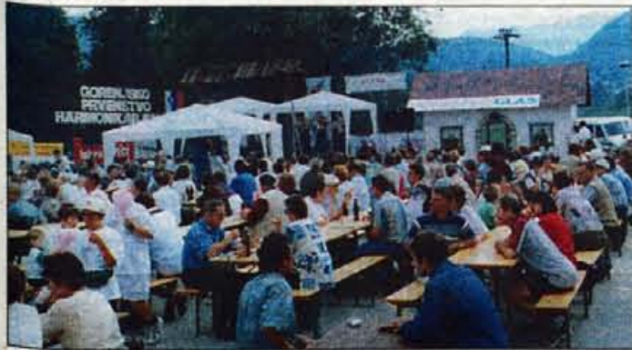
Tudi letos so številni obiskovalci napolnili prireditveni prostor, ki je ni pregnal niti dež.

Besnica, 14. junija - Prizadevni turistični delavci oziroma domačini v tej krajevni skupnosti v Mestni občini Kranj so minulo nedeljo popoldne "spravili pod streho" še eno tradicionalno in priljubljeno prireditev. Pravzaprav bi lahko bila celovita in kratka ugotovitev za nedeljsko harmonikarsko popoldne v Besnici: prav nič se ni izneverilo.