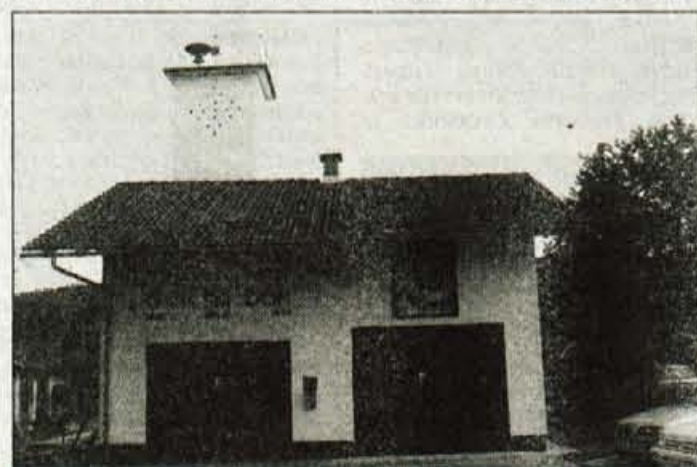
Gasilski dom je bil lani izbran v akciji TZ Slovenije za najlepši dom, ki je bil med 1930. in 1970. letom.

Loke je z deli že začel, vendar sa zadnje čase na tem prostoru na Jeprci spet pojavljajo kupi gradbenega materiala. Zato v vodstvu krajevne skupnosti