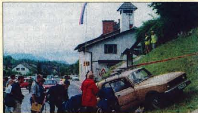
V nesreči avtomobila je bilo potrebna pomoč zaradi poškodb in šoka.

Zgornje Stranje, 14. junija - V soboto dopoldne je kar trinajst ekip prve pomoči iz občine Kamnik na četrtm regijskem tekmovalju sodelovalo v preverjanju usposobljenosti za nudenje prve pomoči. Vse ekipe so pokazale dobro znanje, zmagala pa je ekipa Kamnika 2.