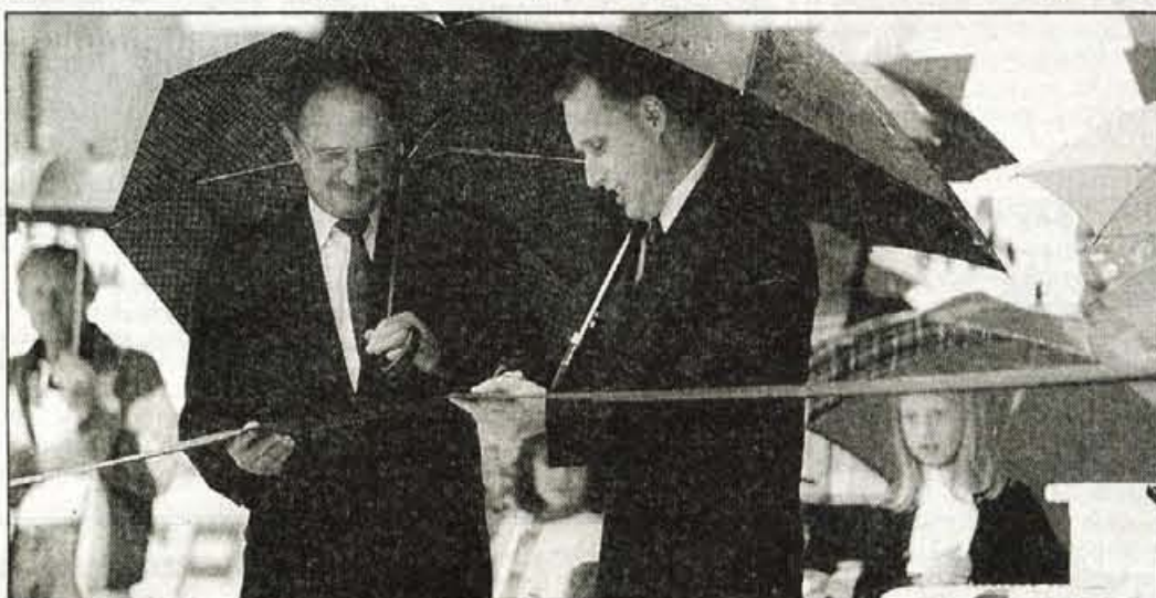
Minister za šolstvo in šport dr. Slavko Gaber je simbolično prerezal trak ob bazenu.

Radovljica v treh letih iz občinskega proračuna prispevala 61 milijonov. Ostalo polovico pa je prispevala država: Ministrstvo za šolstvo in šport ter Fundacija za financiranje športnih dejavnosti v Sloveniji.