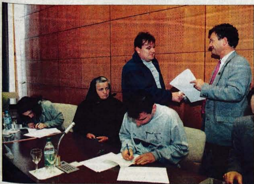
Občina Kranj razdelila ključne šestnajstih neprofitnih najemnih stanovanj