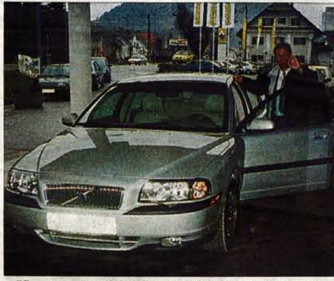
"Dost mam starih krip" je po odločitvi za nakup novega volva S80 zadovoljno dejal kranjski župan.

Sicer pa se županu vidi, da je pred prevzemom občinske oblasti služboval v firmi, ki se je ukvarjala s pridobivanjem provizij pri prodaji dragih avtomobilov. To nenazadnje dokazuje tudi njegov izostren in prefinjen okus za pločevino na štirih kolesih. Novi avtomobil bo namreč opremljen z močnim šestvaljnim motorjem, ki zmore kar 272 konjskih moči. Kljub temu ga bodo še pred uradno izročitvijo na mizo dobili mojstri za "friziranje" in