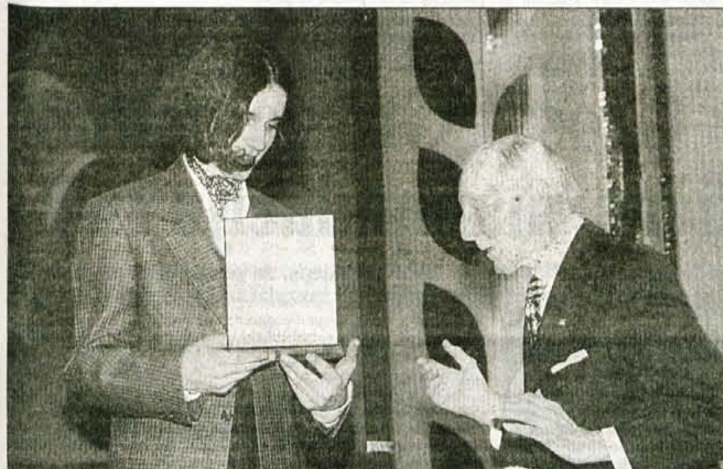
Najstarejši olimpijca Leon Štukelj v družbi z lani najboljšim športnikom Slovenije in zmagovalcem svetovnega pokala v smučarskih skokih Moravčanom Primožem Peterko.

zadnjih letih je Leon Štukelj po vsem svetu znan kot najstarejši olimpijski zmagovalca, saj je v Parizu leta 1924 osvojil zlati medalji v mnogobojju in na drugo. V Amsterdamu je štiri leta kasneje osvojil zlato na krogih in bron v mnogobojju, bil pa je tudi v bronasti gimnastični vrsti. Tretjič je na olimpijskih igrah nastopil leta 1936 v Berlinu ter osvojil drugo mesto na krogih in 6. mesto z moško gimnastično vrsto. Želel je nastopiti tudi na olimpijskih igrah leta 1932 v Los Angelesu, vendar ni bilo denarja za potovanje. Ko so to izvedeli Slovenci v Ameriki so ga zbrali, vendar pa se olimpijski komite v Beogradu s tem ni siringjal in Leon Štukelj je ostal doma. Nastopal je tudi na številnih drugih največjih tekmovanjih in svetovnih prvenstvih.