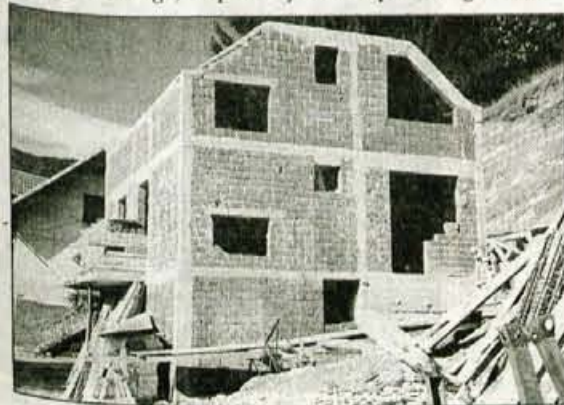
Svetinova hiša med gradnjo

Ves denar se je zbiral pri Rdečem križu in kar bo še prispelo, bomo uporabili za dela, sicer pa je uradno akcija zaključena. Ob tej priložnosti se gradbeni odbor javno zahvaljuje vsem, ki so pomagali Svetinovim zgraditi hišo, tudi Radiu Triglav in Gorenjskemu glasu, ki sta medijsko prispevala svoj delež v tej humanitarni akciji. Na Jesenicah se je ponovno izkazalo, da imajo ljudje široko srce, ko je treba pomagati najbližjemu v stiski in nesreči." • D.Sedej