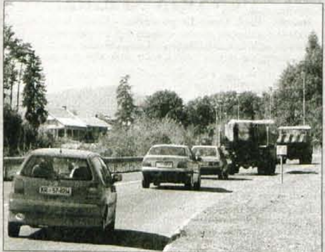
Velik blejski problem je promet. Občina je v prizadevanjih za izgradnjo južne razbremenilne ceste doslej storila vse, kar je bilo v njenih močeh.

Za urejanje prostorske ureditvenih planov, zazidalnih načrtov in dokumentacije za urejanje prostora so v štirih letih porabili 50 milijonov tolarjev. Do 1. maja 1995 je te naloge opravljal zavod za prostorsko načrtovanje bivše občine Radovljica, odtlej dalje pa občina samo s svojo službo. V tem času so nekajkrat spremenili in dopolnili prostorske sestavine dolgoročnega in srednjeročnega družbenega plana, zaradi močnih pritiskov za poseganje na Bled so sprejeli odlok o začasni prepovedi izvajanja zazidalnega načrta za centralno turistično področje Bleda (njegovo veljavnost so nekajkrat podaljšali), dopolnili so zazidalni načrt za Zasip in prostorsko ureditvene pogoje za območje planske celote Bled, sprejeli so ureditveni načrt za Zgornje Gorje, zazidalni načrt za območje med Savsko cesto in Cesto Gorenjskega odreda na Bledu ter programa priprave ureditvenega načrta za Stražo in Ribensko goro. Za potrebe blejske južne razbremenilne ceste so pridobili mnenje vlade o usklajenosti občinskih planskih dokumentov z republiškiimi, s postopkom za sprejetje lokacijskega načrta pa bodo lahko nadaljevali šele potlej, ko bodo pridobili idejni projekt. V postopku sprejemanja je tudi odlok o prostorsko ureditvenih pogojih. (Če se le ni kaj zapletlo, so ga sprejeli na včerajšnji seji.)