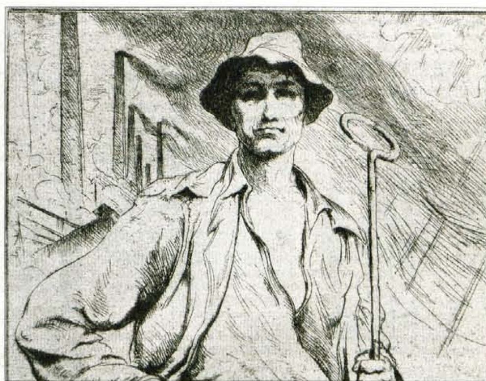
BOŽIDAR JAKAC: Plavžar, jedkanica, 1946, iz zbirke Jeseniški cikel. Razstava Jeseniški plavži, ki je na ogled v Kosovi graščini na Jesenicah, se spominja obletnice, ko so zgrmeli v prah jeseniški plavži in postali zgodovina.