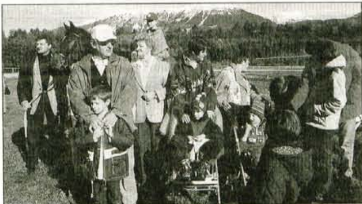
Se en fotografski spomin s sobotnega srečanja na hipodromu v Lescah, ko so varovanci Doma Matevža Langusa iz Radovljice dobili v dar konja.