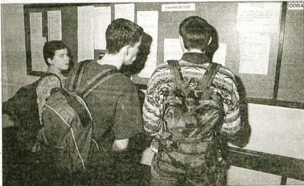
Bodo imeli dijaki Srednje elektro in strojne šole Kranj že prihodnje leto možnost vpisa na višjo šolo za elektroniko v matični šoli?