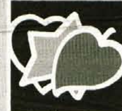
ZDRUŽENA LISTA socialnih demokratov

Prisluhniti želimo vašim pobudam in željam za uspešni nadaljnji razvoj občine Senčur. Pridružite se nam v čim večjem številu. VABLJENI