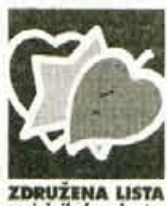
ZDRUŽENA LISTA socialnih demokratov

Draga volivka, dragi volivec, spoštovani tisti mladi, ki volite prvič.