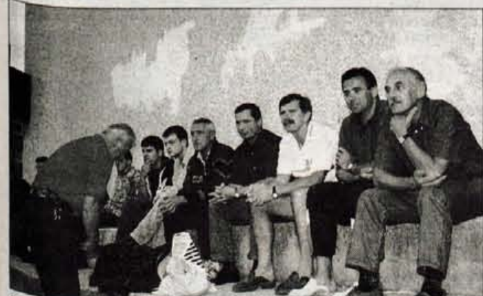
Tržiški rokometni veterani