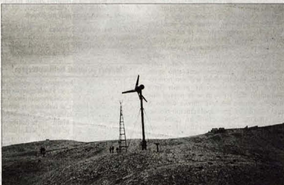
Vetrnica bo dnevno prispevala za dve uri električne energije...

Na Kredarici so se med prvimi pri nas odločili za uporabo obnovljivih virov energije. Že pred leti so omejili uporabo hrupnega agregata ter kurilnega olja, saj bi v primeru razlitja ali padca helikopterja, ki bi prevažal to gorivo, prišlo do ekološke katastrofe. Zato zadnja leta potrebno energijo pridobivajo prek sončnih kolektorjev, ki so nameščeni na strehi doma. En sončni kolektor nadomesti kar 350 litrov kurilnega olja letno. Že nekaj let pa so razmišljali o uporabi še enega obnovljivega vira energije, ki ga imajo na Kredarici na pretek - vetra. Dalj časa so po različnih državah sveta iskali vetrnico, ki bi bila primerna za visokogorje in tako izjemne vremenske pogoje, kot so na Kredarici. Vetrovi tod dosežejo hitrost tudi do 200 kilometrov na uro, nabira se ivje, sneg... Pred kratkim so primerno vetrnico našli na Škotskem in dobili tudi zagotovilo proizvajalca, da bo vetrnica delovala tudi v