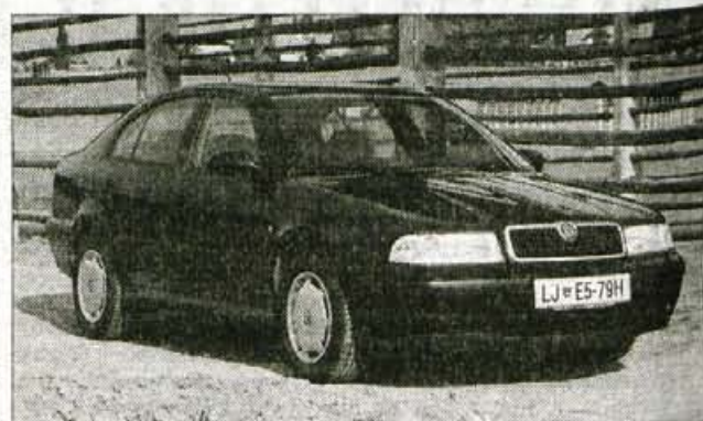
Škoda Octavia suvereno nastopa med najbolj prizanimi tekmeči v avtomobilskem srednjem razredu.

Vsi Octaviini motorji so preseljeni iz avdijev in volkswagenov, tudi 1,6-litrski štirivaljnik s