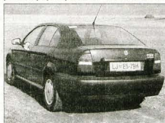
Precej visok zadek nekoliko ovira pogled nazaj, toda pod njim je uporaben in izjemno velik prtljažnik.