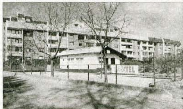
Balinarska sekcija športnega društva bratov Smuk ima lepo urejeno balinišče, dovoljenja zanj, žal, ne. V krajevni skupnosti jim pomagajo pri legalizaciji, ki je tudi edini način, da pridejo do štiristeznega balinišča.

KNJIŽNI PROGRAM VOŠČILNICE ZA RAZLIČNE PRILOŽNOSTI DARILNI PAPIRJI, VREČKE, PENTLJE IN TRAKOVI MATERIALNI IN PRIROČNIKI ZA PROSTI ČAS FOTOALBUMI, OKVIRJI ZA SLIKE ŠOLSKE POTREBŠČINE PISARNIŠKI PROGRAM IGRAČE (iz lesa, kartona in tekstila) DARILA FOTOKOPIRANJE BREZPLAČNO ARANŽIRANJE DARIL