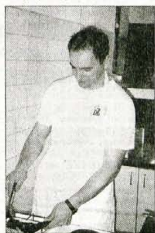
K pečenci gre seveda zelje.