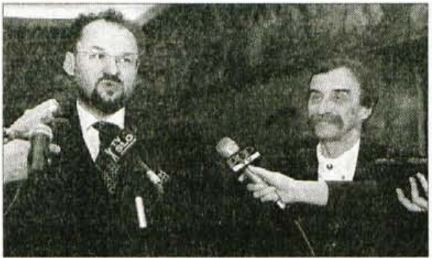
Jelko Kacin in Ljubiša Ristić

V delegaciji slovenskega državnega zbora, ki jo je vodil predsednik odbora za mednarodne odnose Jelko Kacin, ni bilo poslancev Socialdemokratske stranke Slovenije in Slovenskih