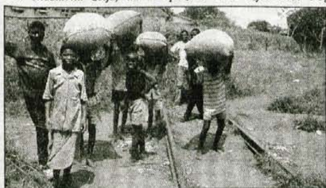
Trdo in slabo plačano delo, toda hvala bogu - vsaj imamo ga.

Dvigovanje sidra je spremljalo prijetno zvončkanje verige. Naslednji cilj je bila ganska luka Takoradi. Okoli Afrike smo potovali v isti smeri, kot so pred stoletji plule prve portugalske ladje. Velika raziskovanja je v 15. stoletju zakrivil človek z imenom Henrik pomorščak. Kot mladenič je spoznal vojaške prednosti ladje v boju z muslimani. V pomorstvu je zaslužil široke možnosti za majhno deželo Portugalsko. Mladi princ se je odločil, da bo svoje življenje zapisal morju in vsem znanostim, ki so povezane z njim. Glavni vzrok za njegova raziskovanja je bila sveta vojna proti islamu. Privlačila pa ga je tudi enostavna želja, da bi spoznal svet.