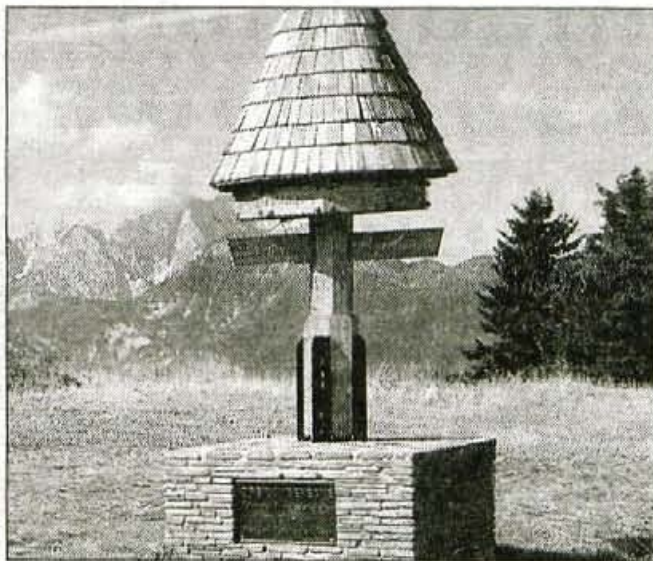
Tromeja med Avstrijo, Italijo in Slovenijo - Tromeja je kraj, kjer se je rodila ideja o olimpiadi treh dežel. Tromeja izžareva simbolično moč središča evropske celine, saj se tu stikajo različni svetovi: romanski, slovanski in germanski. Tromeja simbolizira Evropo prihodnosti, Evropo brez meja, v njej naj bi živel Europaeus sine finibus - Evropejec brez meja.

V tem sporazumu bi načelno postavili temelje skupnim obveznostim in skupnim pravicam na osnovi mednarodnega prava in medsebojnih sporazumov, ki jih imajo med seboj podpisane Italija, Avstrija in Slovenija. K podpisu naj bi pritegnili tudi Italijo z dodatno klavzulo, da je pač njihov uradni predstavnik