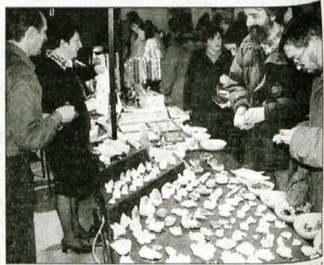
Del utripa na sejm kamnin in mineralov - primerkov si ni bilo moč le ogledati, temveč tudi kupiti.

nite dediščine svojega kraja ter malo geološko zbirko so pred tremi leti na srečanju mladih geologov v Idriji prejeli zlati priznanji. V septembru leta 1995 so sodelovali z Muzejskim društvom Škofja Loka pri pripravi okoljevarstvene akcije od Grebenarja do Kamnitnika, s katero so želeli opozoriti na problematiko zaščitenih, a kljub temu ogroženih območij Škofje Loke. Prav tako so sodelovali v akciji, ki jo je Zavod za šolstvo pripravil ob letu varstva narave z raziskovalno nalogo Naravovarstvena zanimivost mojega kraja. Slednja je bila ob zaključku akcije razstavljena tudi v Cankarjevem domu, problematiko pa so predstavili tudi v mali galeriji Žigonove hiše v Škofji Loki. Kremenčki so ob pomoči mentorice pripravili tudi knjigo z naslovom Kašča in njeni kamni, za katero jim je revija PIL podelila priznanje za najboljšo tematsko številko med šolskimi glasili, Ministrstvo za šolstvo pa jim je na pomladanskem obrtnem sejmu podelilo tudi priznanje za posebne dosežke. Lani so se odpravili po poteh graditeljev Loke ter izdali istoslovnostno knjižico, za omenjeno nalogo pa so na srečanju mladih geologov na Pohorju prejeli zlato priznanje. Letos so sodelovali na raziskovalnem natečaju Rastlina - žival - biotop, kot vodni detektivi pa so prejeli diplomu za raziskoval-