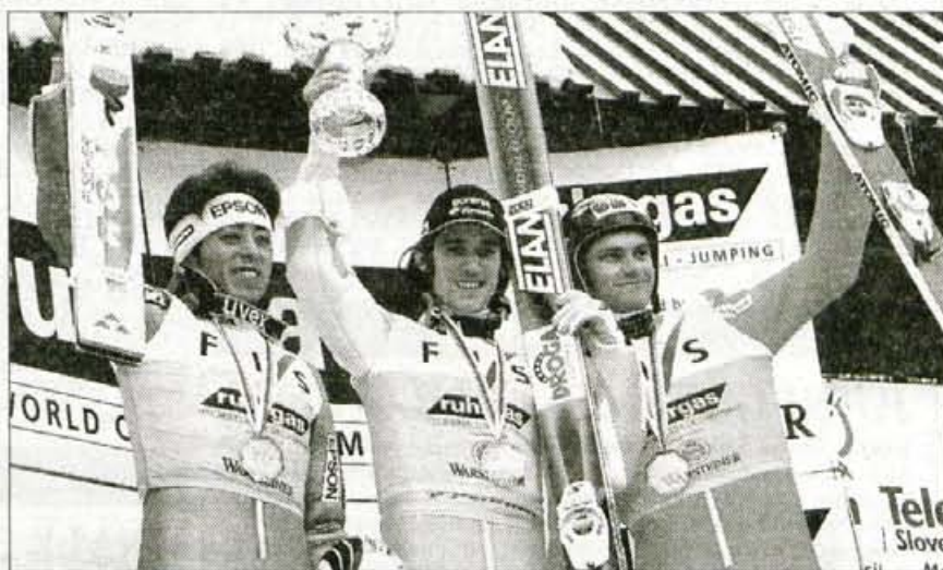
Kristalni globus je že drugič zapovrstjo v rokah našega Primoža Peterke. Ob strani prav tako zadovoljna drugouvrščeni Kazuyoshi Funaki in tretjevrščeni Andreas Widhoelzl.