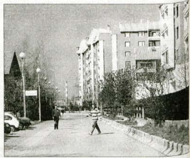
Aleja Tuga Vidmarja, osrednja ulica naselja, namenjena izključno pešcem.

Neuresničen ostaja tudi projekt za izvedbo komunalne opreme, potrjen že januarja 1979, ki vključuje tudi hortikulturno ureditev naselja. Krajevna skupnost bratov Smuk iz občinske bla-