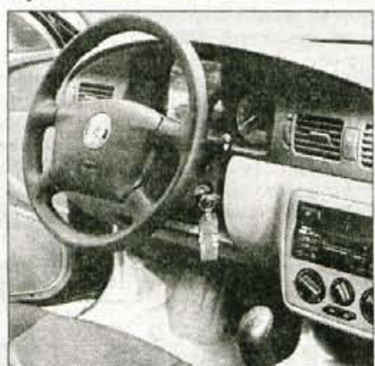
Notranjost deluje nekoliko puščobno, potnikom na zadnji klopi zmanjkuje nekaj centimetrov za kolena.