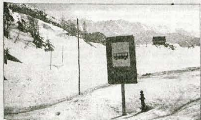
Na vrhu Vršiča: Čakajoč na avtobus, tega pa od nikoder.

S sankanjem po vršički cesti, ki je v zadnjih letih doživelo pravi razevet, tako ali tako zaradi mile zime že od sredine februarja ni nič. Pa vendarle, lepa marčevska sredi je obetala prijeten pohod do vrha Vršiča, in če bo sneg še dovolj trden, tudi spust s sanmi po cesti z vrha do 17. ovinka, do koder je bela odeja še dovolj debela. V spodnjih ridah je bila cesta suha in kopna, kaj kmalu pa se je pojavil prvi ovinek v senčni legi, v katerem so se gume na avtomobilu tudi prvič zavrtle v prazno. V vsakem naslednjem je bilo več snega, in ker s seboj nisem imel snežnih verig, je bilo najbolj pametno parkirati kar na parkirišču pri ruski kapelici.